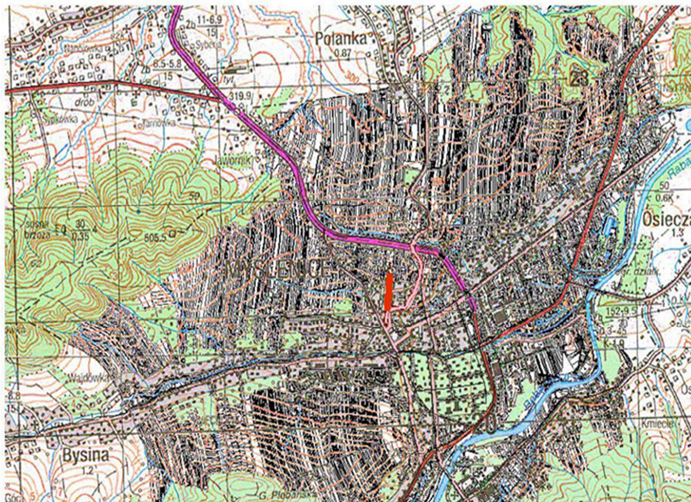
Orientacja drogi powiatowej nr K1943 ul. Traugutta - fragment położony w m. Myslenice, obręb nr 2, nr działki 1022