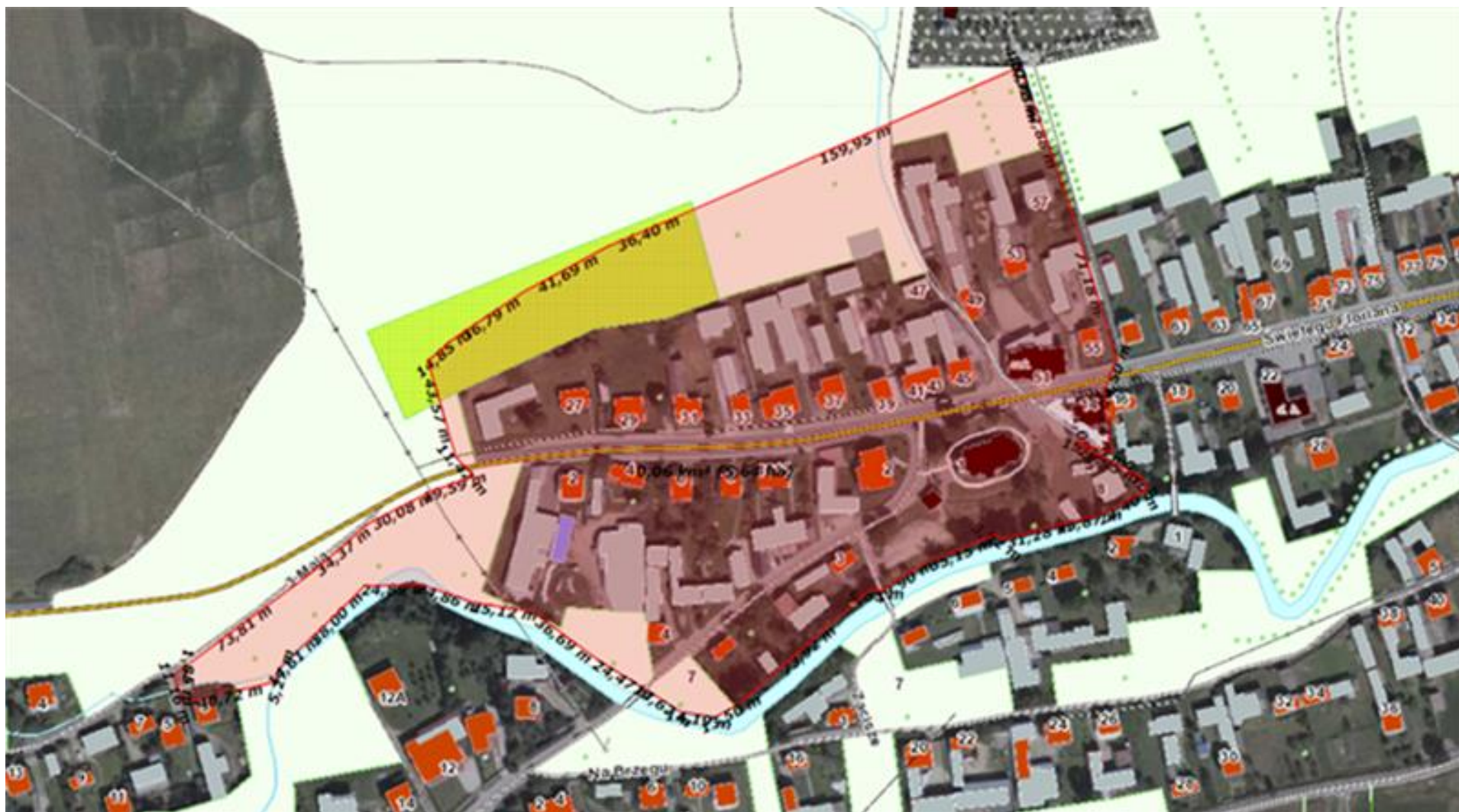
Podobszar rewitalizacji Niedzica