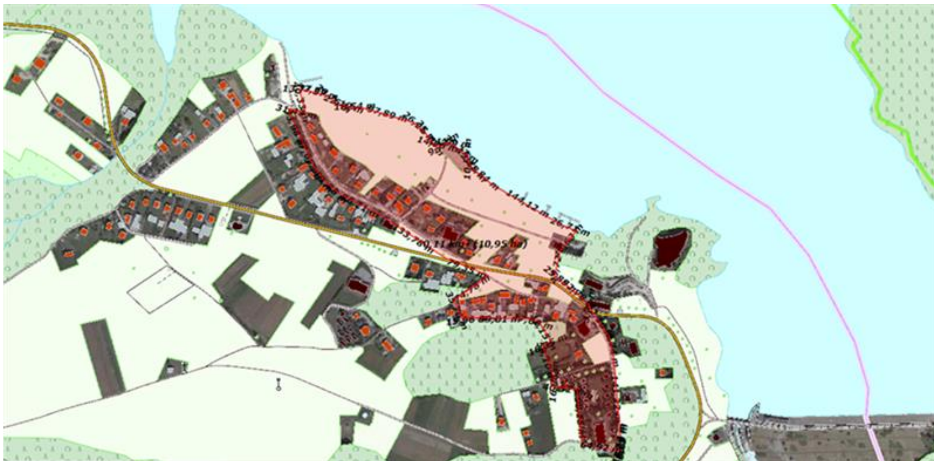
Podobszar rewitalizacji Trybush