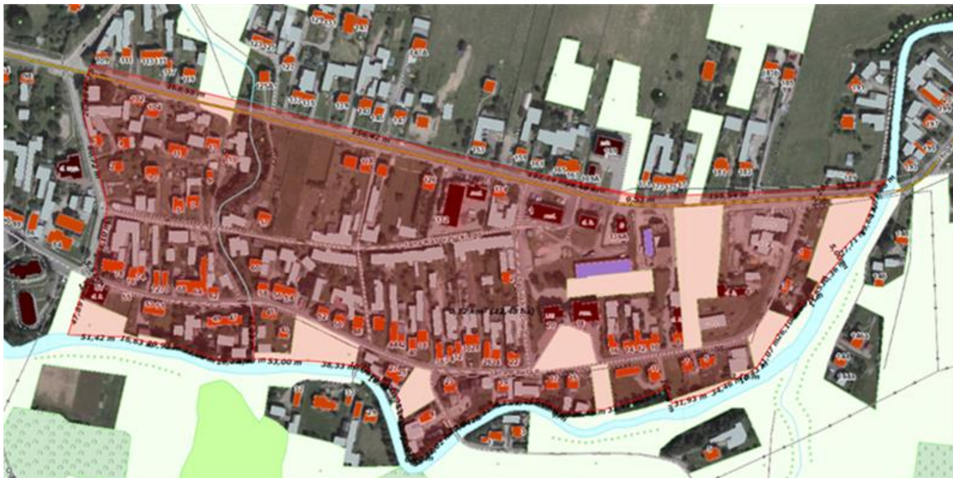
Podobszar rewitalizacji Łapsze Wyżne