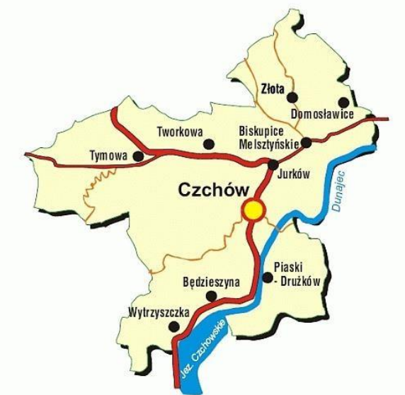
Rysunek 1. Położenie Gminy Czchów.

Ważną funkcję komunikacyjną pełnią również drogi powiatowe. Łączna długość dróg powiatowych na terenie gminy wynosi 17,273 km. Ponadto na terenie Gminy Czchów istnieje 123 km dróg gminnych i lokalnych wiejskich o nawierzchni ulepszonej (bitumiczne, tłuczniowożwirowej), w tym ok. 35 km dróg gruntowych.