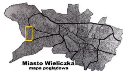
Miasto Wieliczka mapa poglądowa