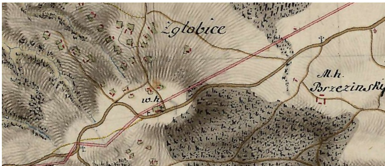
Zgłobice na mapie topograficznej Galicji z lat 1779-1783 (tzw. mapa Miega). Droga zaznaczona kolorem różowym to niezrealizowany wariant drogi z Tarnowa do Krakowa.

Układ historyczny : wschodnia część wsi przedstawia typ wielodrożnicy.