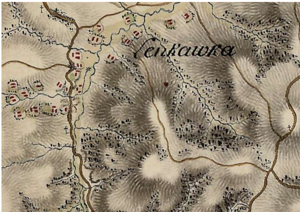
Łękawka na mapie topograficznej Galicji z lat 1779-1783 (tzw. mapa Miega).

Dawne nazwy: Lankawka minori , Łękawica Mała, Lakawka , Łukawka.