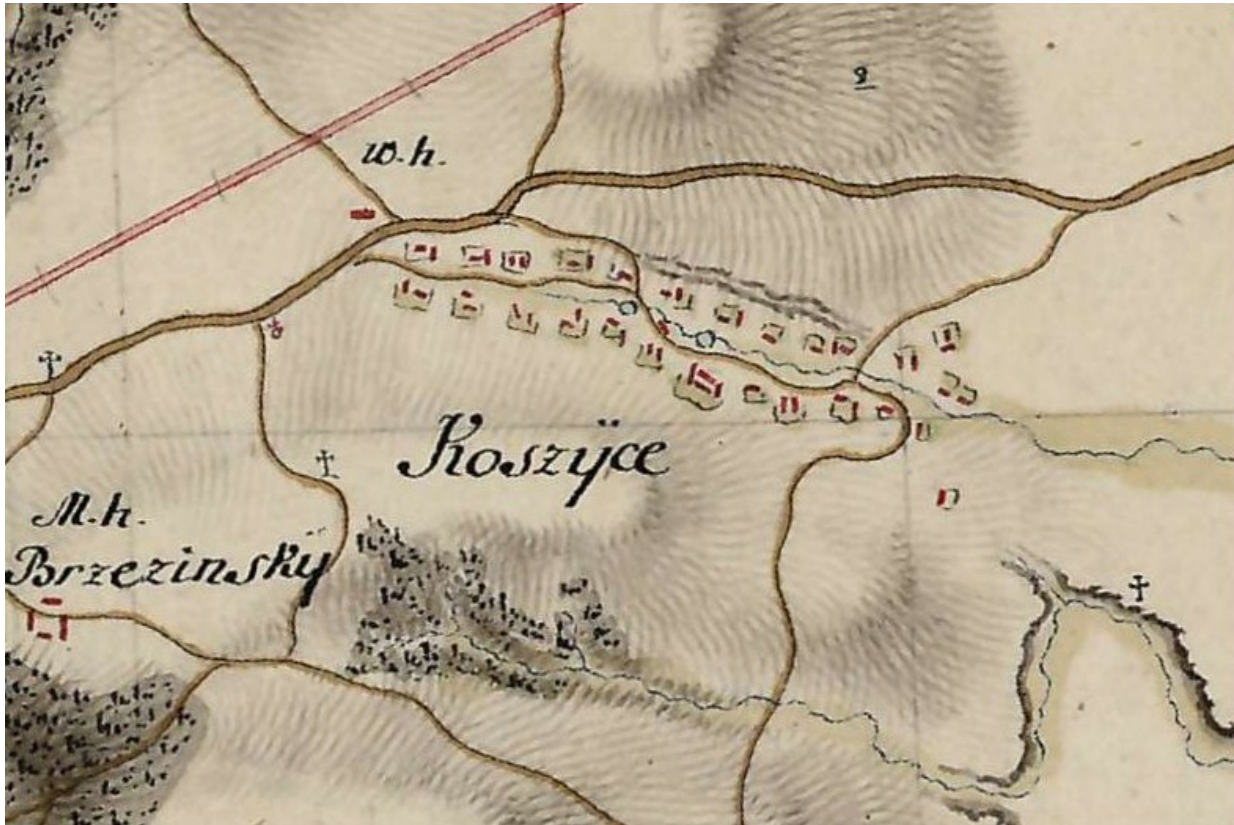
Koszyce Wielkie na mapie topograficznej Galicji z lat 1779-1783 (tzw. mapa Miega). Droga zaznaczona kolorem różowym to niezrealizowany wariant drogi z Tarnowa do Krakowa.