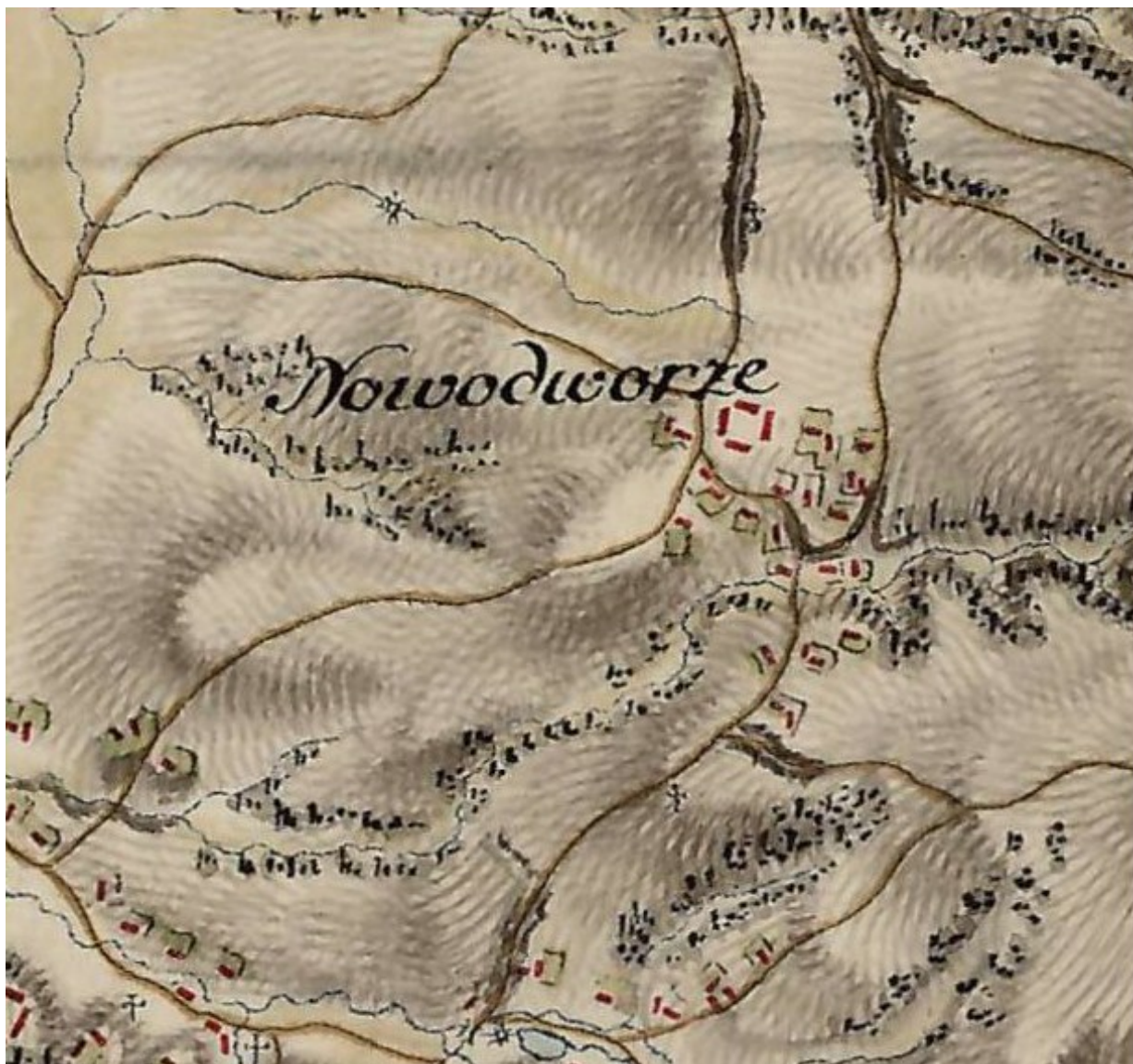
Nowodworze na mapie topograficznej Galicji z lat 1779-1783 (tzw. mapa Miega).

Dawne nazwy: Przewrocze, Nowy Dwór, Nowodwórze.