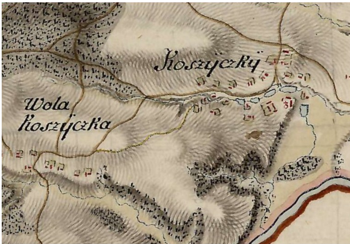
Koszyce Małe na mapie topograficznej Galicji z lat 1779-1783 (tzw. mapa Miega).