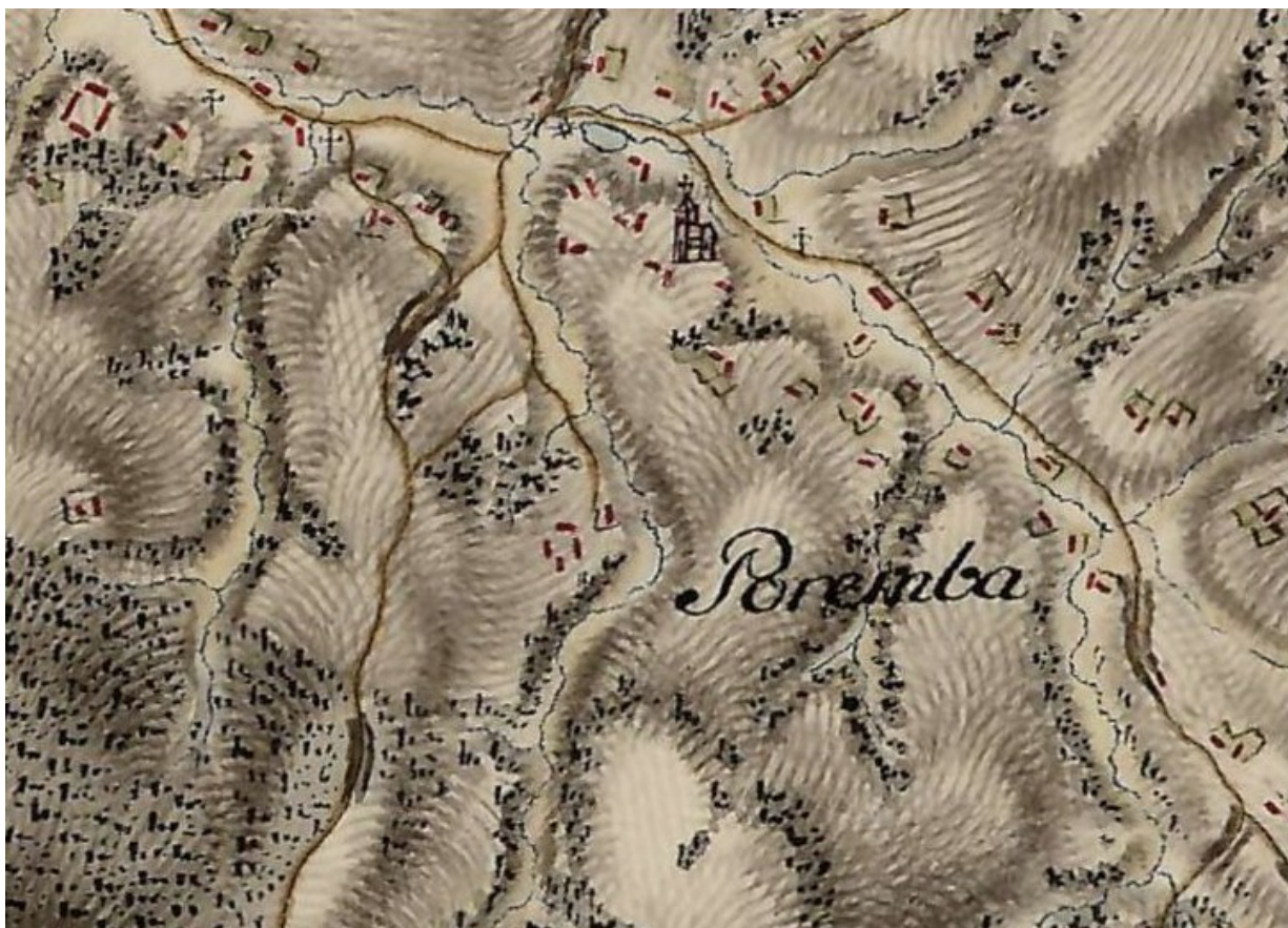
Poręba Radlna na mapie topograficznej Galicji z lat 1779-1783 (tzw. mapa Miega).