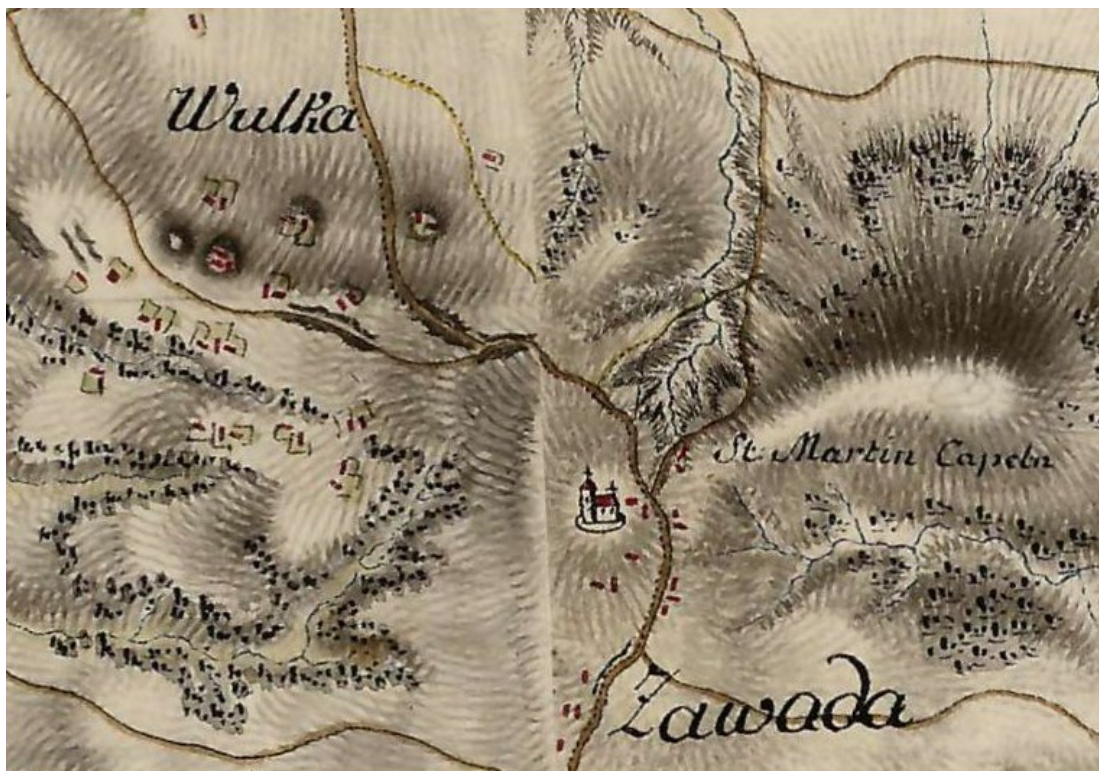
Zawada na mapie topograficznej Galicji z lat 1779-1783 (tzw. mapa Miega)

Dawne nazwy: Podgrodzie seu Zawada, Zawada vel Podgrodzie, Zawada et Pothgrodzie.