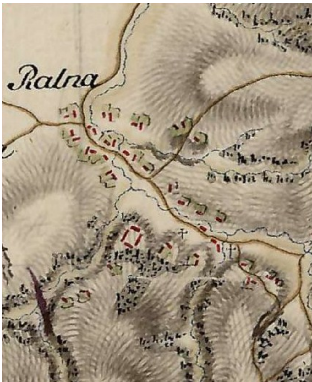
Radlna na mapie topograficznej Galicji z lat 1779-1783 (tzw. mapa Miega).