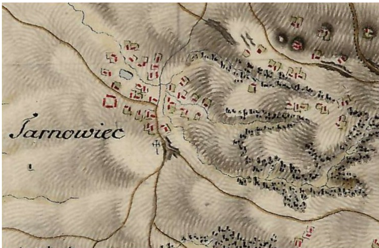
Tarnowiec na mapie topograficznej Galicji z lat 1779-1783 (tzw. mapa Miega).

Dawne nazwy: Tarnou, Tarnowek, Parvum Tharnow, Parvum Tharnovecz, Tharnowiecz.