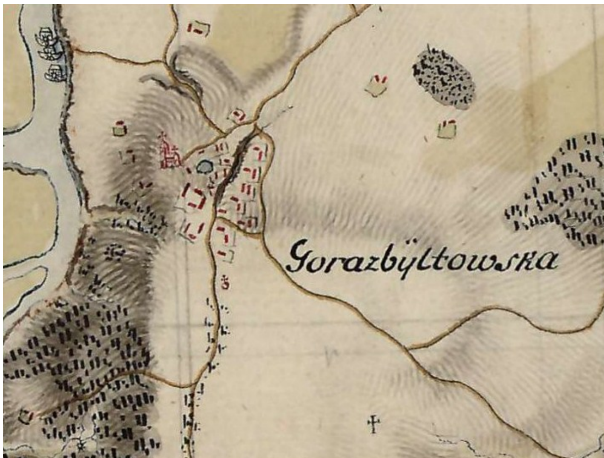
Zbylitowska Góra na mapie topograficznej Galicji z lat 1779-1783 (tzw. mapa Miega)

Dawne nazwy: Gorra, Góra, Gora Zbiltowskiego, Zbyltowska Góra, Zbyłtowska Góra.