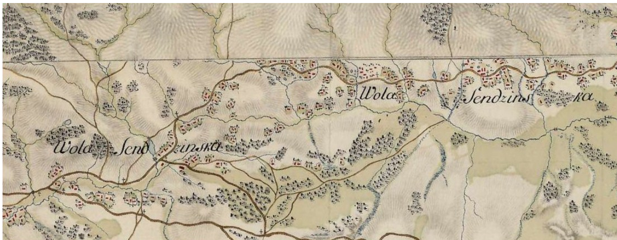
Wola Rzędzińska na mapie topograficznej Galicji z lat 1779-1783 (tzw. mapa Miega).

Dawne nazwy: Wolia Zendzinska, Rzędzińska Wola.