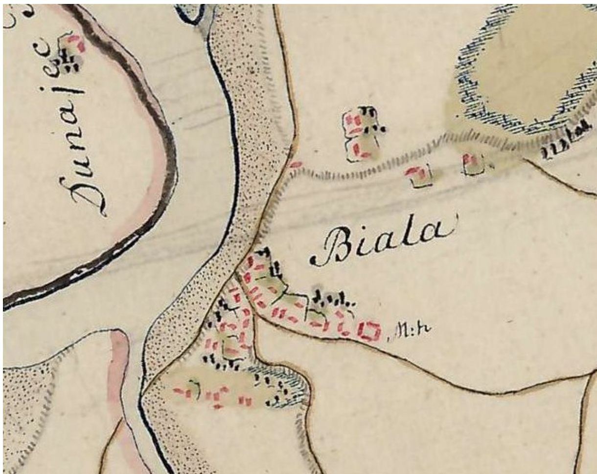
Biała na mapie topograficznej Galicji z lat 1779-1783 (tzw. mapa Miega)