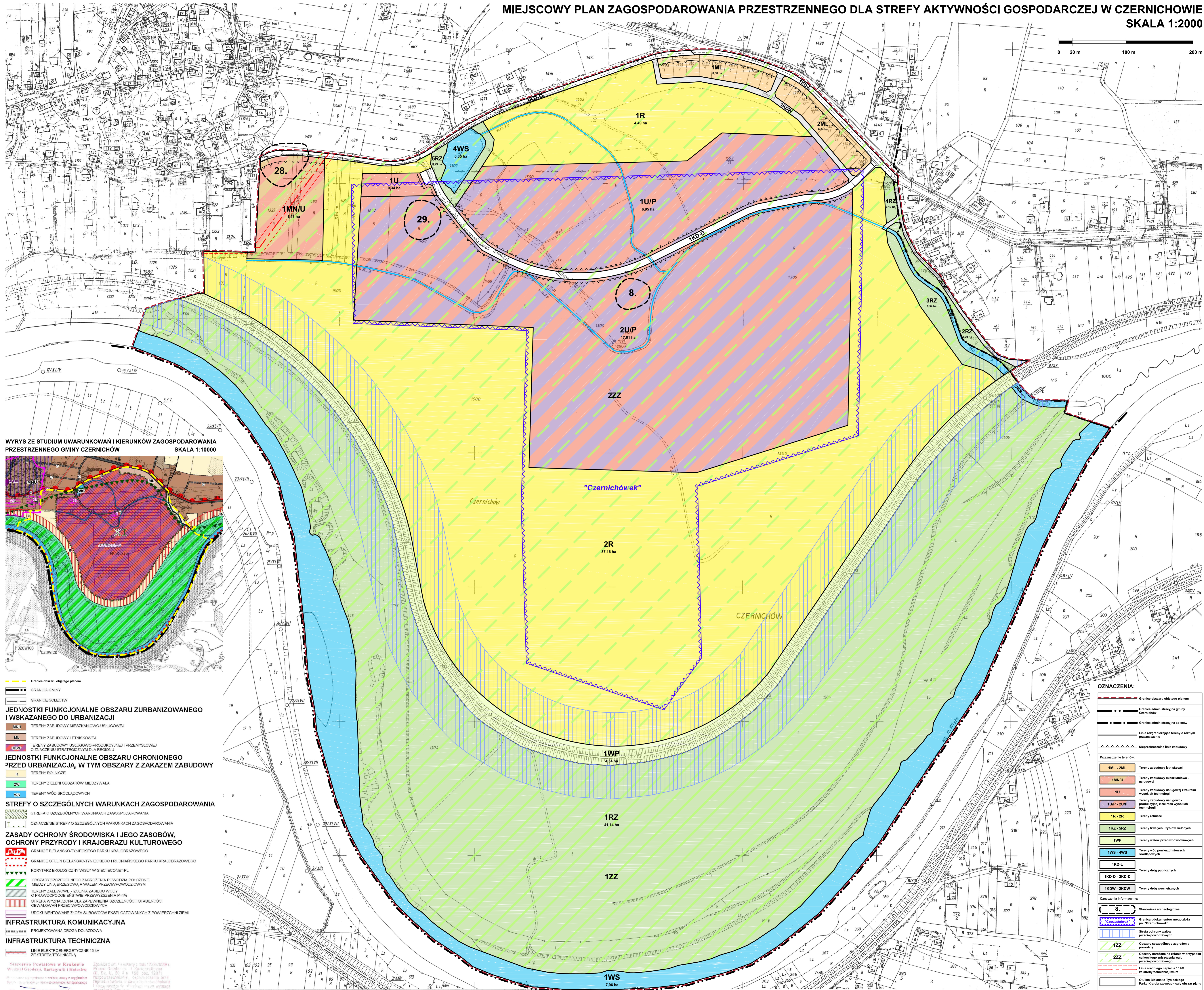
WYRYS ZE STUDIUM UWARUNKOWAŃ I KIERUNKÓW ZAGOSPODAROWANIA PRZESTRZENNEGO GMINY CZERNICHOW SKALA 1:10000