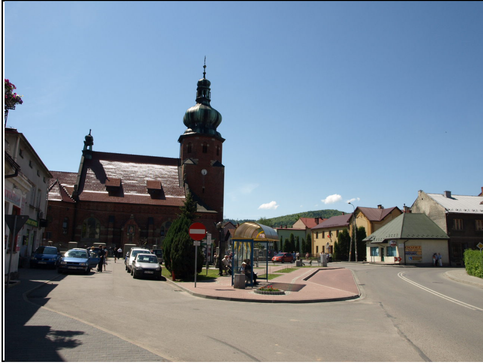
Fot. 5. Zembrzyce – centrum