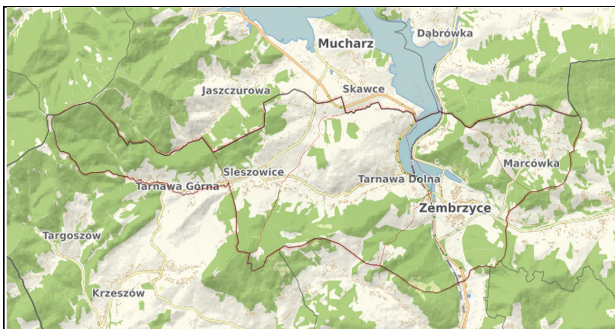
Ryc. 3. Sołectwa gminy Zembrzyce

Jako priorytet rozwojowy uznano tu rozwój usług związanych z edukacją, kulturą oraz rekreacją i sportem. Utrzymanie wysokiego poziomu tych usług ma przyczynić się w przyszłości do zahamowania niekorzystnych tendencji demograficznych i sprzyjać rozwojowi społecznemu i gospodarczemu. Szczególną uwagę zwrócono na działania promujące dziedzictwo kulturowe gminy jako narzędzie sprzyjające szybkiemu rozwojowi.