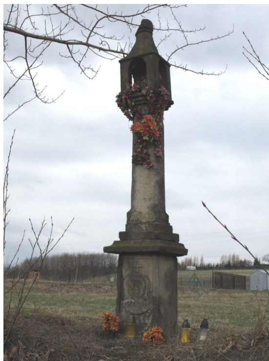
Fot. 9. Śleszowice. Kapliczka p.w. MB Bolesnej z1847 r. Fot. 10. Śleszowice. Kamienna latarnia umarłych z 1778 r.