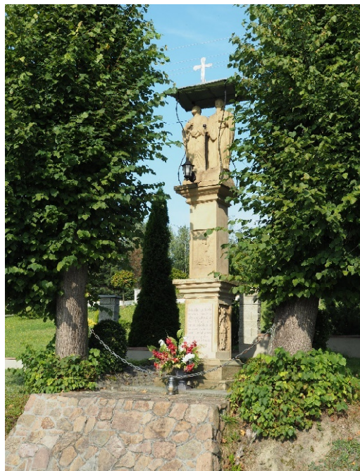
Fot.7. Marcówka. Kaplica Matki Bożej z 1897 r.