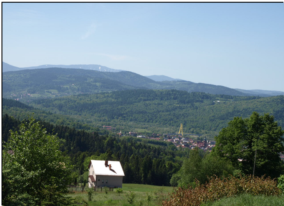
Fot.1. Krajobraz kulturowy gminy Zembrzyce

Przedmiotem opracowania „Programu Opieki nad Zabytkami Gminy Zembrzyce na lata 2021-2024” jest wskazanie dziedzictwa kulturowego funkcjonującego w granicach administracyjnych Gminy oraz niezbędnych działań służących jego zachowaniu i właściwego utrzymania jego stanu. Dokument ten nie stanowi aktu prawa