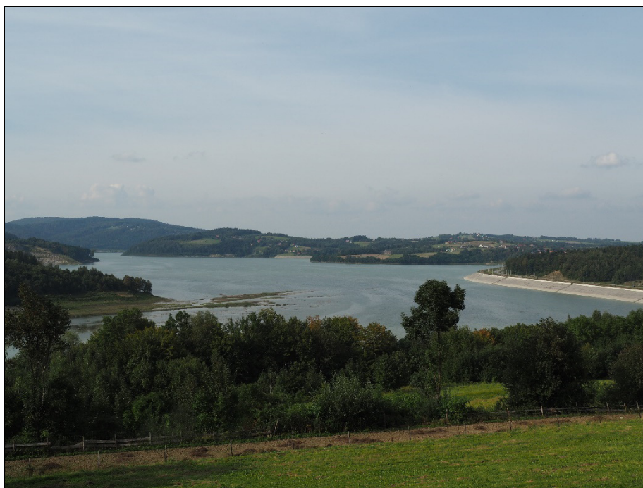
Fot. 2. Krajobraz przekształcony inwestycją budowy zbiornika wodnego

Program Opieki nad Zabytkami Gminy Zembrzyce zakłada powiązanie tych działań z działaniami edukacyjnymi i promocyjnymi które służyć będą podtrzymaniu wśród społeczności świadomości wspólnoty kulturowej opartej o lokalne wartości i wspólne korzenie. Wspólna dbałość o zachowanie wartości kulturowych wzmacnia bowiem poczucie tożsamości i identyfikację jednostki z miejscem życia i pracy, przyczynia się do integracji lokalnej społeczności.