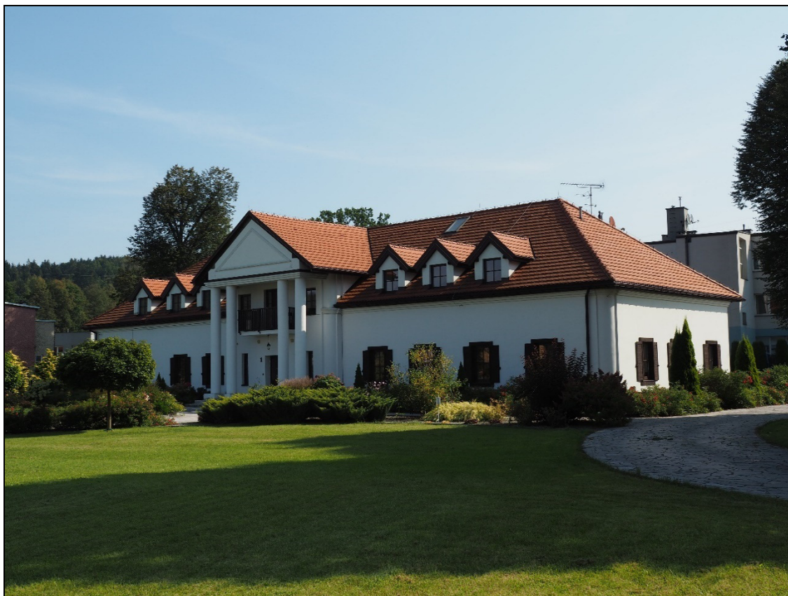
Fot.3. Zabytkowy dwór w Zembrzycach z pocz. XIX w.