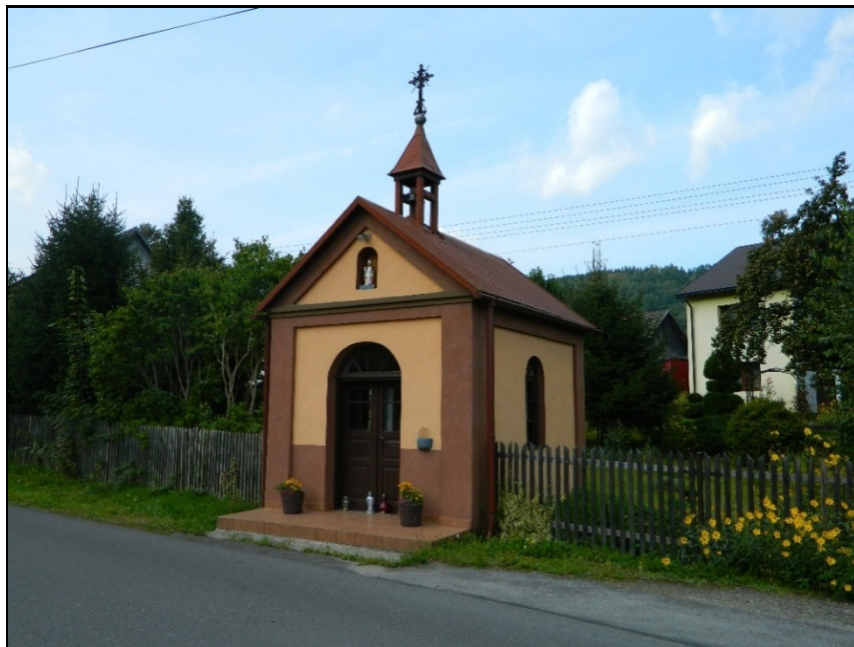
Fot.11. Tarnawa Górna. Kapliczka p.w. MB Częstochowskiej z k. XIX w.

„Podpagórek” i Harańczykowa Góra, prawie całkowicie zalesiona. Wschodnia część wsi jest terenem dolinnym, a część zachodnia obszarem górzystym obejmującym strome zbocza Harańczykowej Góry. Wiejska zabudowa zagrodowa skupiona jest luźno wzdłuż głównej drogi wiejskiej łączącej ze Śleszowicami, wytyczonej z biegiem potoku Tarnawki, dopływu Skawy.