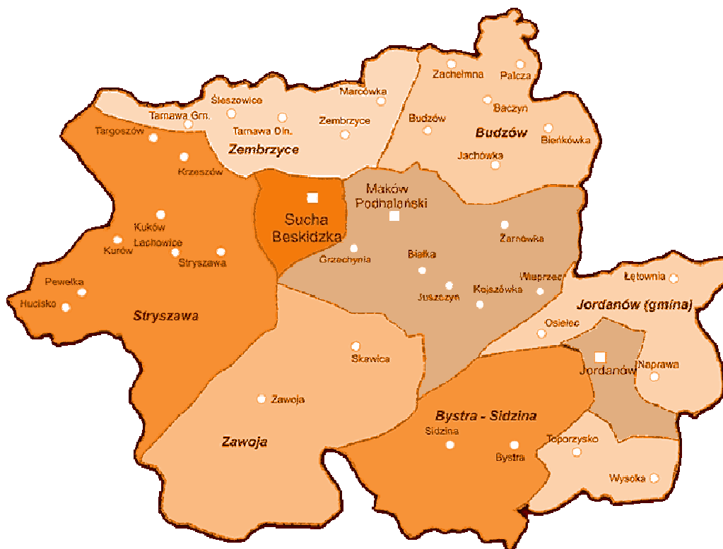
Ryc. 1. Zembrzyce na mapie powiatu suskiego