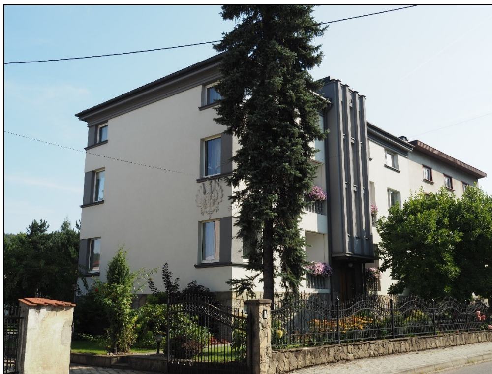
Fot.14. Zembrzyce. Modernistyczna willa z lat 1930-tych.

- krajobraz przyrodniczy gminy Zembrzyce jest typowy pod względem fizycznogeograficznym dla obszarów podgórskich. Obszar położony jest na pograniczu dwóch mezoregionów – Beskidu Małego oraz Beskidu Makowskiego. Przez Gminę przepływa rzeka Skawa na której wzniesiono zaporowy zbiornik retencyjny „Świnna Poręba”, część zbiornika znalazła się w granicach administracyjnych Gminy. Krajobraz charakteryzują otaczające miejscowości masywne grzbiety i stoki wzniesień o dużych spadkach oraz głębokie doliny rzek i potoków (Skawy, Paleczki i Tarnawki) miejscami z szerszymi terasami na których położone są łąki i pastwiska. Tereny upraw rolnych zajmują obszary położone głównie u podnóża wzniesień i tereny wyższe, śródleśne położone na stokach. Charakterystyczne dla krajobrazu gminy jest znaczne jej zalesienie (ok.40 %) z drzewami liściastymi, iglastymi, endemicznymi i pochodzącymi zalesień.