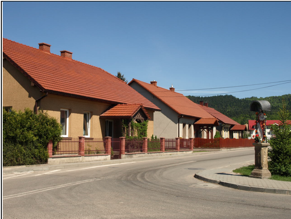
Fot.6. Fragment zabudowy Zembrzyc - ul. ks. Kobyleckiego