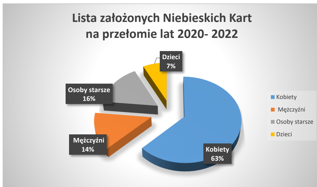
Wykres 1. Źródło Zespół Interdyscyplinarny ds. Przeciwdziałania Przemocy w Rodzinie w Starym Sączu, stan na 31.10.2022r.

Na przestrzeni trzech lat można zaobserwować, iż w okresie nasilenia pandemii COVID-19 tj. w roku 2021 odnotowuje się największy przyrost wszczęcia procedur Niebieskiej Karty.