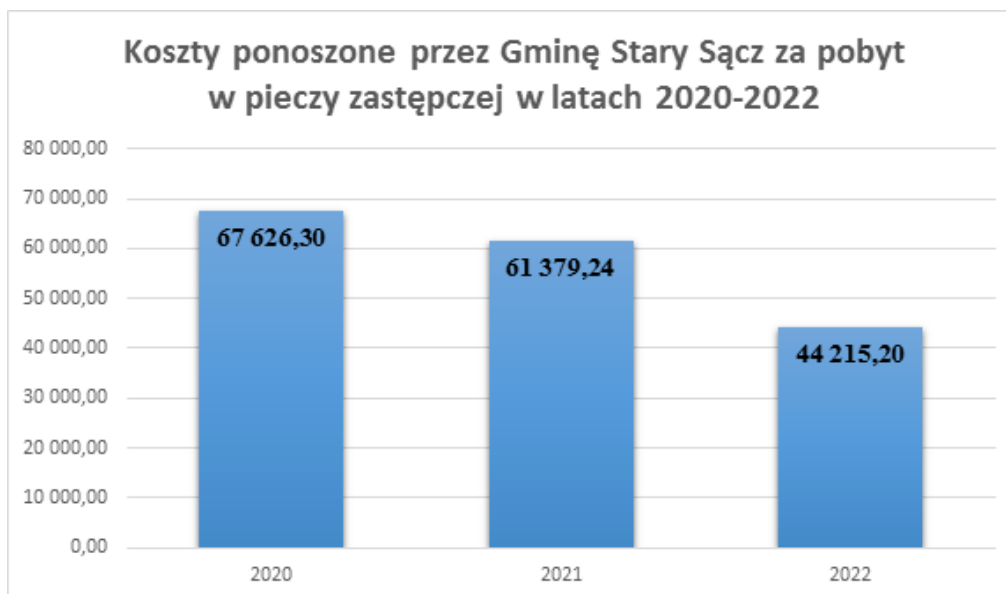
Wykres 3. Źródło własne PWD Stary Sącz, stan na 31.10.2022r.

Zestawienie kosztów obrazuje wykres nr 3.