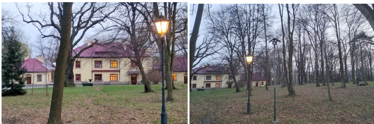
Zdjęcia nr 15, 16. Zespół dworski w Owczarach, autor: Jakub Danielski, czerwiec 2022 r.

Dwór otoczony jest parkiem krajobrazowym, założonym w 2 poł. XVIII w. i przekomponowanym na przeł. XIX/XX w. Wśród parkowych drzew aż 11 objętych jest ochroną przyrody jako pomniki przyrody (3 buki, 2 dęby, 2 lipy oraz pojedyncze egzemplarze grabu, jesionu, modrzewia oraz sosny). Obecnie mieści się tutaj Dom Pomocy Społecznej 8 .