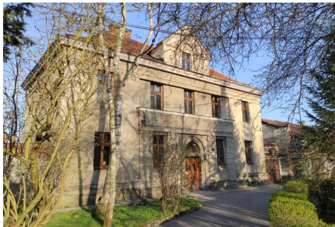
Zdjęcia nr 4, 5. Budynki gospodarcze w zespole dworskim w Czernichowie, czerwiec 2022 r.