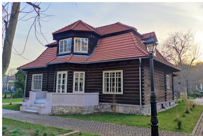
Zdjęcie nr 12. Budynek willi „Japonka” w Krzeszowicach, autor: Jakub Danielski, czerwiec 2022 r.