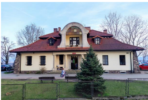
Zdjęcia nr 13, 14. Budynek dyrekcji kopalni w Miękini, autor: Jakub Danielski, czerwiec 2022 r.

Zabytkowy budynek dyrekcji Kopalni porfiru w Miękini powstał przed 1923 r. Aktualnie w obiekcie prowadzi działalność Placówka Opiekuńczo-Wychowawcza „Spokojna Przystań”. To parterowy, murowany budynek, wybudowany w stylu dworskim, nakryty dachem czterospadowym z facjatą z witrażem. W fasadzie wgłębny kolumnowy portyk. W elewacji tylnej znajduje się trójboczny ryzalit.