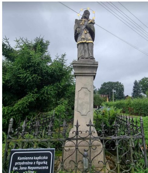
Fotografia 4. Widok na figurę z posągiem św. Jana Nepomucena w Skidzinie.

Figura kamienna. Na dwustopniowej bazie ustawiony czworościenny postument ożywiony oprofilowaniem złożonym z półwałków i skocji oraz płycinami z narożnikami w kształcie łuków odcinkowych. Na jednej z płycin wryty napis: R.P. 1779 D. 17IOBR. Postument wieńczy posąg św. Jana Nepomucena. Figurę otacza ogrodzenie z ozdobnie wykuwanych, żelaznych prętów, zapewne z XX w. We wrześniu 2006 r. ukończona została renowacja i konserwacja zabytku, którą przeprowadziła konserwator sztuki Agnieszka Żydzik. Zdjęte zostały barwne, olejne powłoki malarskie, położone w 2. poł. XX w., a obiekt został zabezpieczony impregnatami przed szkodliwym