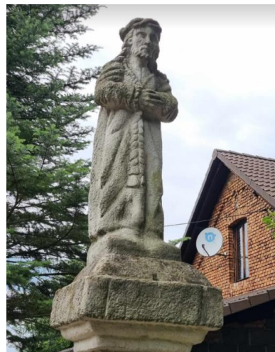
Fotografia 3. Widok na kapliczkę z figurą Chrystusa.

Figura wyrzeźbionego w kamieniu Jezusa w cierniowej koronie jest najprawdopodobniej najstarszym świątkiem na terenie Gminy. Z przekazu ustnego wiadomo, że kapliczka została postawiona pod koniec XVIII lub w pierwszych latach XIX wieku. Przez całe lata była punktem, przy którym brzeszczanie odchodzący w ślad za chlebem czy nauką żegnali rodzinną wioskę, powierzając w modlitwie do Chrystusa swoje dalsze losy. Pod kapliczką