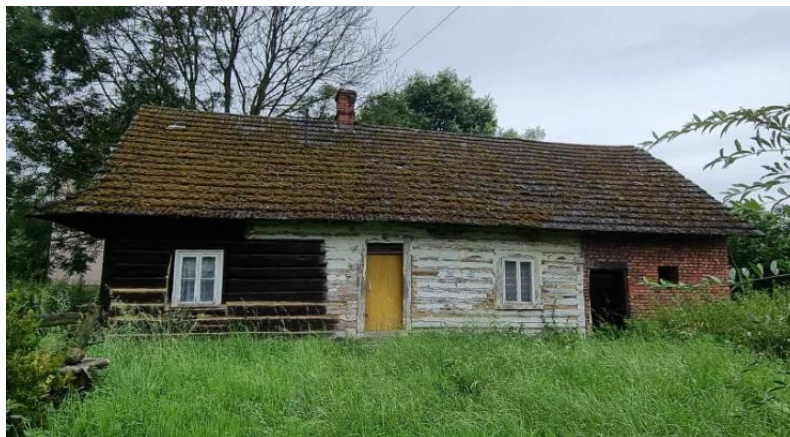
Fotografia 12. Przykład budownictwa drewnianego w miejscowości Zasole.

dwuspadowym, z szalowanymi szczytami. W starszej redakcji występuje bielenie lub oblepianie gliną msze między bekami zrębu. Nowsza redakcja, występująca najliczniej, to niewielki dom o zwartej bryle i dwuizbowym układzie wewnątrz. Część budynków posiada nadal oryginalną stolarkę okienną i drzwiową, a niekiedy także oryginalne belki z inskrypcjami i datami.