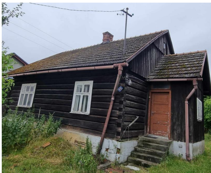
Fotografia 13. Przykład budownictwa drewnianego w miejscowości Przecieszyn.