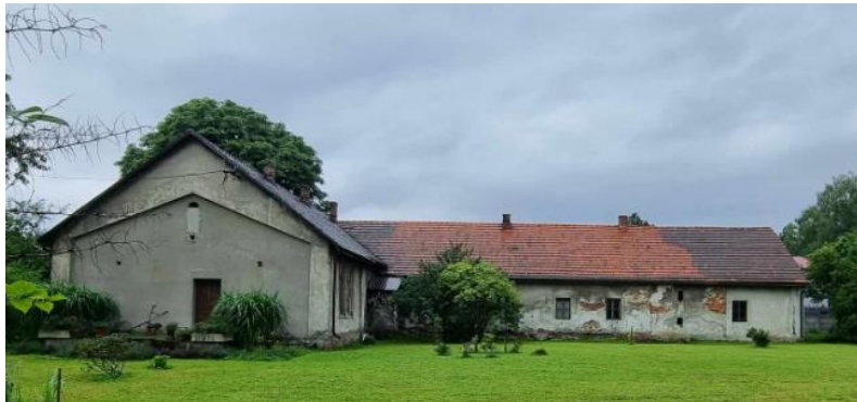
Fotografia 11. Dwór w miejscowości Skidziń.