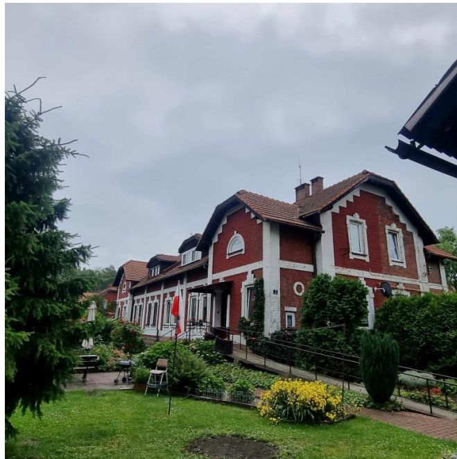
Fotografia 10. Przykład budynku mieszkalnego na terenie osiedla robotniczego Kolonii Urzędniczej.

Kolonia Urzędnicza zlokalizowana jest w niedalekiej odległości od kopalni. To zespół parterowych domów wzniesionych dla dyrekcji, inżynierów i sztygarów. Stan zachowania obiektów dobry.