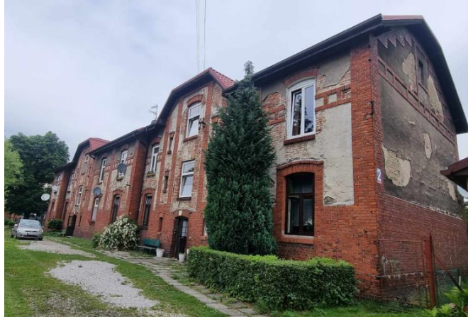
Fotografia 9. Przykład budynku mieszkalnego na terenie osiedla robotniczego Nowej Kolonii.

Stan zachowania większości obiektów dostateczny. Wymagają podjęcia działań konserwacyjnych.