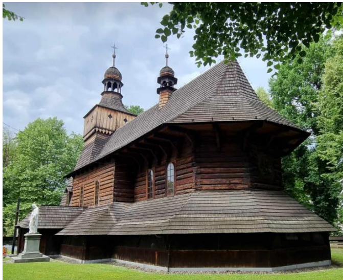
Fotografia 1. Widok na Kościół parafialny p.w. św. Marcina z Tours w Jawiszowicach.

izolowane balustradą o pełnym deskowaniu oraz – powyżej – płytami z pleksi i drobną siatką zabezpieczającą, co tworzy zamkniętą przestrzeń o starannie wykonanej posadzce z płyt kamiennych, w której przygotowywana jest właśnie ekspozycja różnego typu zabytkowych sprzętów kościelnych. W nawie, na osi kruchty południowej, sfazowany, prostokątny portal zamknięty łukiem odcinkowym. Stan zachowania dobry.