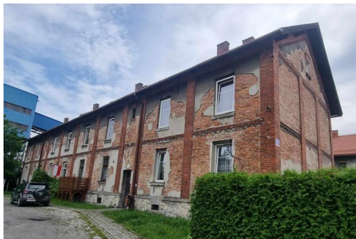
Fotografia 8. Przykład budynku mieszkalnego na terenie osiedla robotniczego Starej Kolonii.

Stan zachowania większości obiektów dostateczny. Wymagają podjęcia działań konserwacyjnych.