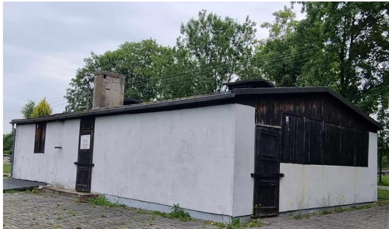
Fotografia 5. Widok na łaźnię podobozu Jawischowitz.