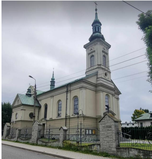
Fotografia 2. Widok na Kościół pw. Urbana w Brzeszczach.