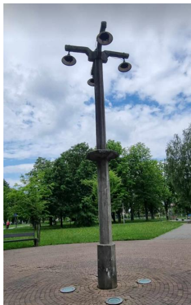
Fotografia 6. Widok na latarnie na terenie podobozu Jawischowitz.