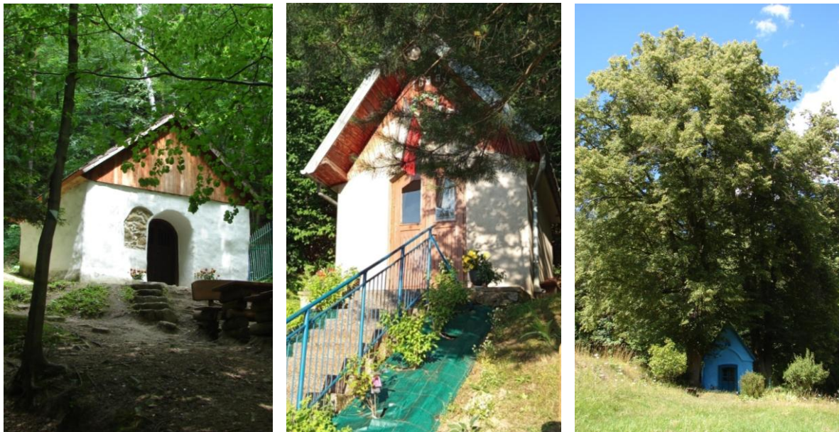
Przykłady kapliczek domkowych – św. Urbana i NSJ w Iwkowej oraz w Kątach

Najstarsza i najcenniejsza (wpisana do rejestru zabytków) to pustelnia św. Urbana (datowana na XVIII wiek), najmłodsza z 1988 roku w Iwkowej (NSJ).