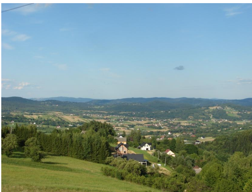
Widok w kierunku północno-zachodnim na Wojakową

Jedynie w miejscowości Kąty można wskazać zwartą, pierwotną zabudowę, związaną prawdopodobnie z nowożytnym dworem i folwarkiem w Kątach, na południe od nich.