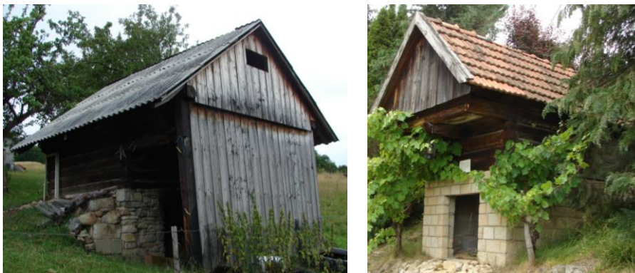
Rodzaje suszarni śliwek w Dobrocieszu i Połomiu Małym.