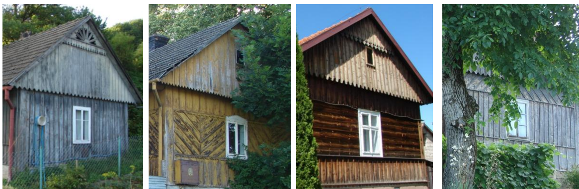
Przykłady szczytów domów drewnianych w Wojakowej, Iwkowej i Kątach

Z dawnej wiejskiej drewnianej zabudowy zachowały się domy, spichlerz, stodoły, obora, kuźnia (między innymi w mini skansenie w Iwkowej). Niestety drewniane, tradycyjne budownictwo zanika. Wśród zachowanych domów można wyróżnić dwa rodzaje. Jeden typ domów, budowanych w początkach XX wieku, charakteryzuje się szczególną dbałością o snycerski detal. Były to domy zrębowe, na planie wydłużonego prostokąta, nakryte dachem dwuspadowym, o elewacji pięcio-, a nawet siedmioosiowej, podpiwniczone, z charakterystyczną dobudówką gospodarczą od tyłu. Elewacje były szalowane, często w dekoracyjny sposób: „w jodełkę”, pionowo i poziomo. Zakończenia desek szalunkowych w szczytach bywały ozdobnie kształtowane. Domy posiadały drewniane okna skrzynkowe, czteropolowe oraz płycinowe drzwi z nadświetlem.