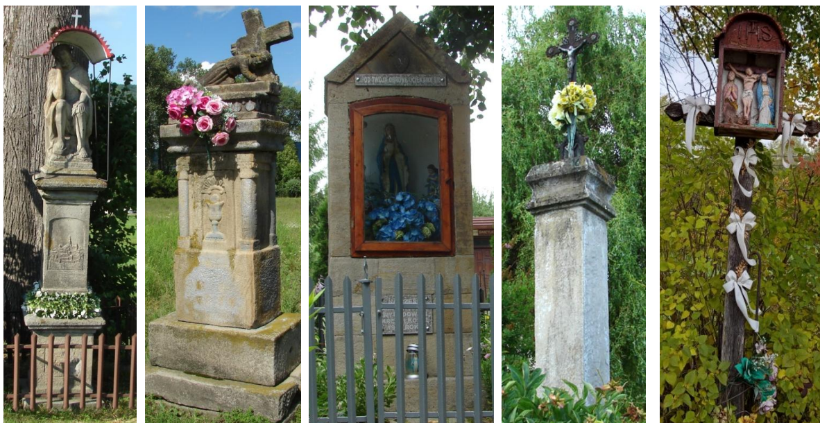
Rodzaje figur i krzyże przydrożnych - figura Chrystusa Frasobliwego w Iwkowej, upadek Chrystusa pod Krzyżem w Kątach, kapliczka słupowa, murowana w Połomiu Małym, krzyż żeliwny w Drużkowie Pustym, drewniana kapliczka skrzynkowa w Iwkowej (nie ujęta w GEZ)