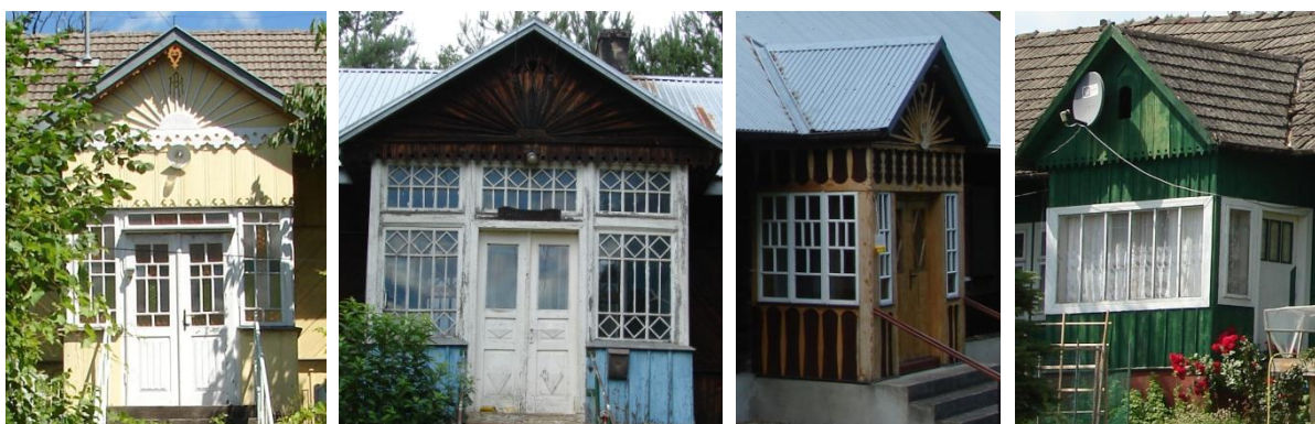
Przykłady najbardziej dekoracyjnych ganków domów drewnianych w Kątach, Połomiu Małym, Wojakowej i Iwkowej.

Drugi typ domów drewnianych budowanych w połowie XX wieku wyróżnia się dobudowanym od frontu gankiem, wykonanym w technice szkieletowej, nakrytym dwuspadowym daszkiem, z dużymi wielodzielnymi oknami. Tradycja budowania tego rodzaju ganków powinna być nadal kultywowana na terenie gminy Iwkowa.