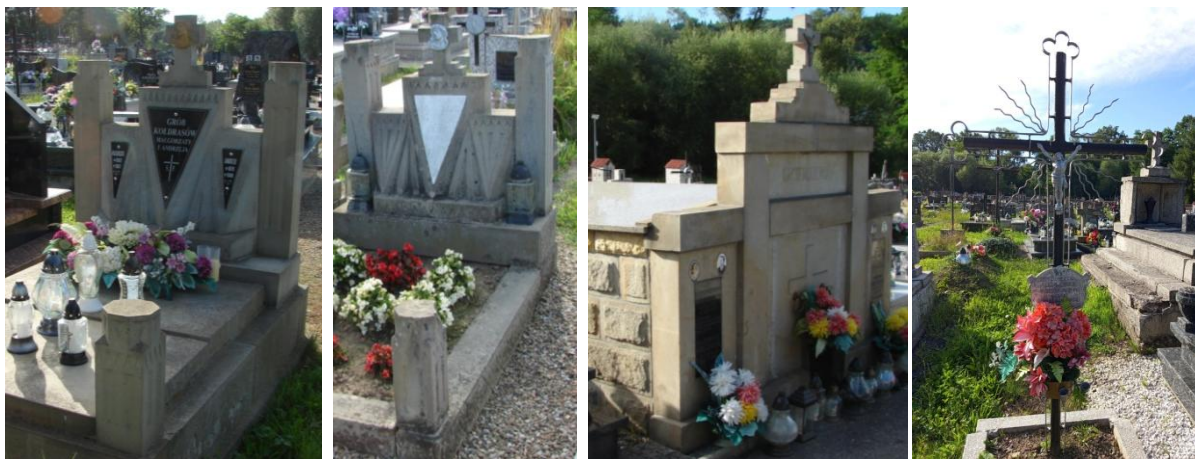
Przykłady nagrobków i grobowców na cmentarzu parafialnym w Wojakowej.

Elementem krajobrazu kulturowego są kościoły i cmentarze w Iwkowej i Wojakowej. Kościół parafialny w Wojakowej został ufundowany przez Wojaka herbu Brochwicz w 1368 roku, na miejscu prawdopodobnie kościoła drewnianego. Do parafii pod wezwaniem Wniebowzięcia NMP należały miejscowości: Wojakowa, Kąty, Połom Mały, Porąbka Iwkowska i Dobrociesz. Kościół był murowany z kamienia, gotycki. Przetrwał do lat 30-tych XX wieku, kiedy to z uwagi na zły stan rozebrano korpus nawowy, zachowano prezbiterium i dobudowano do niego nową, większą nawę. Kościół usytuowano na łagodnym cyplu (obecnie znacznie przekształconym) nad rzeką Bialką. Od strony północnej w XIX wieku założono cmentarz, który obecnie jest zarośnięty. Współcześnie, przed terenem cmentarza ustawiono obelisk (pomnik) oraz odremontowano kilkanaście zabytkowych nagrobków. Nowy cmentarz parafialny w Wojakowej założono na początku XX wieku na południe od kościoła. Zachowanych jest jeszcze kilkanaście nagrobków kamiennych z połowy XX wieku, o charakterystycznym, typowym dla tego regionu wyglądzie.