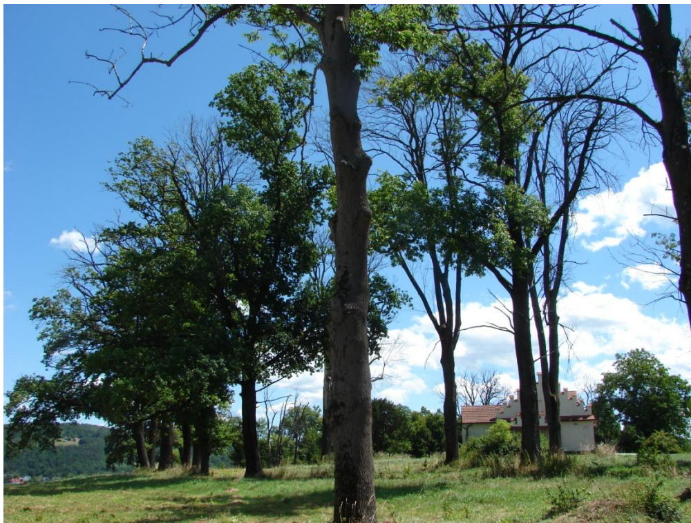
Dwór i park w Kątach.

Za wyjątkiem kościołów, kapliczek, krzyży przydrożnych i cmentarzy, dawny krajobraz kulturowy gminy Iwkowa szybko zanika. Widoczne jest to w rozwoju przestrzennym gminy, zmianie sposobu budownictwa – zanik tradycyjnych, drewnianych domów, podziale działek itp.