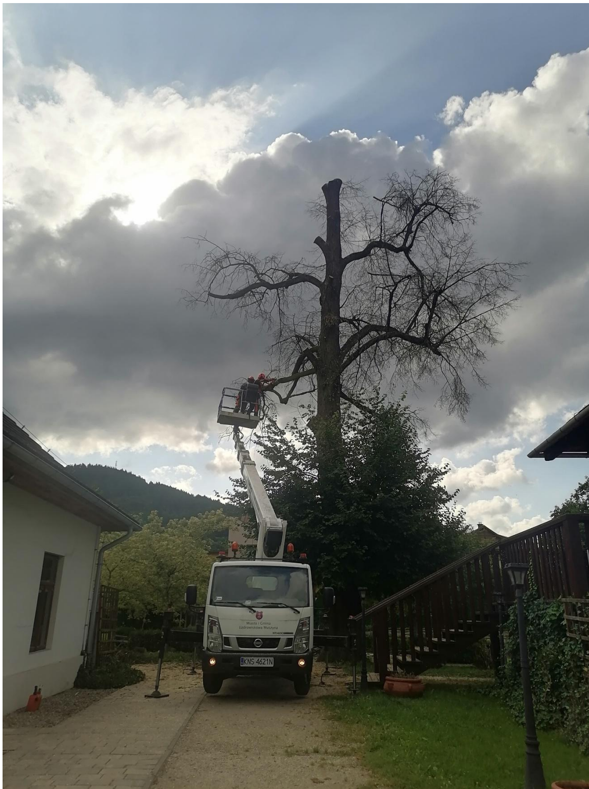
Zdjęcia przedstawiają pomnik przyrody podczas prac pielęgnacyjnych w dniu 11 sierpnia 2025 r.