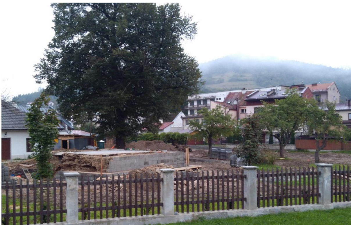
Zdjęcie przedstawia pomnik przyrody „Fraszka” oraz powstający obok niej nowy budynek oraz część parkowa. Poniżej zdjęcie przedstawia nowe otoczenie pomnika przyrody (2019-2020 r.)