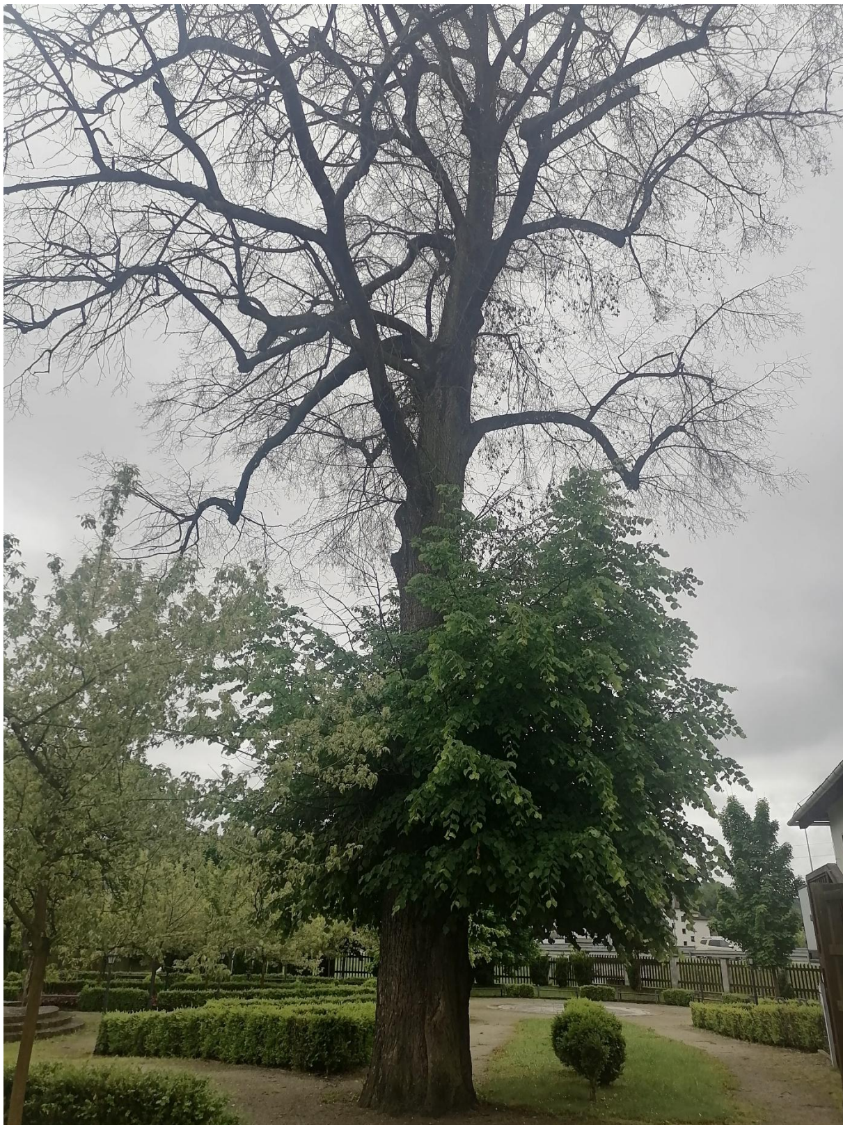
Zdjęcie przedstawia pomnik przyrody w czerwcu 2025 r.