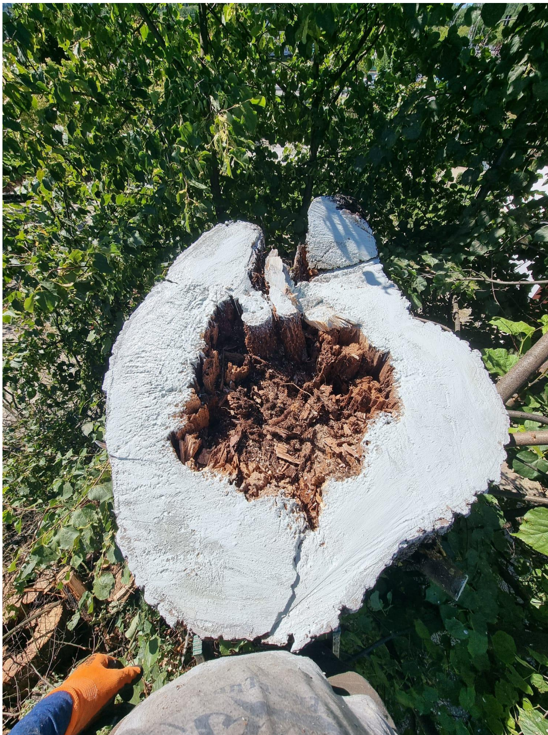
Zabezpieczenie środkiem dezynfekującym powierzchni powstałej po usunięciu martwej części drzewa