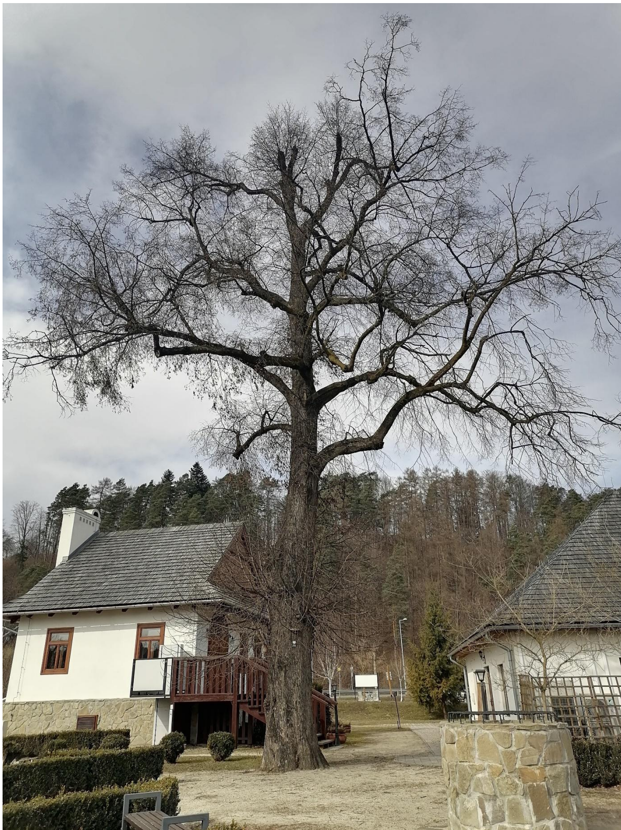
Zdjęcie przedstawia pomnik przyrody w marcu 2025 r.