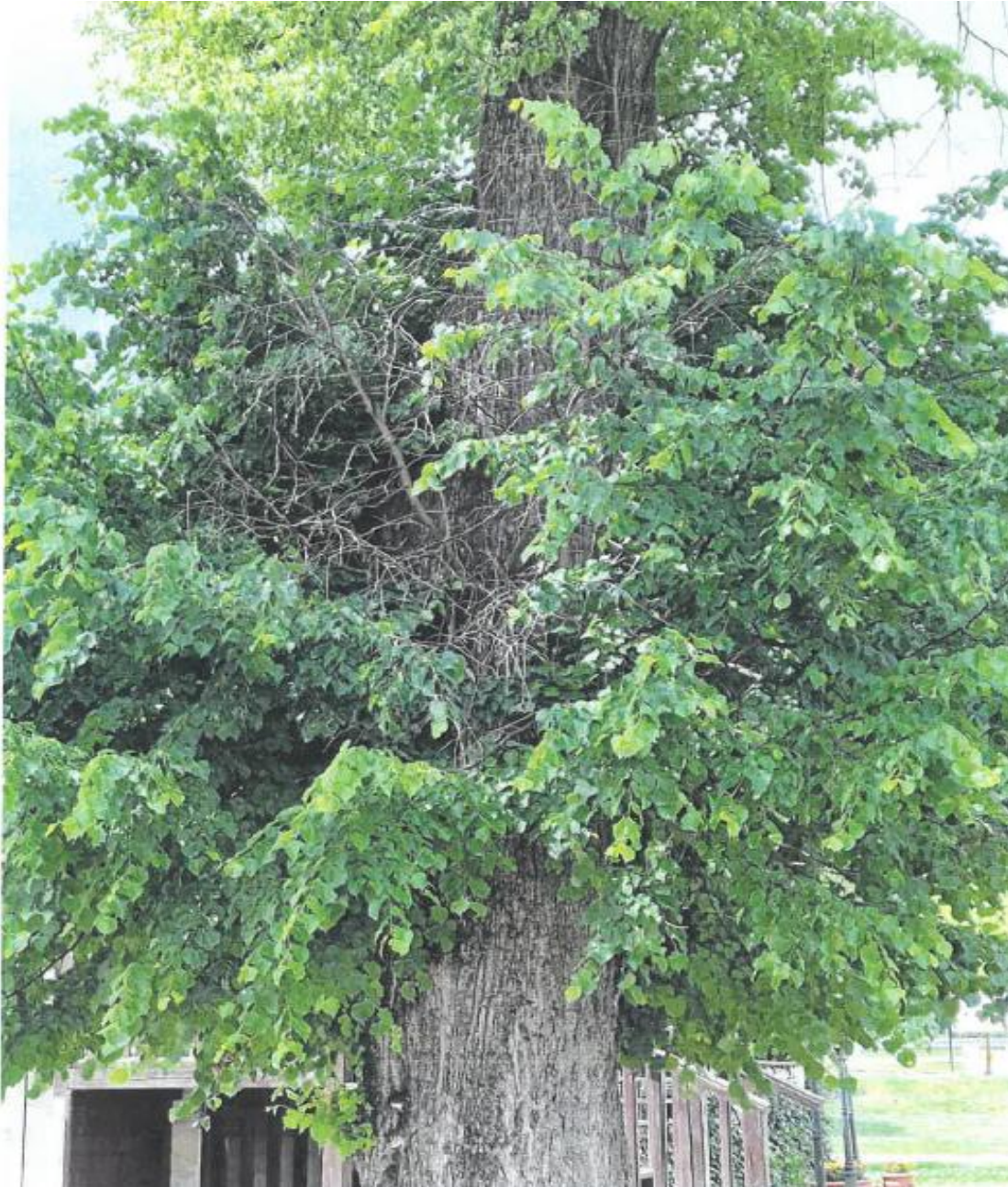
Zdjęcie przedstawia pomnik przyrody w maju 2024 r.