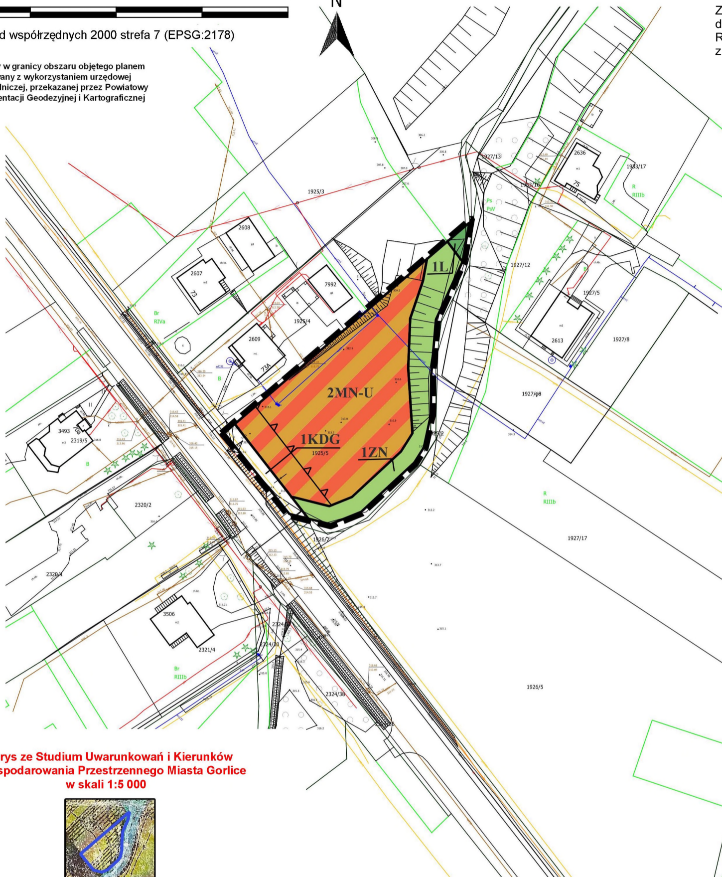
Wyrys ze Studium Uwarunkowań i Kierunków Zagospodarowania Przestrzennego Miasta Gorlice w skali 1:5 000

Podkład mapowy w granicy obszaru objętego planem został przygotowany z wykorzystaniem urzędowej kopii mapy zasadniczej, przekazanej przez Powiatowy Ośrodek Dokumentacji Geodezyjnej i Kartograficznej w Gorlicach