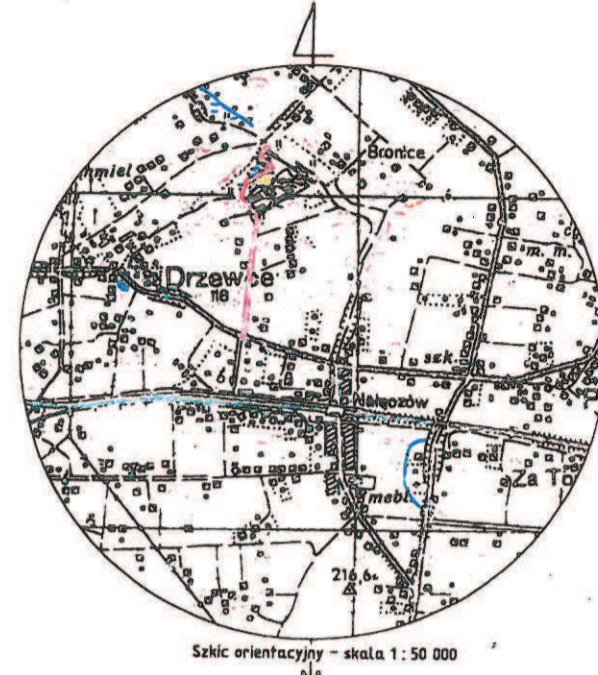
Szkic orientacyjny - skala 1:50 000

Załącznik do uchwały NR XXIII/189/16 Rady Miejskiej w Nałęczowie z dnia 15.12.2016r.