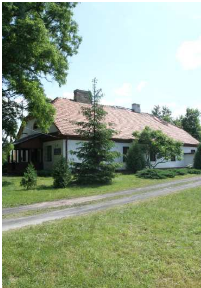
Leśniczówka w Puchaczach

Budynek użytkowany jest na cele terapeutyczne Fundacji Pomocy Osobom Uzależnionym i ich Rodzinom we wsi Dołha.