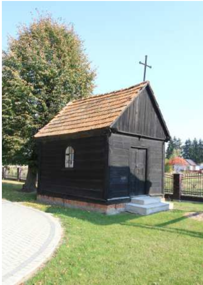
Kaplica drewniana w Kożuszkach

Kaplica drewniana położona jest w pd.-zach. części placu przykościelnego. Wybudowana została w 1 poł. XIX w., na obecne miejsce przeniesiona prawdopodobnie z Krzeska. Drewniana, konstrukcji zrębowej, szalowana, na planie prostokąta z trójbocznym zamknięciem. Dach dwuspadowy, nad zamknięciem trójspadowy, przykryty dachówką. We wnętrzu pozostałości polichromii i 2 rzeźby z 1 poł. XIX w. (putta). Obiekt bez cech stylowych.