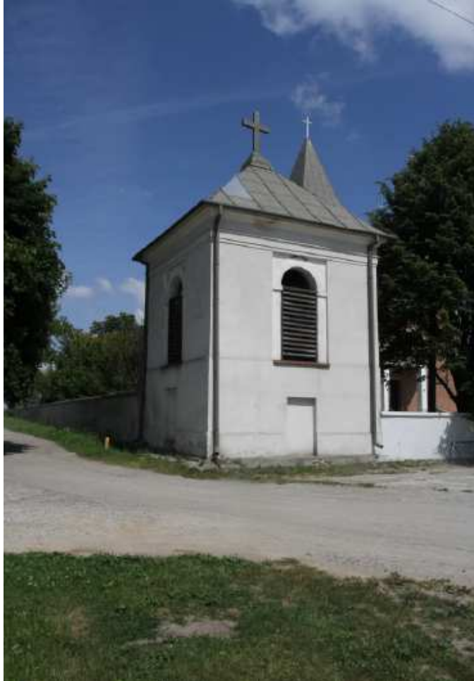
Dzwonnica w zespole kościoła pw. św. Barbary

Na terenie zespołu kościelnego w Puchaczach znajdują się dwa zabytkowe budynki: dzwonnica i plebania.