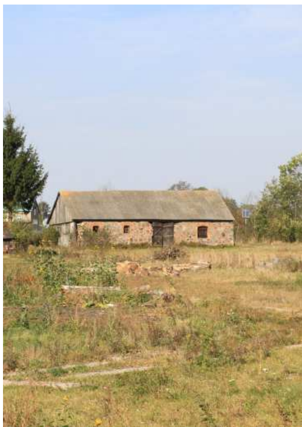
Kamienna obora w założeniu dworsko ogrodowym