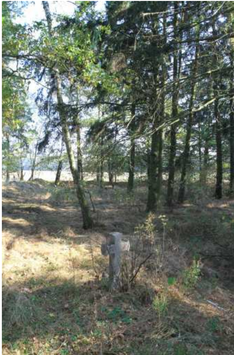
Cmentarz wojenny w Krzewicy

Cmentarz w Krzewicy został założony we wrześniu 1915 r. po bitwach stoczonych przez wojska austriackie z wojskami rosyjskimi od 14 do 16 sierpnia 1915 r. Położony przy drodze polnej, ok. 2,5 km na północny-wschód od wsi Krzewica. Założony na planie nieforemnego wielokąta, powstałym z połączenia prostokąta z trapezem. Teren cmentarza ze wszystkich stron otoczony jest wałem ziemnym i rowem, z wejściem od strony południowo-zachodniej, przylegającym do polnej drogi z Krzewicy do Łukowisk. Przed wejściem na teren cmentarza znajdują się pozostałości rowów strzeleckich z czasu walki oddziałów radzieckich z niemieckimi w 1944 r. Z wszystkich stron otoczony jest polami uprawnymi.