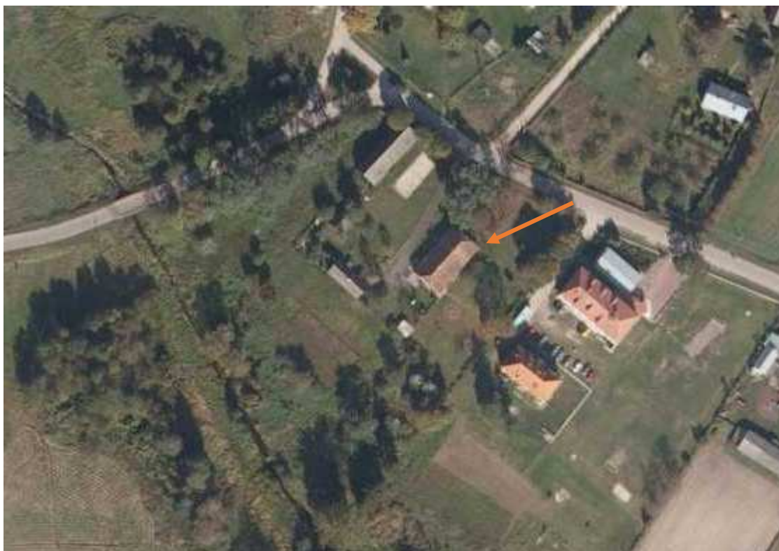
Leśniczówka w Puchaczach

Wybudowana w k. XIX w. jako budynek gospodarczy dawnego folwarku. Położona na skraju wsi, przy drodze przez wieś, w sąsiedztwie kościoła. Budynek murowany, z cegły, otynkowany, na rzucie wydłużonego prostokąta. Od strony wschodniej, na osi, drewniany ganek wsparty na ośmiu słupach, zwieńczony trójkątnym szczytem. Bryła zwarta, prostopadłościenna, przykryta dachem dwuspadowym, naczółkowym. Pokrycie dachowe dachówką ceramiczną.