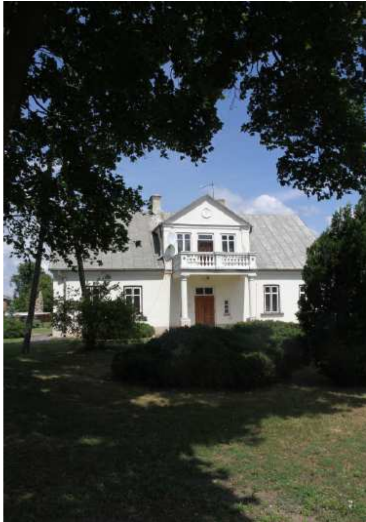
Plebania w zespole kościoła pw. św. Barbary

Plebania położona jest na pd. wsch. od kościoła. Wybudowana została w końcu XIX w. Murowana z cegły, obustronnie tynkowana, na planie prostokąta. Bryła parterowa, ryzalit dwukondygnacyjny. Dach dwuspadowy, kryty blachą. Elewacja frontowa siedmioosiowa, z trójosiową wystawką z balkonem wspartym na dwóch kolumnach, elewacje boczne dwuosiove.