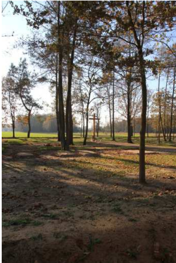
Cmentarz wojenny w Tuliłowie

Cmentarz w Tuliłowie został założony we wrześniu 1915 r. po bitwach stoczonych przez wojska austriackie z wojskami rosyjskimi od 14 do 16 sierpnia 1915 r. Położony ok. 700 m. od wsi Tuliłów, na skraju lasu. Założony na planie prostokąta, ze wszystkich stron otoczony wałem ziemnym, z wejściem od strony północno-wschodniej, z drogi biegnącej wzdłuż linii lasu. Z pozostałych 3 stron otoczony jest polami uprawnymi. Od wejścia do półkolistego placu w centrum cmentarza, na którym ustawiony jest współczesny krzyż, prowadzi prosta aleja. Cmentarz w części porośnięty jest drzewami.