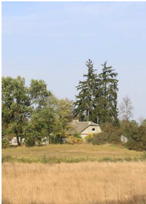
Dwór i fragment parku