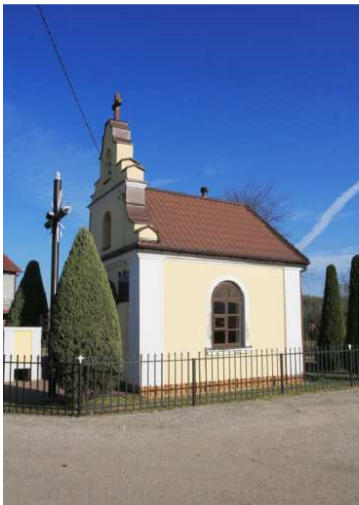
Kaplica w Wólce Krzymowskiej