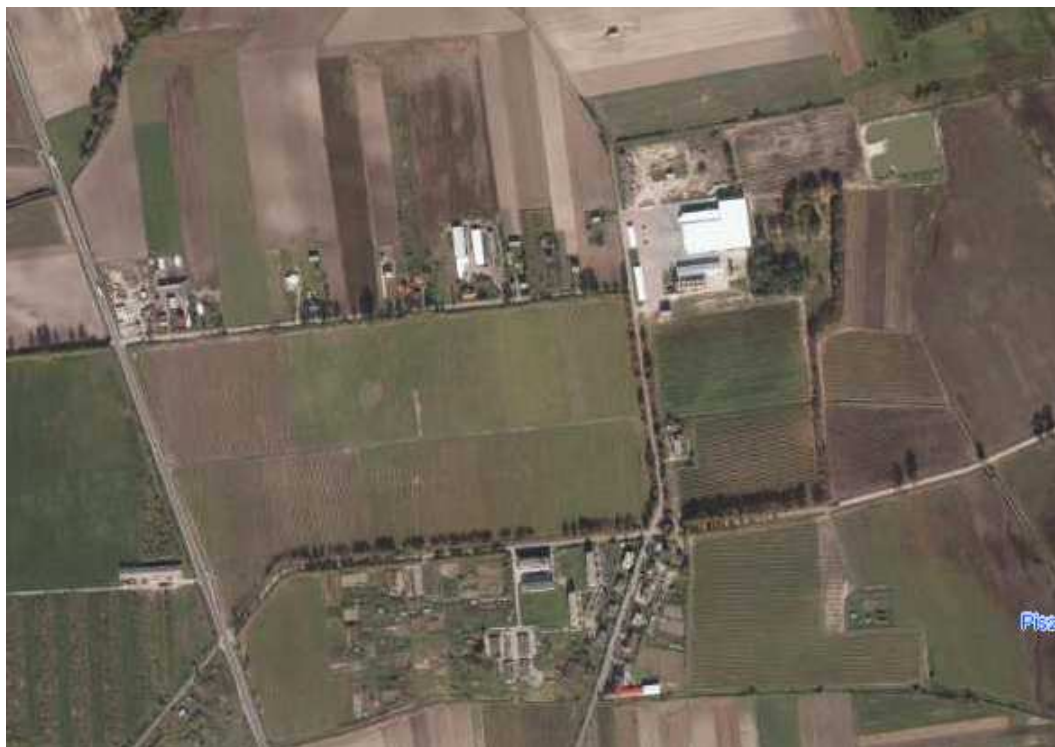
Zespół folwarczny w Halasach