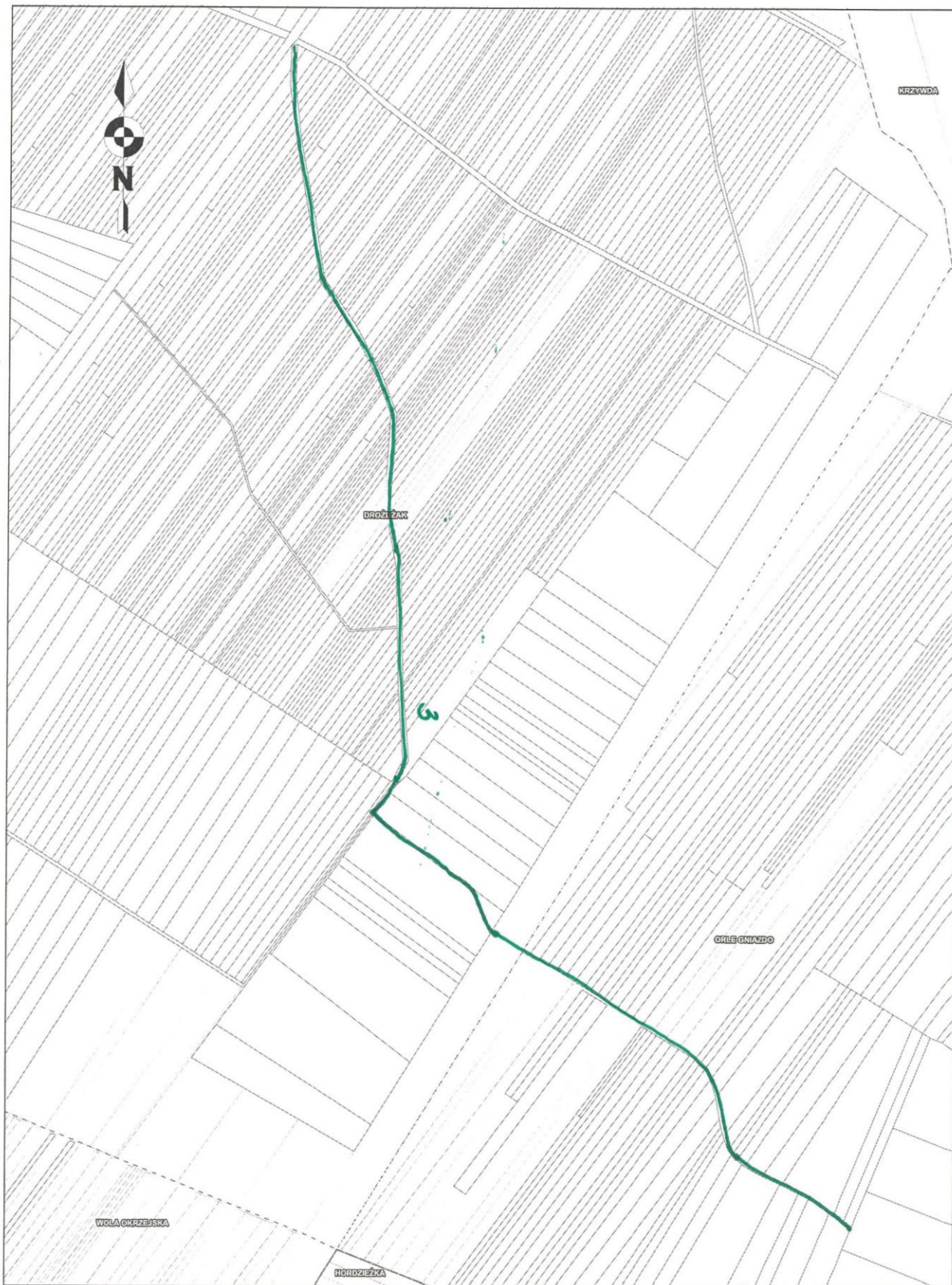
Nr ewid. dz. cz. 1349, 1351, 158 (obręb Drożdżak i Orle Gniazdo)