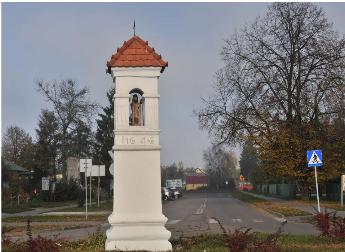
Fot. 3 Kapliczka Jezusa Frasobliwego z 1646 r. „Święty Jan” w Podedwórz