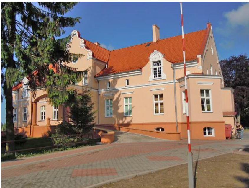
Dwór w Babiętach Wielkich.

Babięty Wielkie – zespół dworsko-parkowy (XVIII w., 1870, koniec XIX w.). Wieś kapituły pomezkańskiej lokowana w 1313 r. W XVIII w. własność szlachecka z folwarkiem i młynem. W XIX w. działał we wsi młyn, huta szkła i wiatrak. Założenie dworsko-parkowe składa się z dworu (XVIII w., przebudowa w stylu neomanierystycznym w końcu XIX w.), budynku gospodarczego (ryglowego z końca XVIII w.) oraz czworaka (koniec XVIII w.).