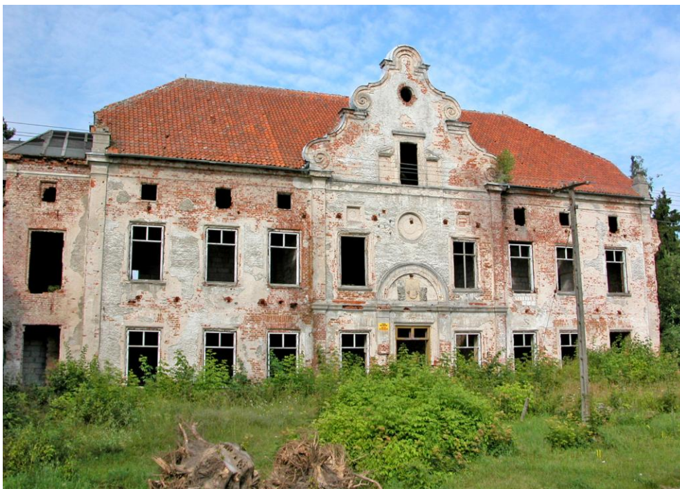
Pałac w Januszewie.

Kamieniec – zespół pałacowo-parkowy (1700-20) oraz układ przestrzenny wsi folwarcznej wraz z kościołem parafialnym (poewangelicki, pw. Matki Boskiej Królowej Świata z 1706). Wieś kapituły pomezkańskiej lokowana w 1321 r. W XVIII w. na nowo rozplanowana. Zespół pałacowo-parkowy obejmuje ruiny pałacu zbudowanego w stylu francuskiego baroku, bramę i ogrodzenie, pawilon ogrodowy z oranżerią oraz rozległy park przylegający od wschodu do łąk nad jeziorem Gaudy. Pałac pierwotnie nakryty był mansardowym dachem z zielonej glazurowej cegły, z frontową attyką ozdobioną rzeźbami. Przez park przepływa rzeka Liwa. Zabudowa wsi składa się m.in. z kuźni, spichlerza, 2 stajni, 3 czworaków, wozowni, biura, leśniczówki, plebanii oraz kaplicy (koniec XVIII w.).