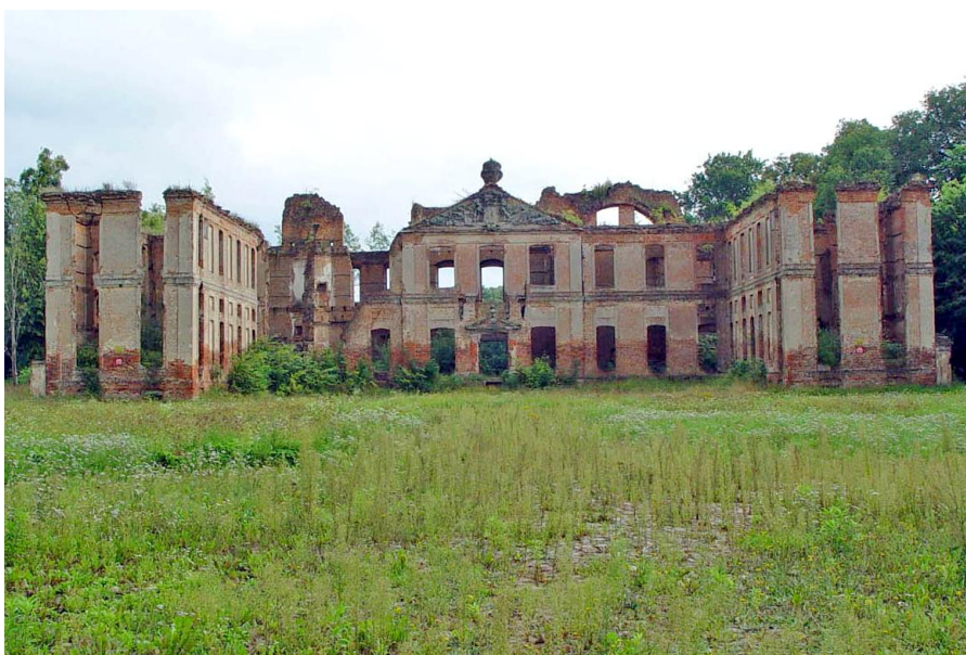
Pałac w Kamieńcu.

Kamieniec – zespół pałacowo-parkowy (1700-20) oraz układ przestrzenny wsi folwarcznej wraz z kościołem parafialnym (poewangelicki, pw. Matki Boskiej Królowej Świata z 1706). Wieś kapituły pomezkańskiej lokowana w 1321 r. W XVIII w. na nowo rozplanowana. Zespół pałacowo-parkowy obejmuje ruiny pałacu zbudowanego w stylu francuskiego baroku, bramę i ogrodzenie, pawilon ogrodowy z oranżerią oraz rozległy park przylegający od wschodu do łąk nad jeziorem Gaudy. Pałac pierwotnie nakryty był mansardowym dachem z zielonej glazurowej cegły, z frontową attyką ozdobioną rzeźbami. Przez park przepływa rzeka Liwa. Zabudowa wsi składa się m.in. z kuźni, spichlerza, 2 stajni, 3 czworaków, wozowni, biura, leśniczówki, plebanii oraz kaplicy (koniec XVIII w.).