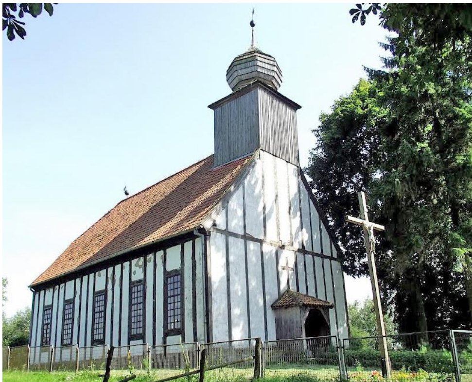
Kościół w Olbrachtowie.

Olbrachtowo – kościół (1732). Olbrachtowo zostało lokowane w 1312 r. Wieś folwarczna obejmująca budynki gospodarcze stojące wokół obszernego dziedzińca oraz czworaki po zachodniej stronie drogi. We wschodniej części wsi stoi kościół oraz wikařówka. Pierwotny kościół zbudowano w 1346 r. Wielokrotnie spalony, w 1732 r. wzniesiony nowy o konstrukcji szachulcowej.