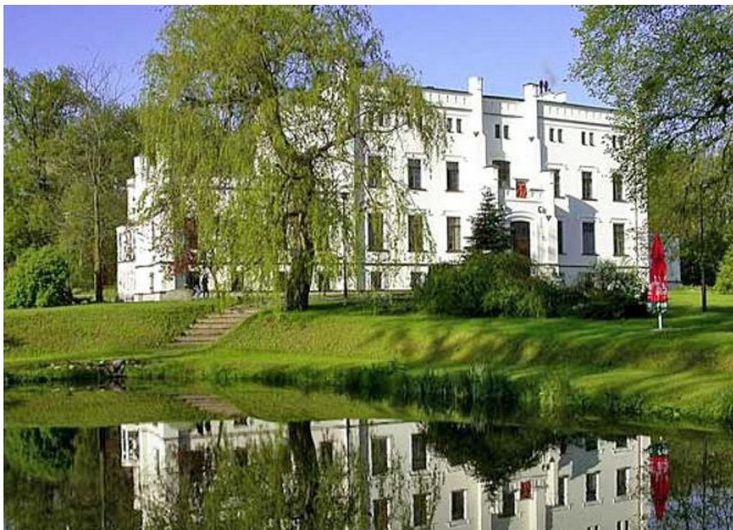
Pałac w Baloszczach.

Bronowo – zespół dworsko-parkowy (XVII, pocz. XVIII w.) z zabudowaniami folwarcznymi. Wieś kapituły pomeziańskiej lokowana w 1333 r. W XVIII w. należała do rodziny zu Dohna. Założenie dworsko-parkowe obejmuje dwór i oficynę (poł. XIX w.) położone w parku. Zabudowania folwarczne składają się z ośmiu budynków gospodarczych – m.in. ryglowej stodoły (poł. XIX w.), stodoły (koniec XIX w.), trzech obór (poł. XIX – początek XX w.), gorzelni (pocz. XX w.). Zabudowa mieszkalna folwarku obejmuje czworaki parterowe, nakryte dachem naczółkowym (XVIII/XIX w.), oraz półtorakondygnacyjne nakryte dachem dwuspadowym (koniec XIX w.).