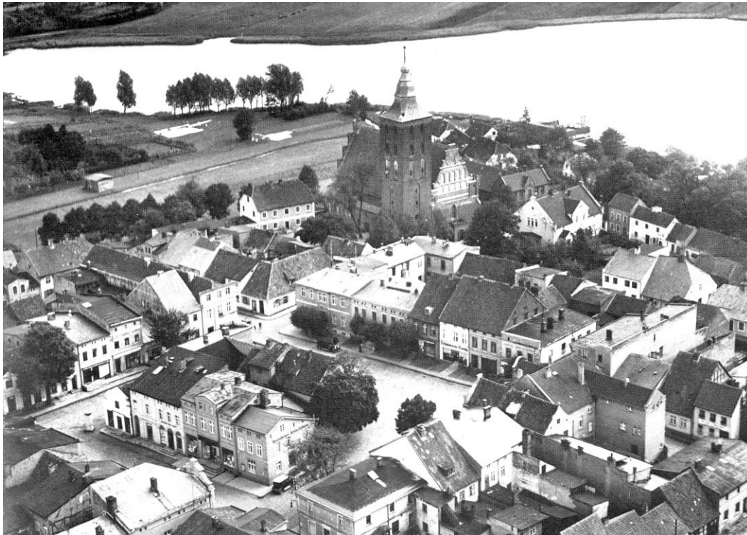
Stare Miasto w Suszu. Stan sprzed zniszczeń wojennych.