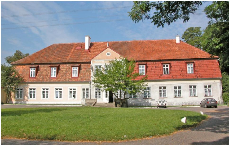
Dwór w Nipkowie.

Nipkowie (d. nazwa Lipiny) – zespół dworsko-parkowy (II poł. XVIII w.). Wieś lokowana w 1399 r. Dwór jest usytuowany pomiędzy parkiem a zespołem budynków folwarku obejmującym 3 murowane obory, oborę murowano-drewnianą, drewnianą stodołę, spichlerz, studnię oraz pięć czworaków.