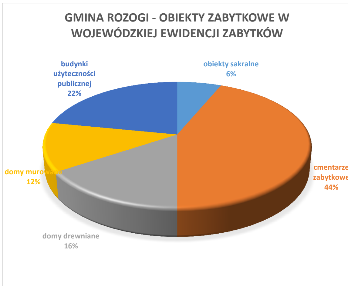
Wykres 2. Gmina Rozogi. Proporcje poszczególnych kategorii funkcjonalnych obiektów zabytkowych ujętych w gminnej ewidencji zabytków, z wyłączeniem obiektów objętych ochroną prawną poprzez wpis do rejestru zabytków województwa warmińsko-mazurskiego.