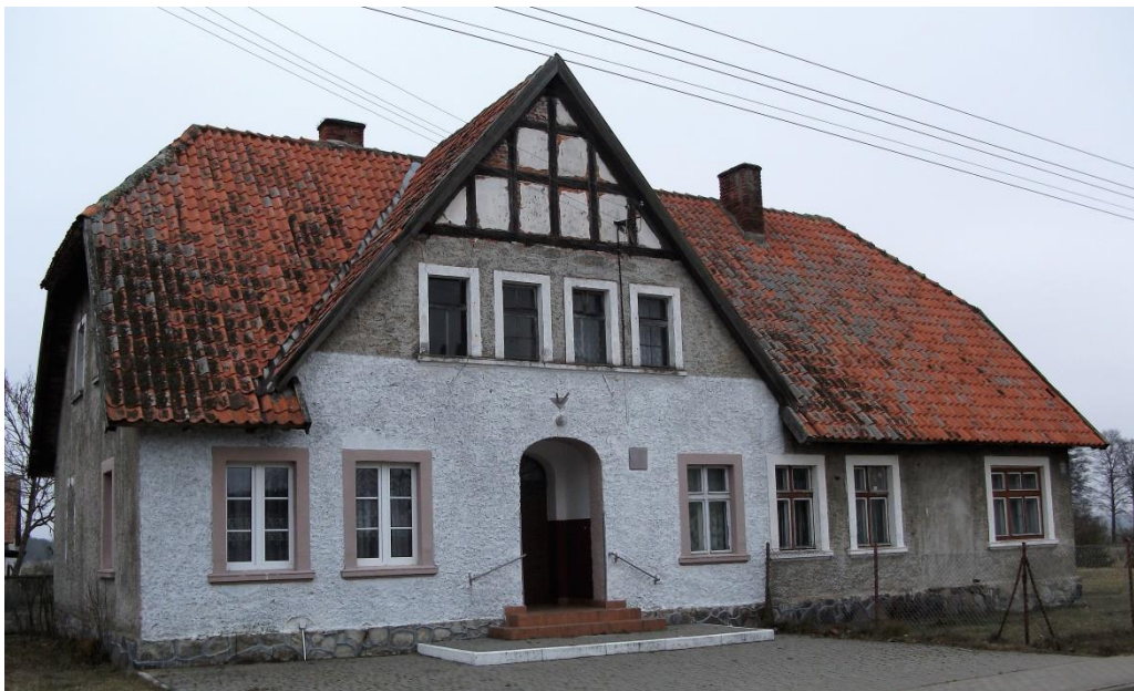
Budynek szkoły w Spalinach Wielkich