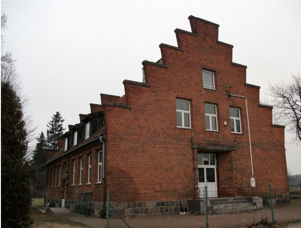
Budynek szkoły w Farynach