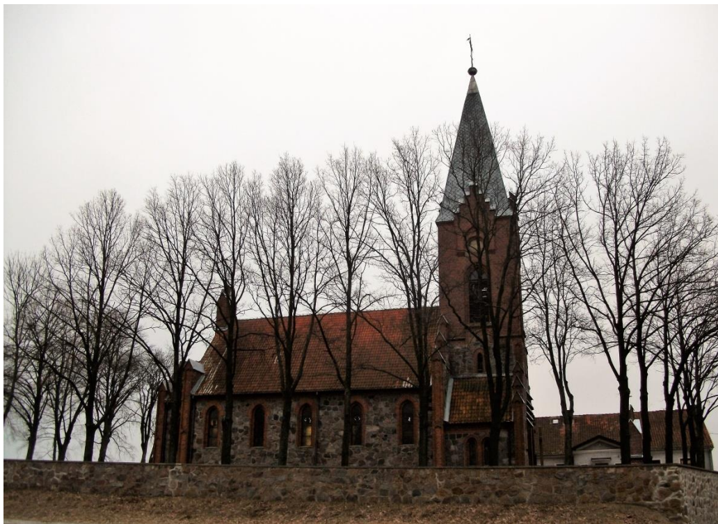
Kościół parafialny p.w. Znalezienia Krzyża Świętego w Klonie