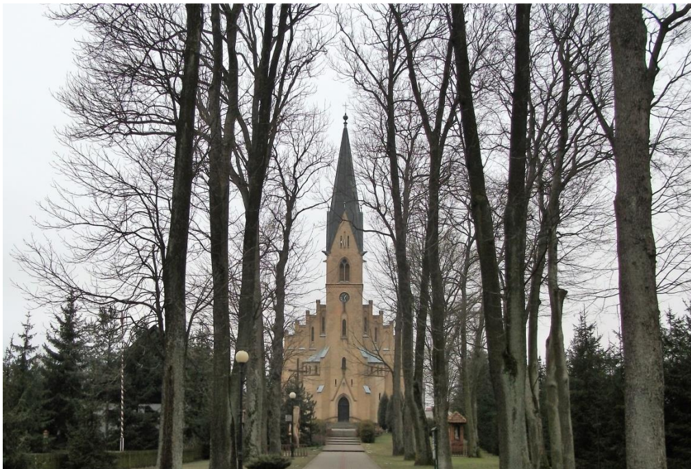
Kościół parafialny p.w. św. Marii Magdaleny w Rozogach

W krajobrazie wsi, występujących na terenie opracowania, dobrze czytelna jest architektura sakralna - kościoły w Rozogach, Klonie i Księżym Lasku. Kościoły, w odróżnieniu od innych grup architektury, charakteryzuje dobry stan zachowania.