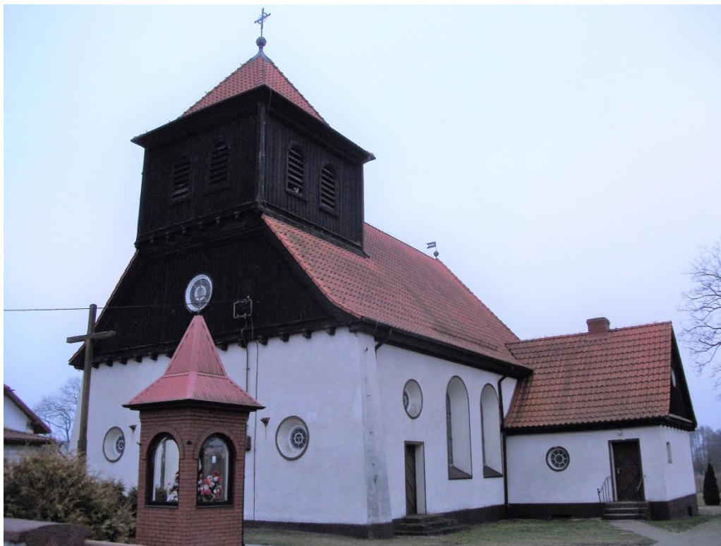
Kościół w Książym Lasku

Kolejnymi elementami istotnymi w pejzażu wsi mazurskiej były budynki użyteczności publicznej (szkoły wiejskie budowane już od końca XIX w. – w Rozogach, Farynach, Spalinach Wielkich i Wilamowie), zajazdy (Klon). Są to budynki w większości jednokondygnacyjne, czasem na podmurówce, z gankami, wyróżniające się detalami architektonicznymi na tle typowej zabudowy mieszkaniowej. Charakteryzuje je szczególna lokalizacja – w centralnej części wsi.