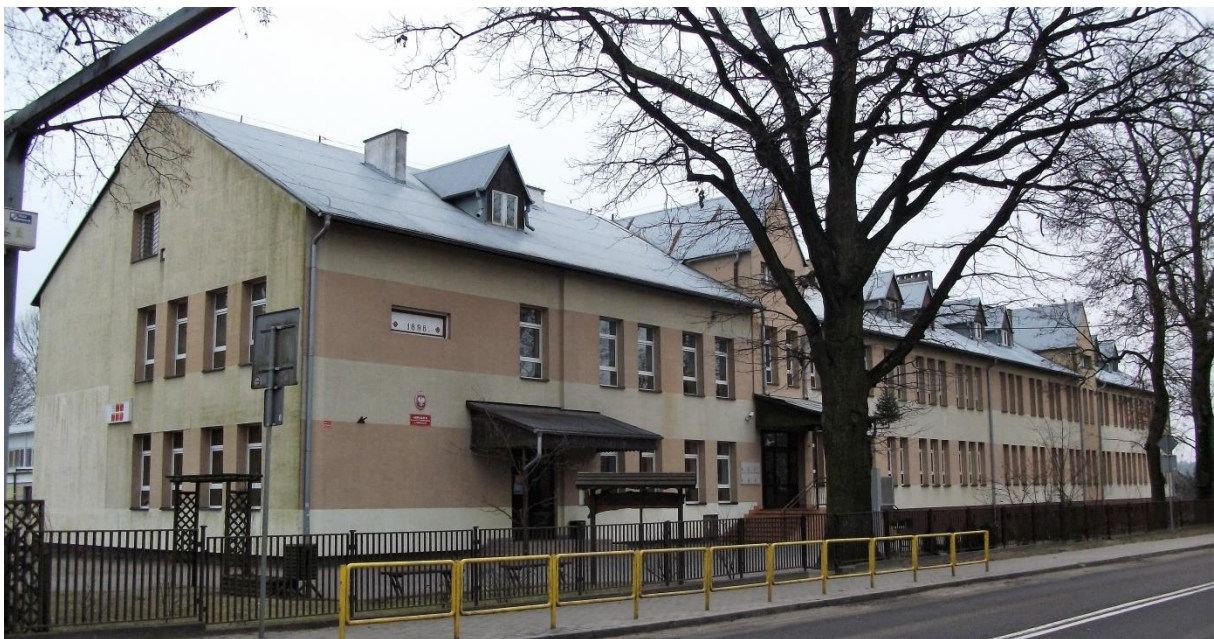
Budynek szkoły w Rozogach