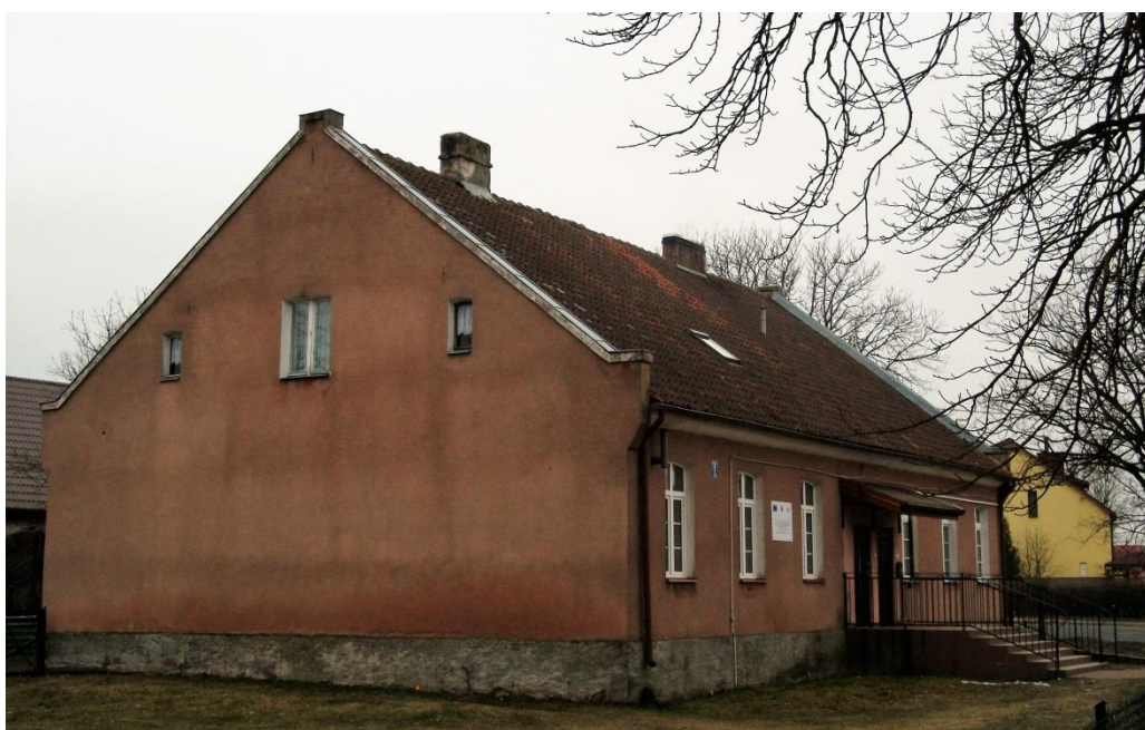
Budynek szkoły w Wilamowie

Integralną częścią zabudowy była zielen, zakładana przy kościołach, obiektach użyteczności publicznej, na cmentarzach. W każdej zagrodzie zakładany był również ogród, obok warzywnego również ozdobny. Elementem zagospodarowania zielenią są również aleje przydrożne , bardzo charakterystyczne i czytelne w krajobrazie. Wprowadzane nakazem państwowym, w pierwszej kolejności zakładane był wzdłuż głównych tras komunikacyjnych, potem wzdłuż dróg o znaczeniu lokalnym. Towarzystyły również drogom łączącym majątki z folwarkami. Zwykle aleje dochodziły