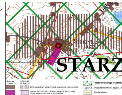
WYRYS ZE ZMIANY STUDIUM UWARUNKOWAŃ I KIERUNKÓW ZAGOSPODAROWANIA PRZESTRZENNEGO GMINY IŁAWA