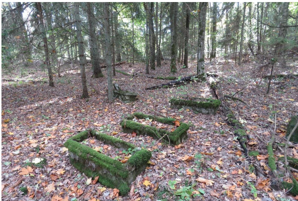
Cmentarz ewanagelicki we wsi Żelazki