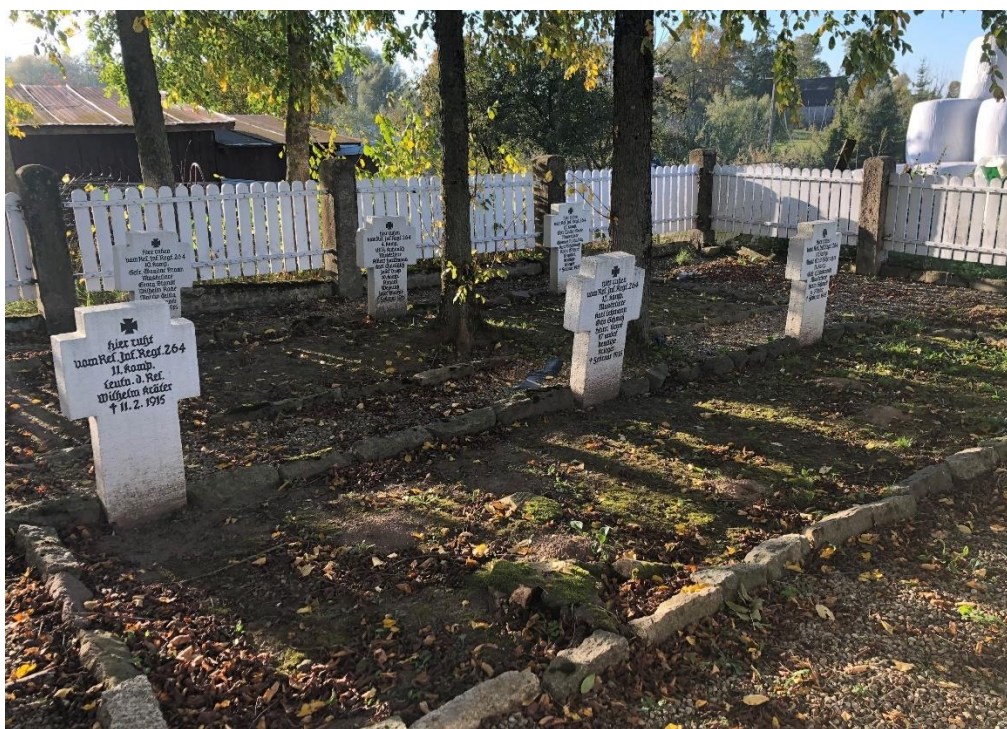
Cmentarz wojenny z czasów I wojny światowej w Krzywińskich