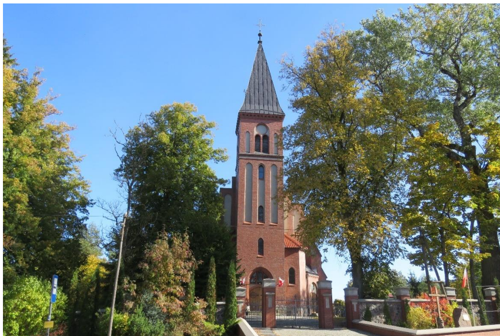
Kościół w Rożyńsku Wielkim