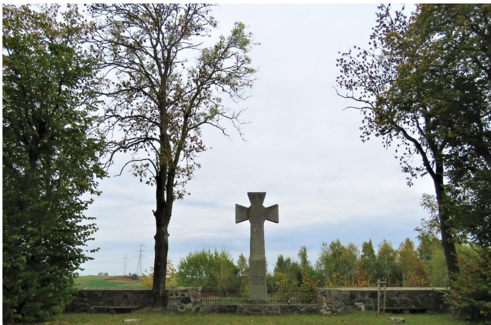
Cmentarz wojenny z czasów I wojny światowej w Bobrach

Na terenie gminy Prostki występują cmentarze wyznaniowe i wojenne. Są to cmentarze ewangelickie, w przewadze współcześnie nieczynne oraz cmentarze wojenne, najliczniejsze z czasów I wojny światowej oraz jenieckie z czasów II wojny światowej. Stan zachowania zabytkowych cmentarzy cywilnych na terenie gminy nie należy do najlepszych. Wynika to przede wszystkim z zapomnienia i aktów wandalizmu które miały miejsce w przeszłości, najintensywniej w okresie tuż po II wojnie światowej.