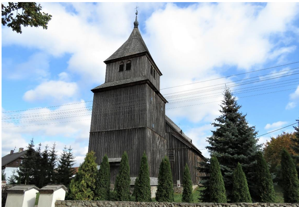
Kościół w Ostrykole

Architektura sakralna tworzy wyraźną i odrębną grupę zabytków. W krajobrazie wsi, występujących na terenie opracowania, dobrze czytelne są kościoły w Ostrykole i . Kościoły, w odróżnieniu od innych grup architektury, charakteryzuje dobry stan zachowania.