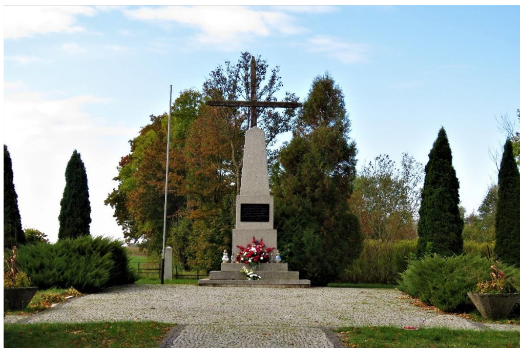
Cmentarz jeniecki z czasów II wojny światowej w Boguszech

Architektura miliarna sa to budowle i urządzenia przeznaczone do prowadzenia działań obronnych, wzniesione w różnych surowców i odpowiadające różnym potrzebom pola walki. Obiekty fortyfikacyjne dzieli się na fortyfikację polową – umocnienia terenu w procesie bezpośredniego przygotowania i prowadzenia walki (operacji), fortyfikację półstałą –