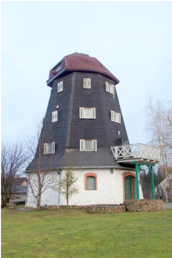
Zdjęcie nr 12. Wiatrak holenderski w Sterławkach Małych

Wiatrak w Sterławkach Małych to ostatni reprezentant licznych niegdyś na tym terenie budowli tego typu. Wzniesiony w 2 poł. XIX w., później przebudowany (fragmenty murowane). Zbudowany na planie sześcioboku. Obecnie jest bez skrzydeł, znajduje się w rękach prywatnych, pełni funkcję domu mieszkalnego.