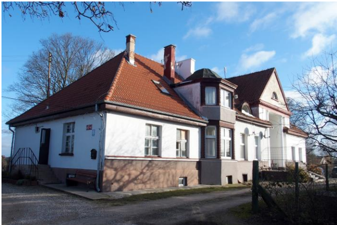
Zdjęcie nr 6. Upałty Małe nr 8, dwór, ob. budynek mieszkalny

Budynek wzniesiony w pocz. XX w., zapewne wg projektu architekta z Olecka, H. Thieme. Po wojnie budynek przekształcony w dom wielorodzinny. Podpiwniczony, parterowy budynek złożony z dwóch prostokątnych części, lekko zróżnicowanych w wysokości, nakryty dwoma trójspadowymi dachami. Fasada niesymetryczna: w części pld. – rozczłonkowana dwukondygnacyjnym ryzalitem z wgłębnym portykiem zwieńczonym trójkątnym szczytem wspartym na parze kolumn w porządku wielkim. W drugiej części – dwukondygnacyjny aneks zamknięty trójbocznie. Elewacje gładko tynkowane, bez detali. Zmieniony kształt okien.