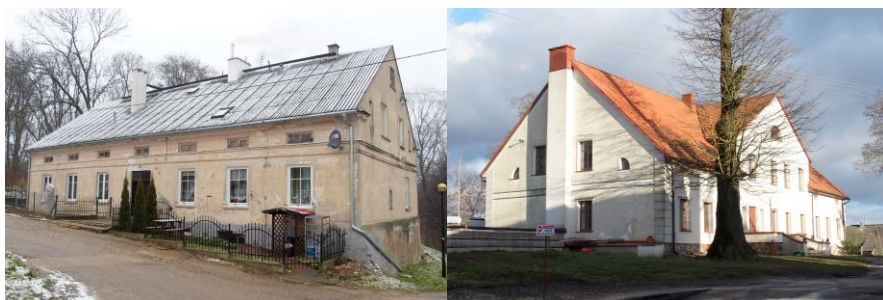
Zdjęcia nr 10, 11. Piękna Góra nr 2, Zielony Gaj nr 1