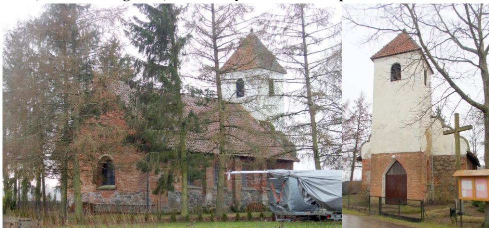
Zdjęcia nr 1, 2. Doba, kościół ewangelicki, obecnie rzymsko-katolicki pw. św. Jana Chrzciciela