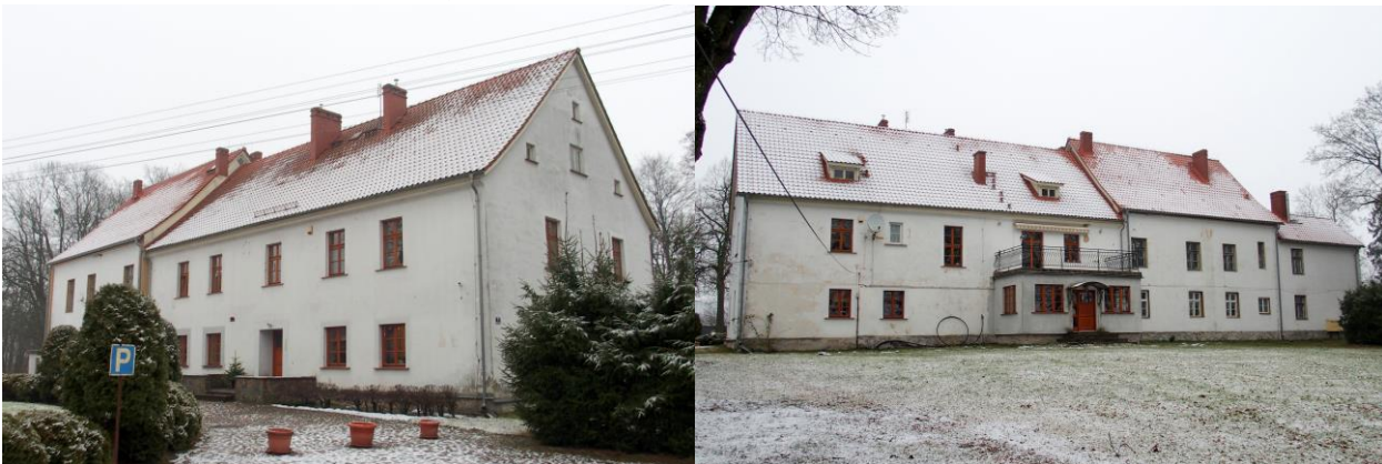
Zdjęcia nr 4, 5. Pierkunowo nr 1, dwór, ob. budynek mieszkalny

Budynek pochodzi z 1880 r., 1 ćw. XX w., brak cech stylowych. Złożony z dwóch, dwukondygnacyjnych, lekko zróżnicowanych członków na rzucie prostokąta, nakrytych dwuspadowymi dachami i niższego dwukondygnacyjnego aneksu. W fasadzie dobudowany współcześnie ganek. Budynek murowany, tynkowany, pozbawiony detali architektonicznych.