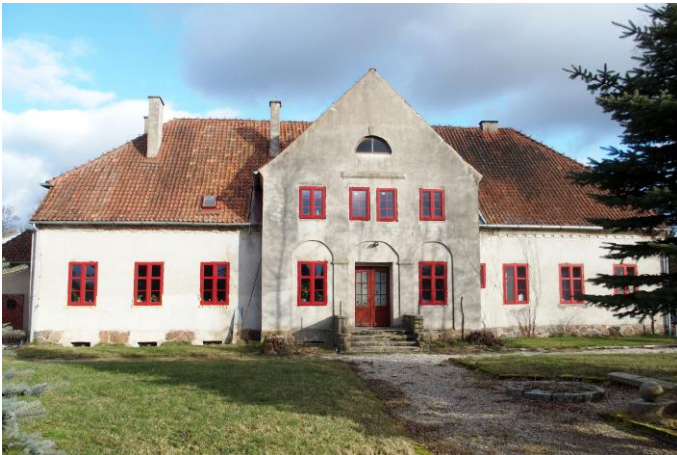
Zdjęcie nr 3. Nowe Soldany nr 13, dwór w zespole dworsko-folwarcznym, ob. budynek mieszkalny

Obiekt wzniesiony w 1 ćw. XX w., w szacie neoklasycyzmu. Budynek na rzucie prostokąta, w części podpiwniczony, parterowy, z dwukondygnacyjnym ryzalitem zwieńczonym trójkątną wystawką – na osi fasady, nakryty naczółkowym dachem i dwuspadowym dachem wystawki. Analogiczny ryzalit w elewacji tylnej, poprzedzony murowaną werandą. Ściany murowane, tynkowane, na cokole licowanym kamieniem polnym. Elewacje gładko tynkowane, w przyziemiu ryzalitu – trzy płytkie arkadowe blendy, w zwieńczeniu ścian – schodkowy gzyms. Wnętrze dwutraktowe.