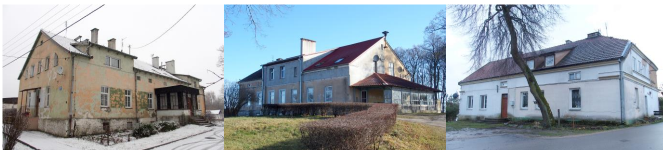
Zdjęcia nr 7, 8, 9. Bystry nr 7, Gorazdowo nr 5, Kalinowo nr 3

Pozostałe dwory są istotnym, historycznym dziedzictwem kulturowym. Prezentują walory typowe dla budownictwa mieszkalnego okresu 4 ćw. XIX w.-1ćw. XX w.