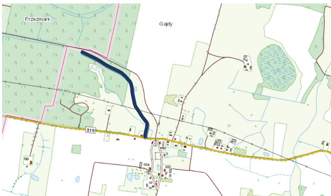
Nr 2. Od drogi wojewódzkiej nr 519 - Gajdy (las)