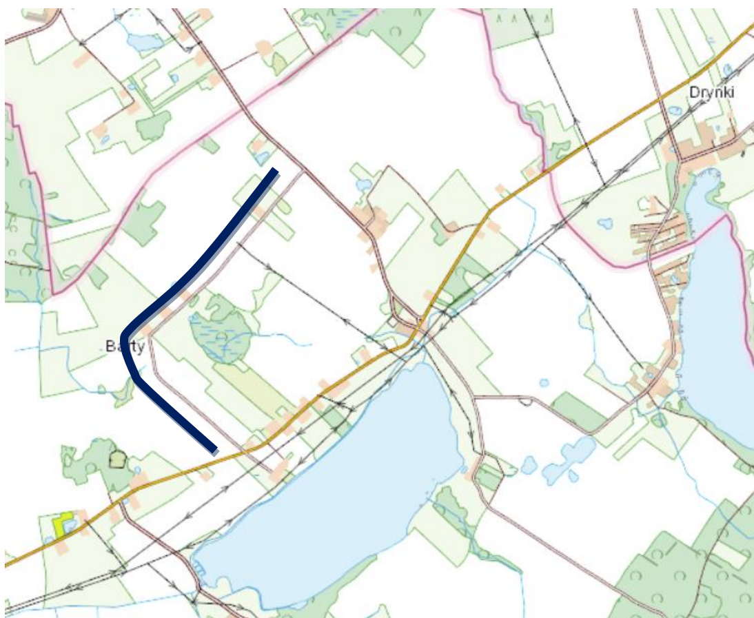
Nr 3. Od drogi wojewódzkiej nr 519 do drogi powiatowej 1209N - Barty (kolonia)