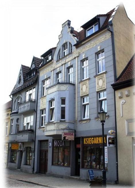
7. Połczyn-Zdrój - ul. 15-go Marca 18

Pozostałe obiekty wskazane do wpisu do rejestru zabytków w mieście Połczyn-Zdrój znajdują się w Gminnej Ewidencji Zabytków Połczyna-Zdroju lub są wystarczająco chronione zapisami miejscowego planu zagospodarowania przestrzennego.