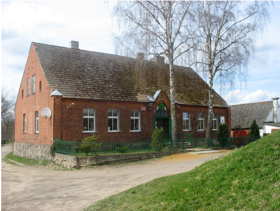
19. Popielewo -d. pastorówka, ob. punkt biblioteczny

W pobliżu kościołów lokalizowano pastorówki – większość z nich pełni aktualnie inne funkcje – najczęściej mieszkalne. Dawna pastorówka w Popielewie została przystosowana do funkcji biblioteki i jest obiektem zasługującym na wpis do rejestru zabytków woj. zachodniopomorskiego. Dawna pastorówka w Tychówku jest obiektem o funkcji mieszkalnej, podobnie jak pastorówka w Buślarach, gdzie zachowały się ceramiczne piece z pocz. XX w.