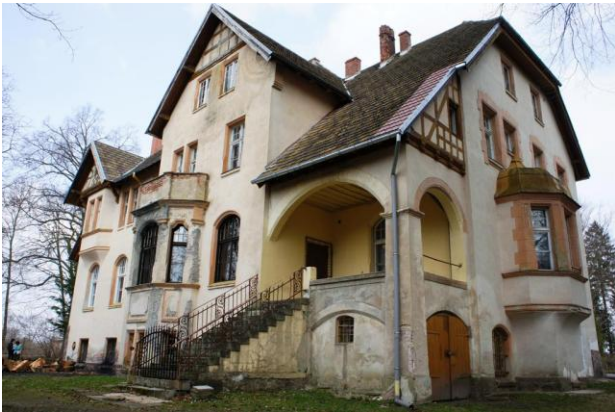
12. Bolkowo – dwór – ob. szkoła