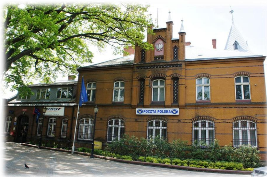
5. Połczyn-Zdrój - ul. Grunwaldzka 27 (poczta)