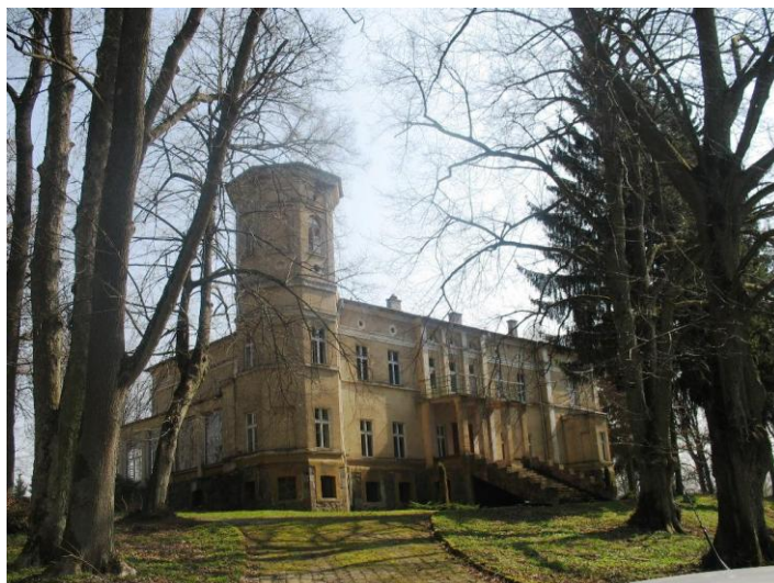
9. Słowianki – pałac