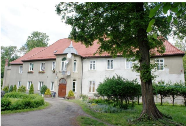
14. Kołacz – dwór (ob., budynek mieszkalny)