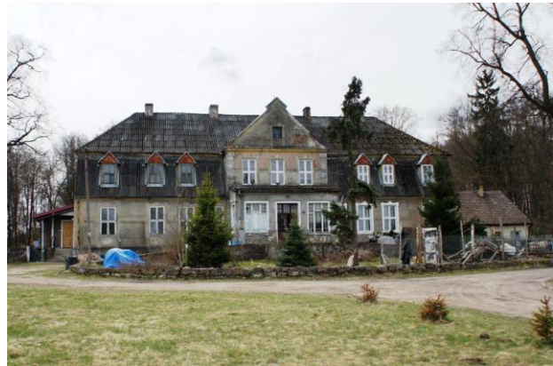
13. Brusno – dwór (ob. budynek mieszkalny)