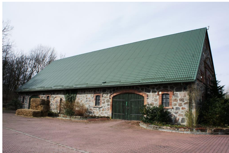
28. Kocury – owczarnia w założeniu folwarcznym