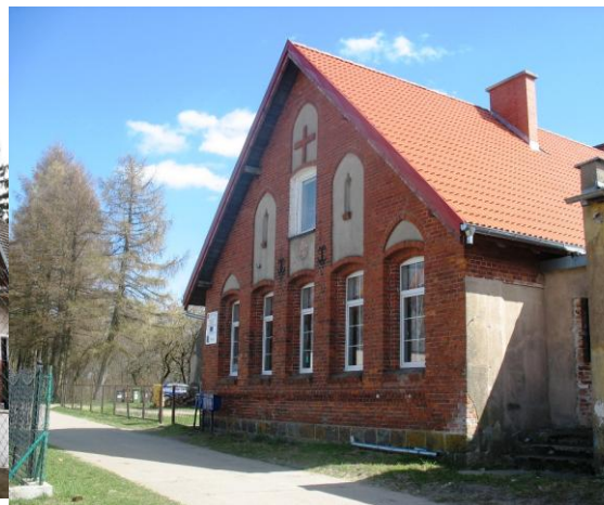
22. Szeligowo – d. szkoła ob. budynek mieszkalny