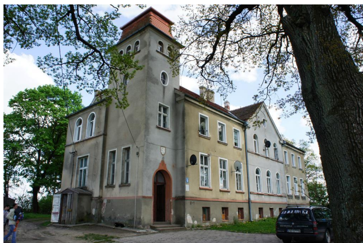
10. Nowe Ludzicko - pałac – ob. budynek mieszkalny