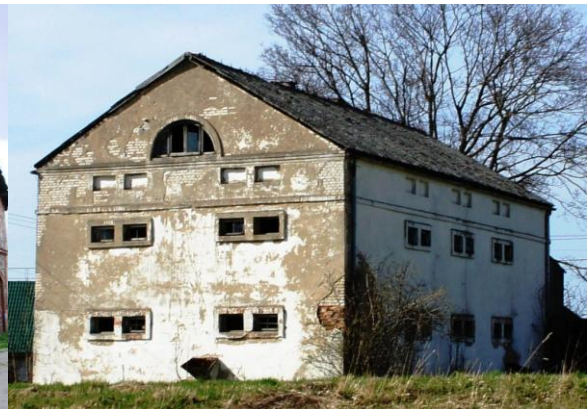
27. Borkowo – spichlerz