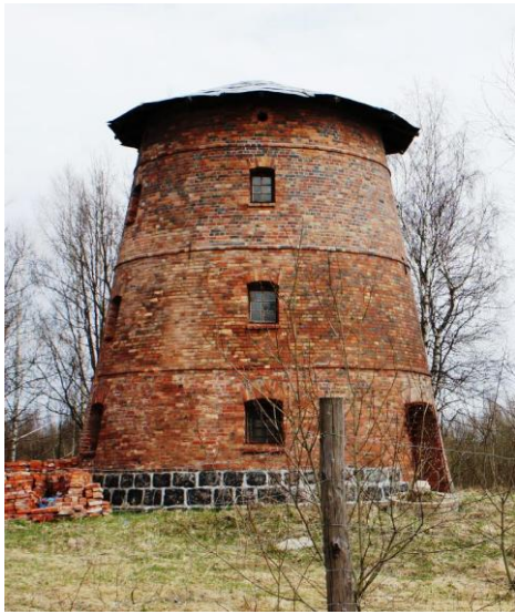
24. Kapice – wiatrak „holender” – nieużytkowany

Ad. 4 – zabytki techniki – wpis do rejestru zabytków dla jednego wiatraka – „holendra” znajdującego się na terenie gminy (zachowany tylko korpus w Kapicach), młynów w Popielawach i Redle i spichlerza w Borkowie.