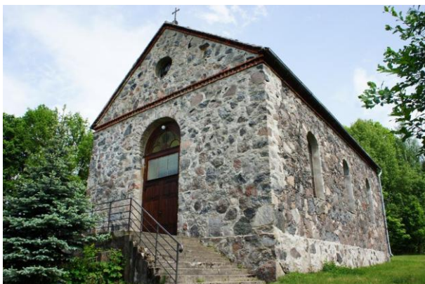
16. Czarnkowie - kościół p.w. św Stanisława Kostki

AD.2 - Zabytki sakralne – jedynie dwa kościoły z terenu gminy Połczyn-Zdrój o stosunkowo prostej formie nie zostały wpisane do rejestru zabytków ( kościoły w miejscowości Czarnkowie i Redło). Na wpis do rejestru zabytków zasługuje wyjątkowa neogotycka kaplica na terenie parku dworskiego w miejscowości Łęgi. Proponowana do wpisu do rejestru kaplica cmentarna w Redle jest wystarczająco chroniona wpisem do Wojewódzkiej Ewidencji Zabytków woj. zachodniopomorskiego cmentarza komunalnego w Redle.