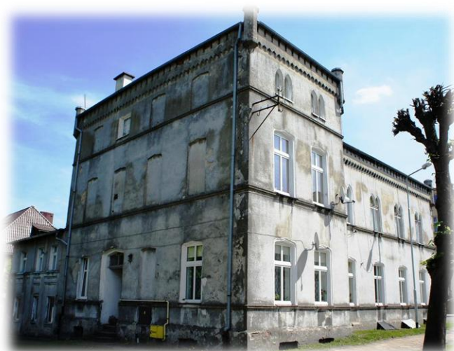
6. Połczyn-Zdrój - ul. Grunwaldzka 40 (budynek mieszkalny)