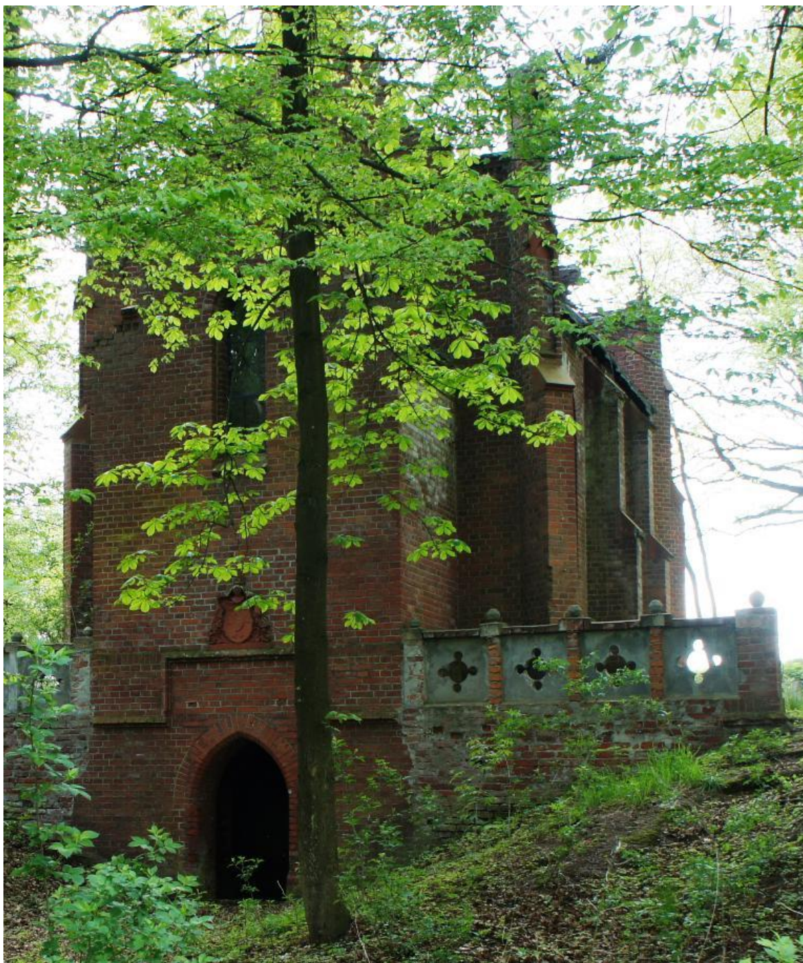
18. Łęgi – kaplica rodowa