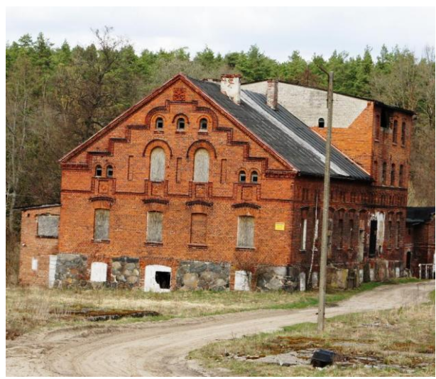
25. Popielawy – młyn, elektrownia wodna - nieużytkowany