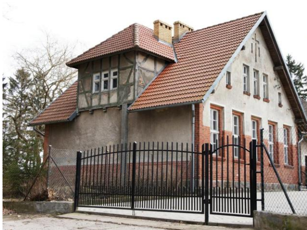
21. Brusno – szkoła wiejska

Ad.3. Bardzo istotnym elementem pejzażu wiejskiego w okresie 20-lecia międzywojennego były szkoły, poczty i budynki stacyjne. Do wpisu do rejestru zabytków proponuje się szkołę w Bruśnie i Szeligowie i budynki stacyjne w Gawroncu. Zespoły stacyjne w Redle i Kołaczcu zostały zniekształcone funkcją mieszkalną – tory kolejowe rozebrane a nasypy wykorzystane pod ścieżki rowerowe.