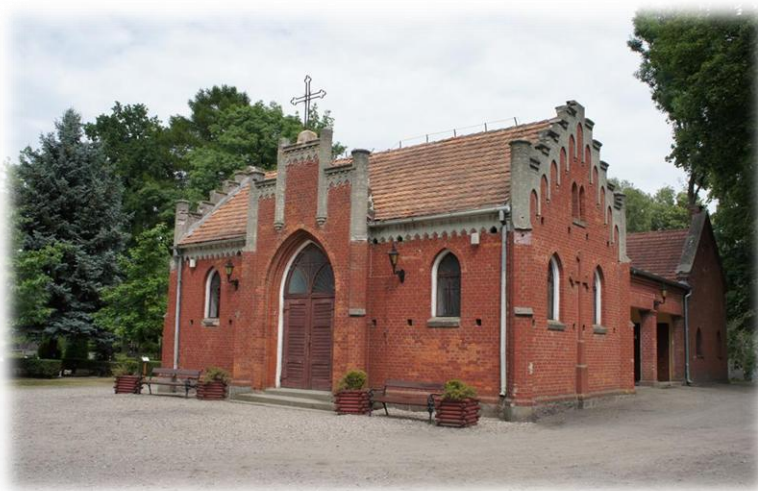
1. Połczyn-Zdrój - kaplica na cmentarzu

W mieście Połczyn-Zdrój na wpis do rejestru zasługują secesyjne kamienice przy ul. 15-go Marca 18, Staszica 3, Solankowej 9 (willa Radość I). Wpisem do rejestru powinny zostać objęte elewacje i niektóre wnętrza sanatoriów Podhale, Gryf, Marta, Irena, Leo (przy ul. Parkowej 1), Borkowo wraz z parkiem i aleją oraz unikalny pensjonat Skaut przy ul. Sobieskiego. Neogotyckie budynki Szpitala przy ul. Gwardii Ludowej 5, Szkoły wraz z salą gimnastyczną przy ul. Grunwaldzkiej 34, Poczty przy ul. Grunwaldzkiej 27, dawny Szpital Św. Jerzego przy ul. Piwnej 6 (obecnie szkoła), budynek Nadleśnictwa przy ul. 15-go Grudnia 12-14 (ob. budynek mieszkalny), kaplica cmentarna na cmentarzu komunalnym oraz budynek mieszkalny przy ul. Grunwaldzkiej 40 nadal zachowały swoje cechy stylowe i ze względu na wyjątkowe znaczenie dla krajobrazu kulturowego miasta należy je objąć ścisłą ochroną.