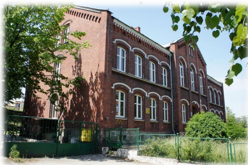
4. Połczyn-Zdrój - ul. Piwna 6 (d.szpital św Jerzego – ob. szkoła )