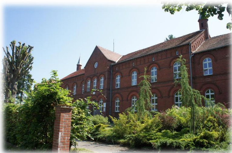
2. Połczyn-Zdrój - ul. Gwardii Ludowej 5 (szpital)