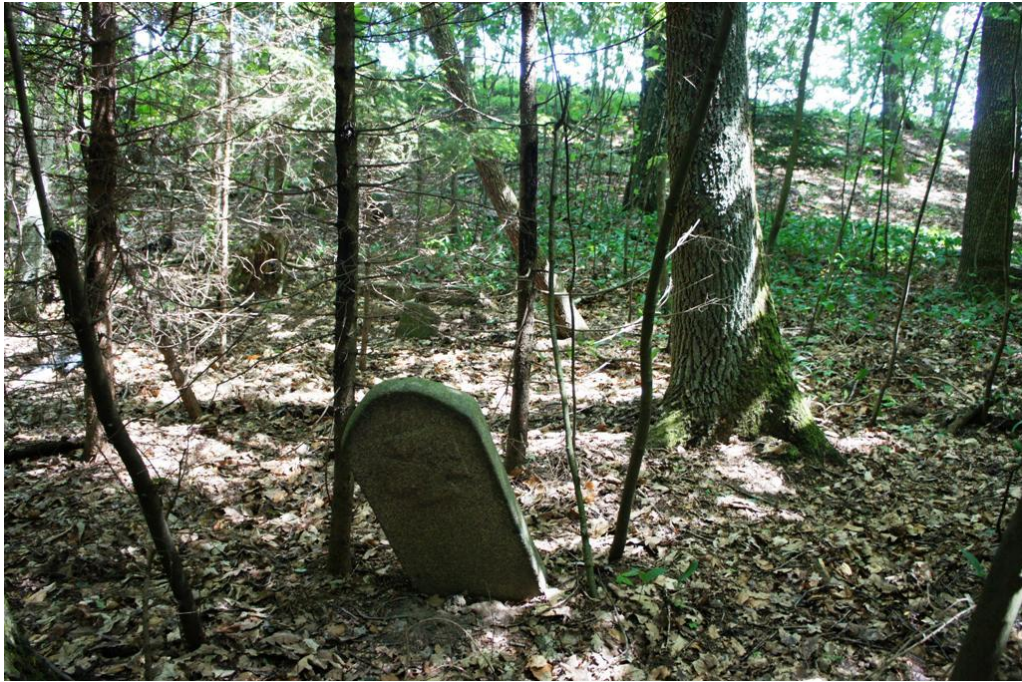
29. Buślary - cmentarz wojenny

Ad. 5 – cmentarze – do wpisu do rejestru zabytków proponuje się cmentarz wojenny w Buślarach oraz cmentarz w Toporzyku.