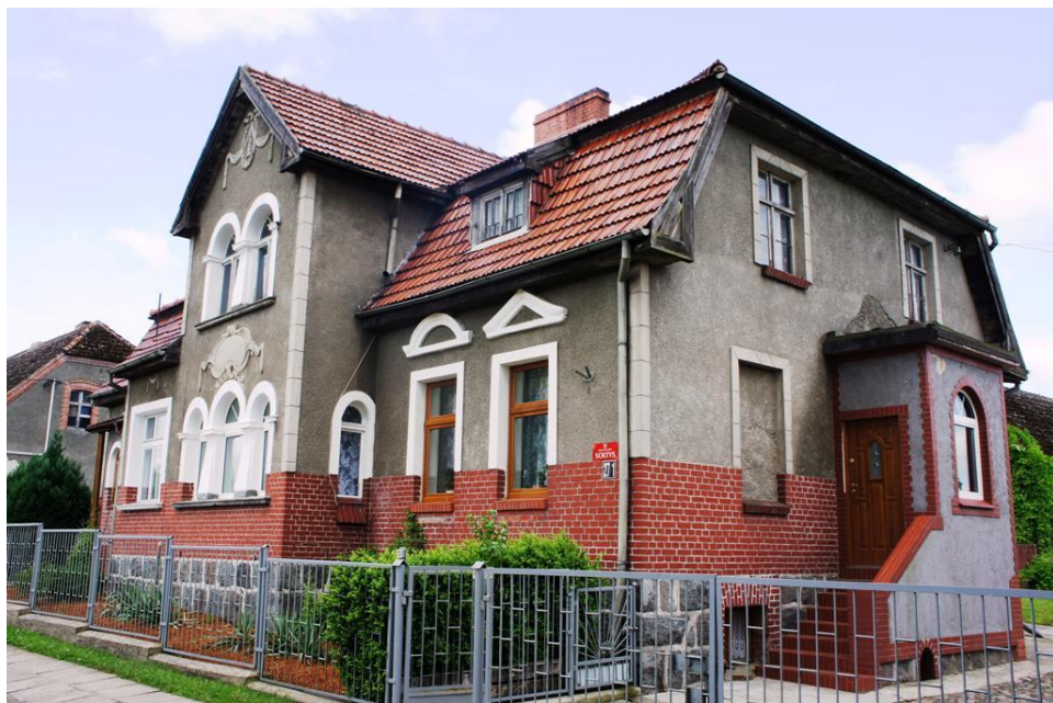
20. Buślary - pastorówka, ob. dom mieszkaln