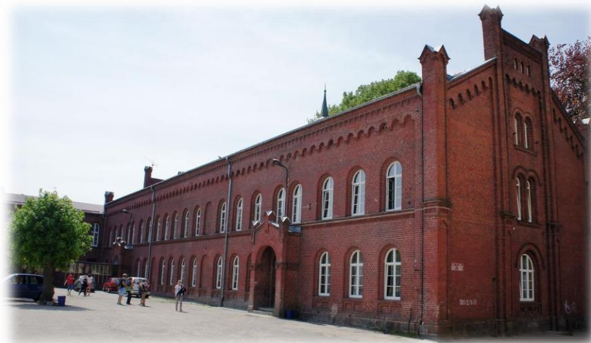
3. Połczyn-Zdrój - ul. Grunwaldzka 34 (szkoła)