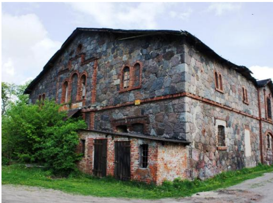
26. Redło - młyn