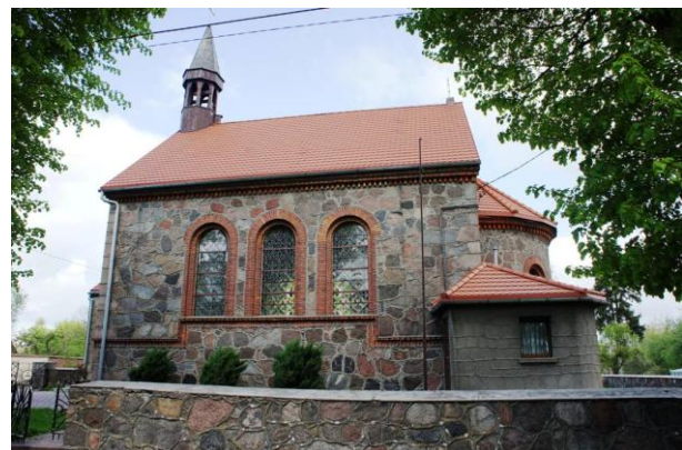
17. Redło – kościół parafialny pw. św Jana Chrzciciela