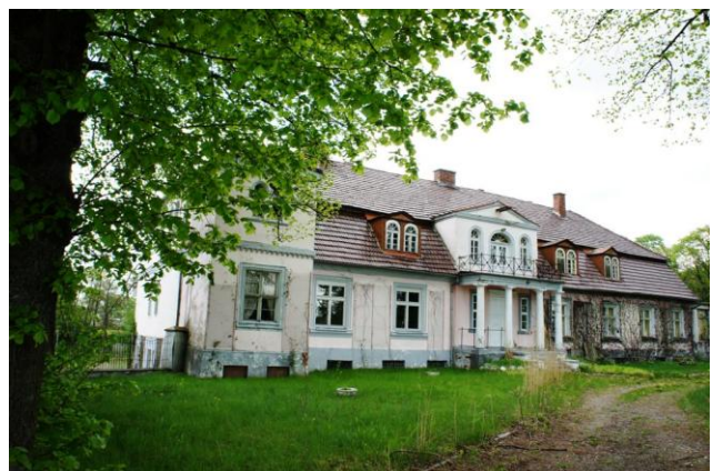
15. Łęgi - dwór

AD.2 - Zabytki sakralne – jedynie dwa kościoły z terenu gminy Połczyn-Zdrój o stosunkowo prostej formie nie zostały wpisane do rejestru zabytków ( kościoły w miejscowości Czarnkowie i Redło). Na wpis do rejestru zabytków zasługuje wyjątkowa neogotycka kaplica na terenie parku dworskiego w miejscowości Łęgi. Proponowana do wpisu do rejestru kaplica cmentarna w Redle jest wystarczająco chroniona wpisem do Wojewódzkiej Ewidencji Zabytków woj. zachodniopomorskiego cmentarza komunalnego w Redle.