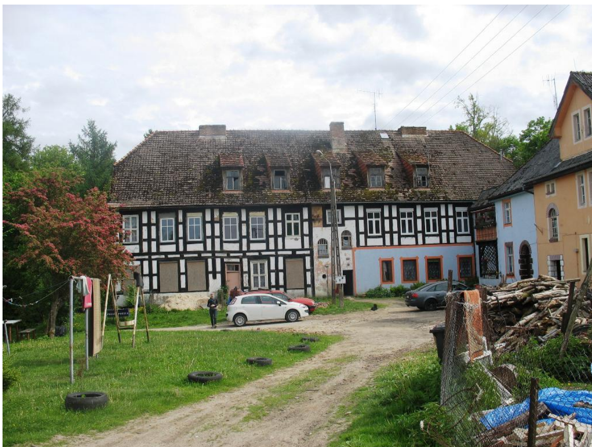
8. Międzyborze – d. zajazd – sanatorium

Ad.1. Spośród 13 dworów i pałaców, znajdujących się w większości na terenie parków wpisanych do rejestru zabytków, osiem z nich zasługuje na indywidualny wpis. Są to dwory w Bolkowie (ob., szkoła), Bruśnie (budynek mieszkalny), Kołaczu (ob. budynek mieszkalny), Łęgach, pałace w Słowiankach, Tychówku i Nowym Ludzicku (budynek mieszkalny) oraz unikalny zajazd – sanatorium w Międzyborzu (zarówno budynek główny jak i oficyna pełnią funkcje mieszkalne). Pozostałe obiekty są wystarczająco chronione poprzez wpis do Gminnej Ewidencji Zabytków lub zapisy planów zagospodarowania przestrzennego.