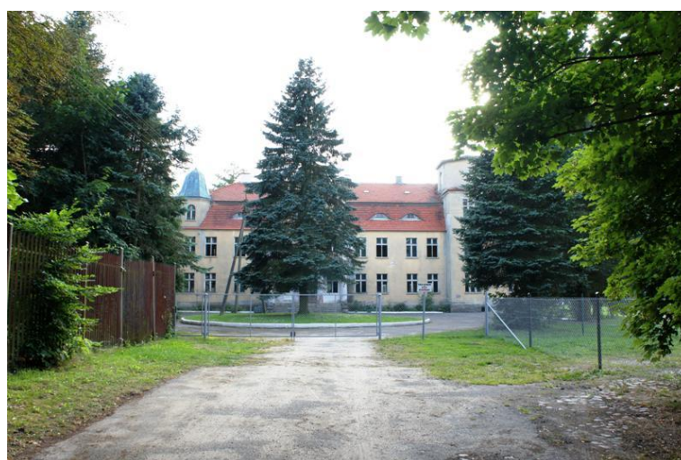
11. Tychówko - pałac (nieużytkowany)