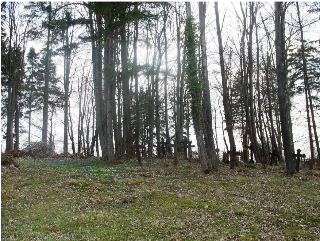
30. Toporzyk - cmentarz komunalny – nieużytkowana część d. cmentarza ewangelickiego