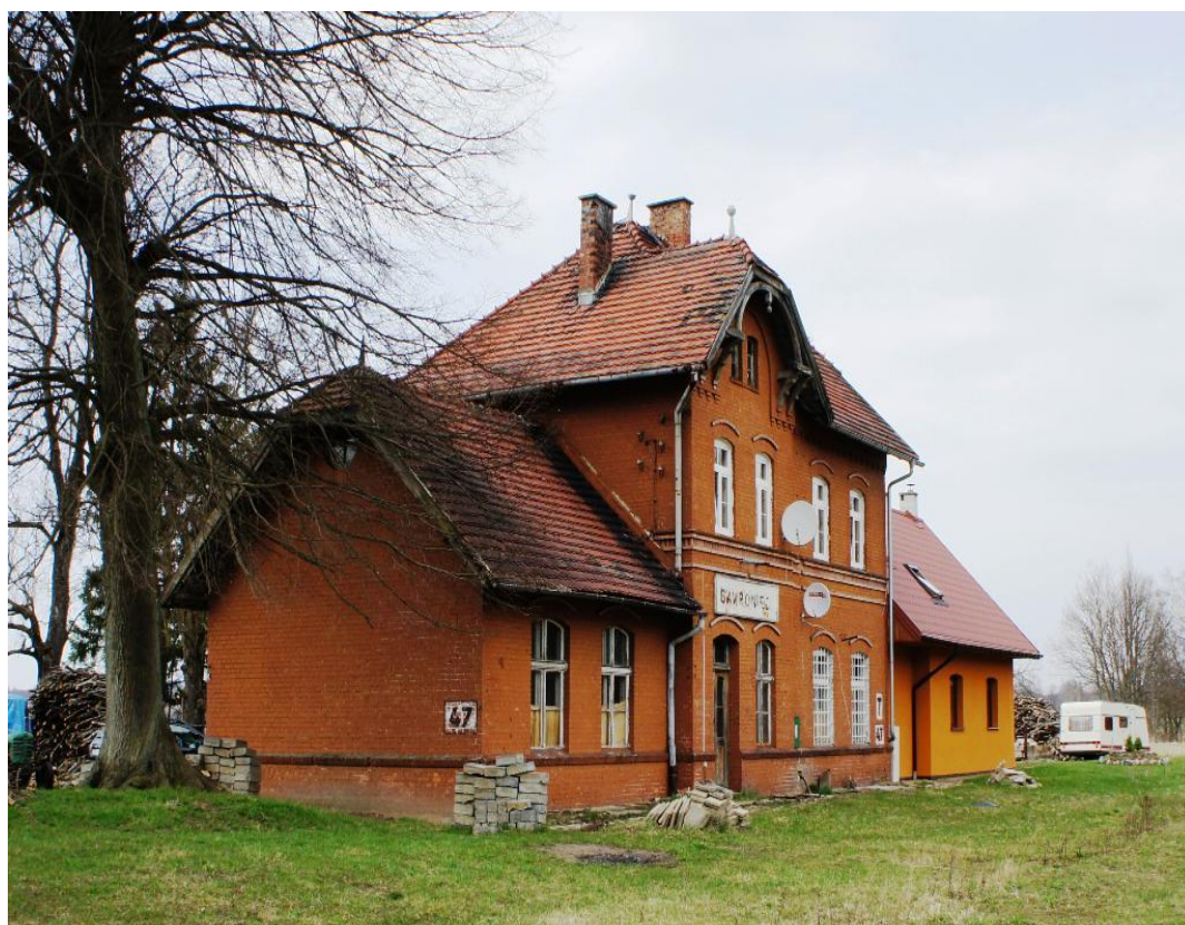
23. Gawroniec – d. dworzec kolejowy, ob. budynek mieszkalny