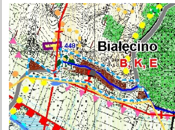
STUDIUM UWARUNKOWAŃ I KIERUNKÓW ZAGOSPODAROWANIA PRZESTRZENNEGO GMINY MALECHOWO /wrys/