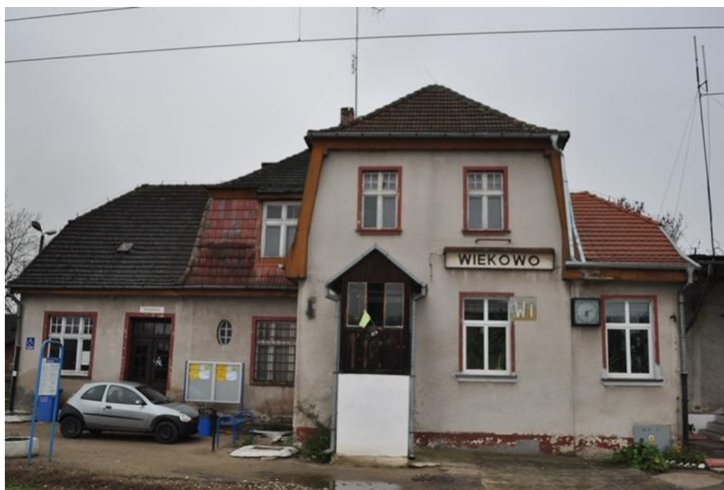
Wiekowo – stacja kolejowa