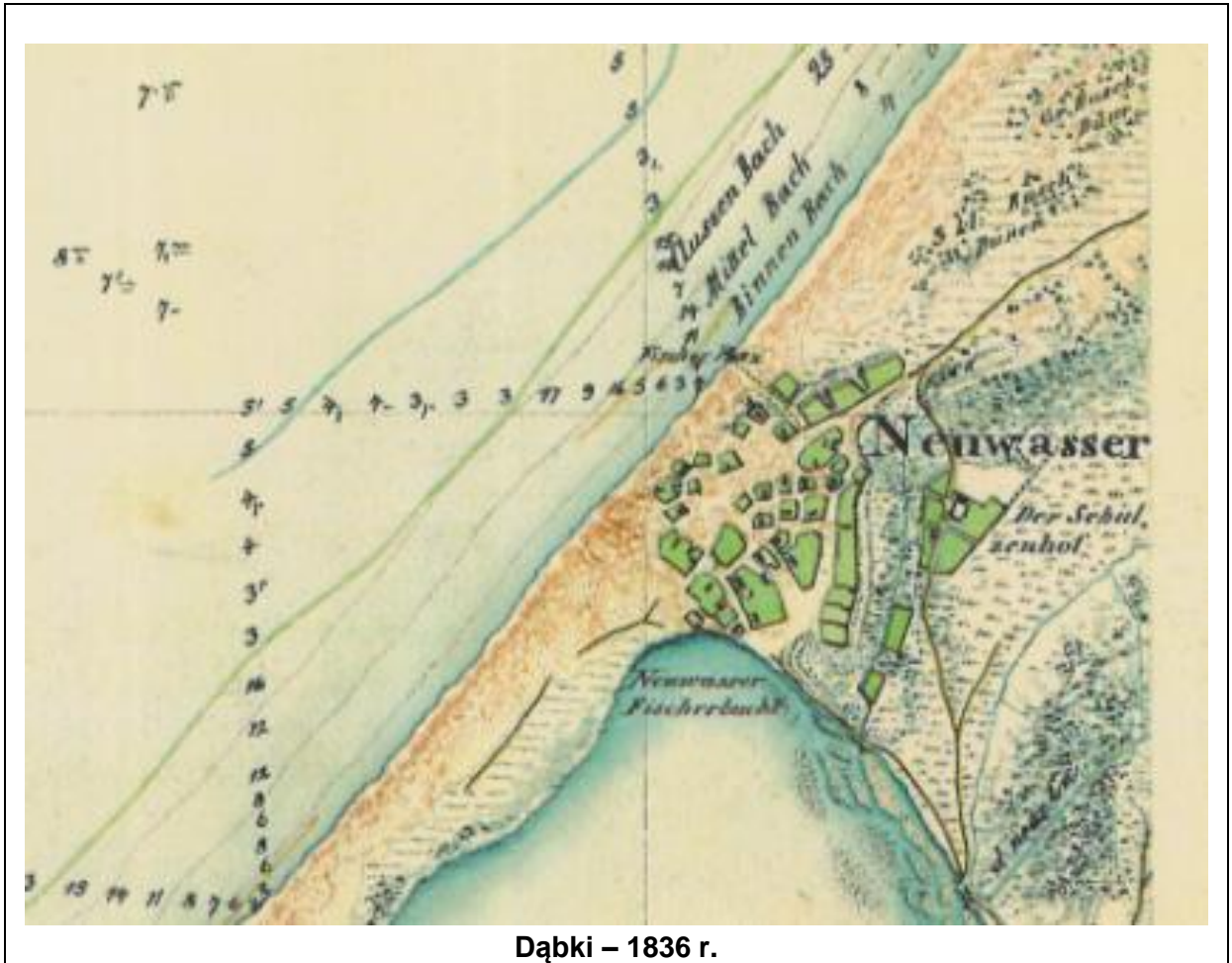
Dąbki – 1836 r.