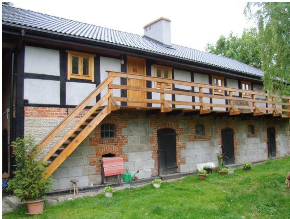
Słowino 76 – budynek bramny