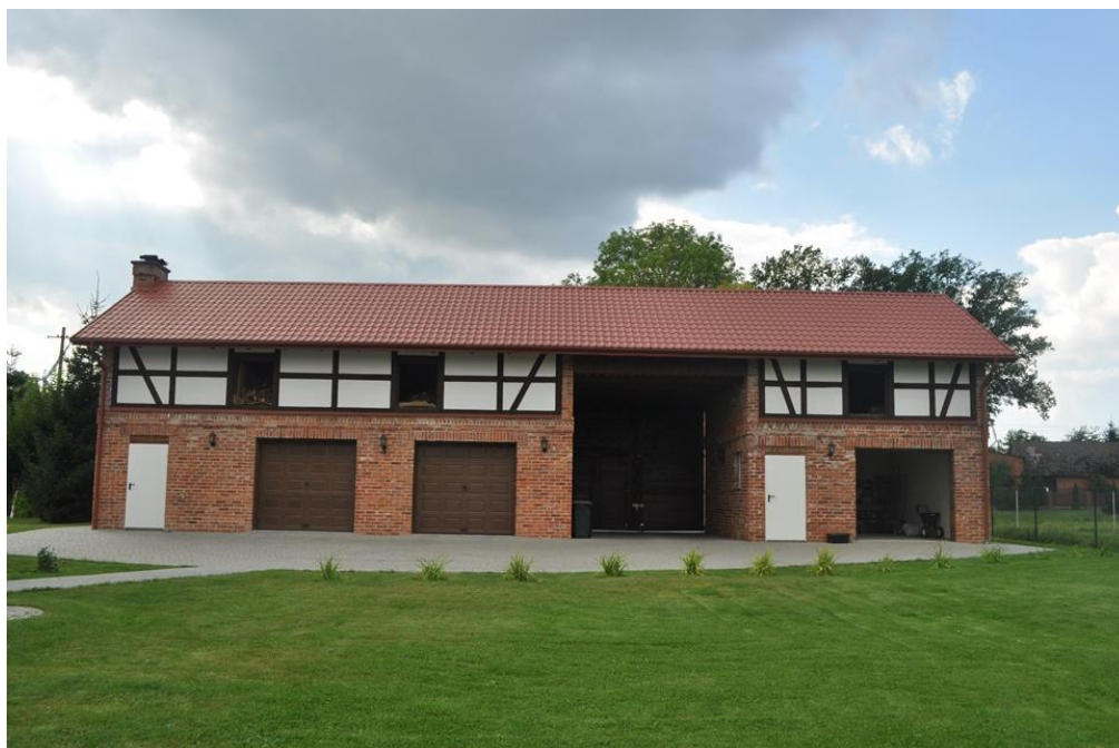
Wiekowice 62 – budynek bramny