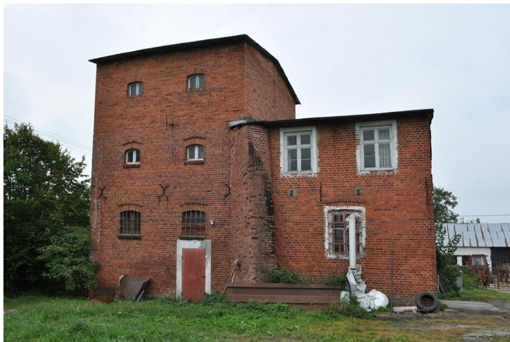
Jeżyczki - młyn