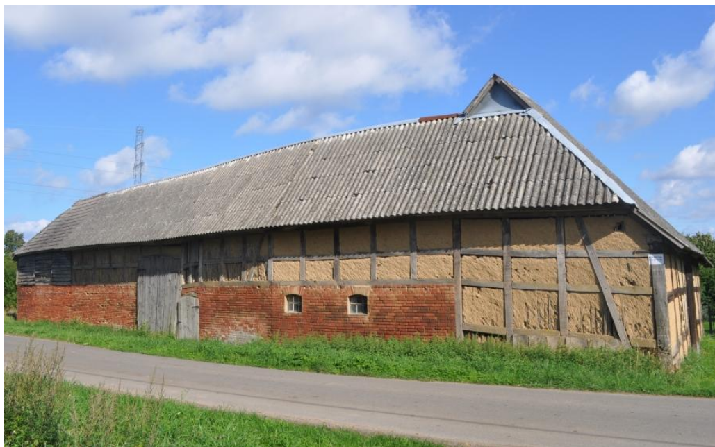
Dobiesław 41 – budynek bramny