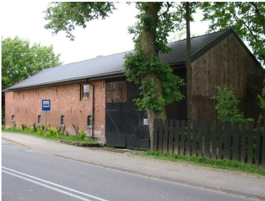
Słowino 76 – budynek bramny