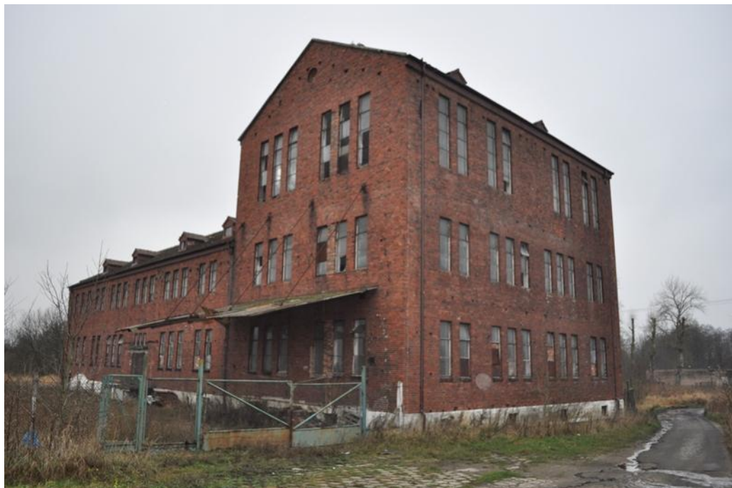
Wiekowo – fabryka płatków ziemniaczanych