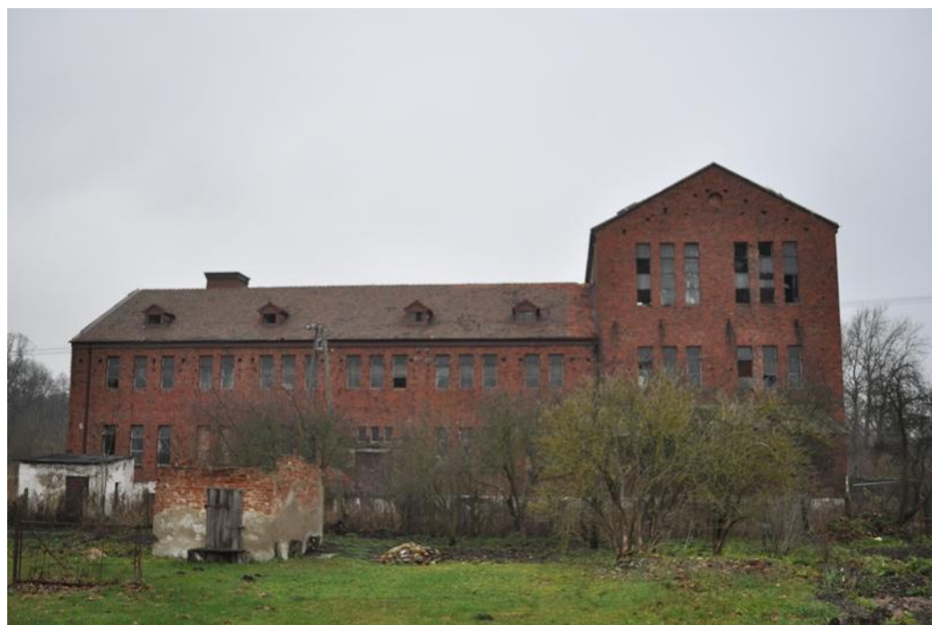
Wiekowo – fabryka płatków ziemniaczanych