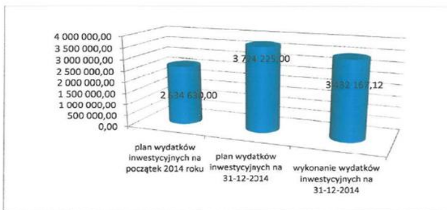
Wykres nr 1. Plan i wydatki inwestycyjne wykonane na dzień 31-12-2014 roku

Porównanie struktury wydatków inwestycyjnych w odniesieniu do planu na początek roku i planu po zmianach na dzień 31-12-2014 roku. obrazuje wykres nr 1.