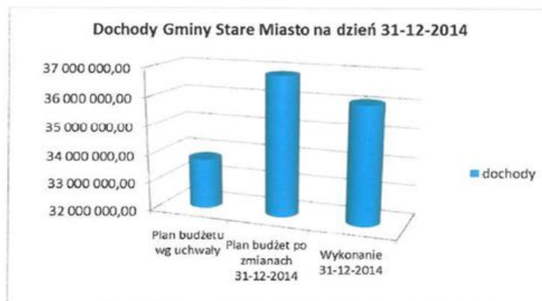
Tabela nr 1. Wykonanie dochodów gminy na 31-12-2013 r. i 31-12-2014 r.