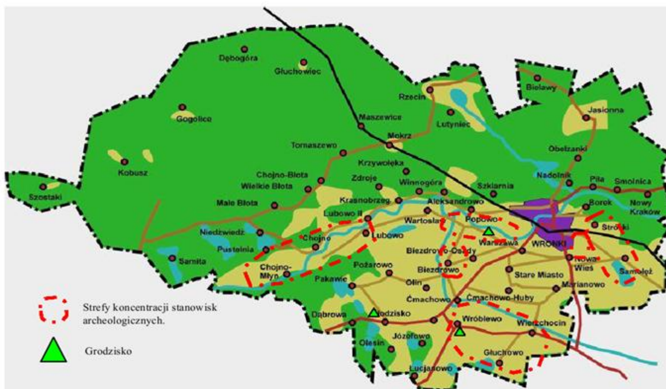
Mapa prezentująca strefy koncentracji stanowisk archeologicznych na terenie gminy Wronki.