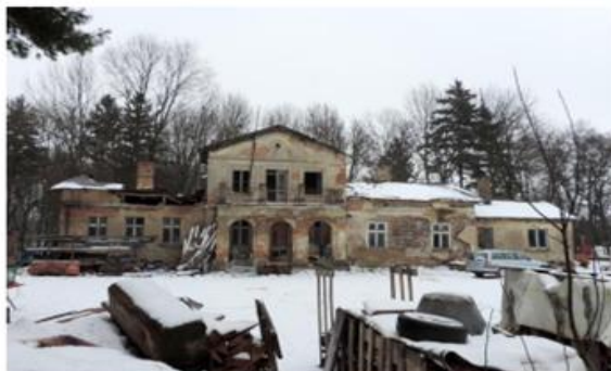
Zdjęcie nr 3. Dwór w Kawęczynie