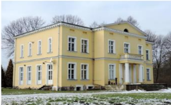
Zdjęcie nr 1. Dwór w Chocimku