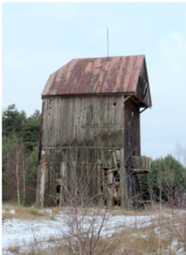
Zdjęcie nr 8. Wiatrak koźlak, Marcjanów