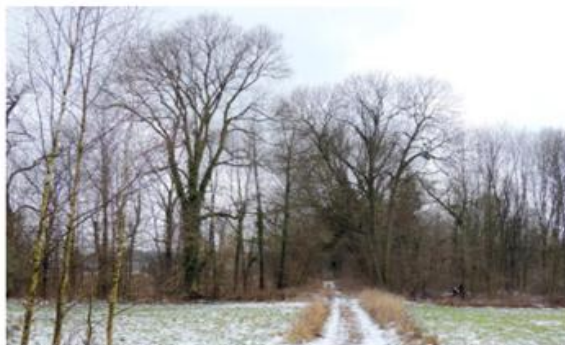
Zdjęcie nr 2. Park w Chocimiu