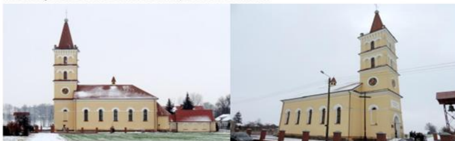
Zdjęcie nr 5, 6. Kościół pw. Siedmiu Boleści NMP, Kowale Pańskie