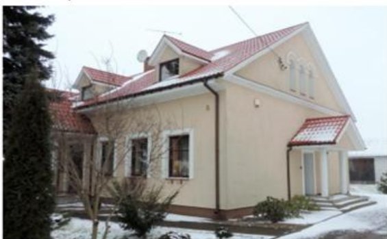
Zdjęcie nr 7. Plebania, Kowale Pańskie nr 5