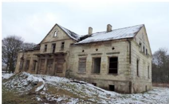
Zdjęcie nr 4. Dwór w Żdźarach