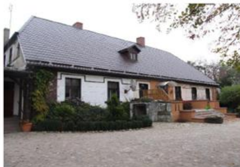
Dwór w Koszkowie