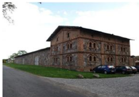
Spichlerz i stodoła w Zimnowodzie