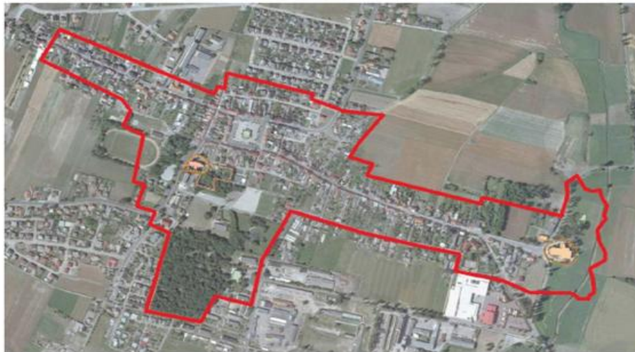
Zasięg ochrony założenia urbanistycznego miasta Borek Wlkp. (wg. mapy.zabytek.gov.pl)