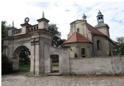
Kościół p.w. św. Stanisława Biskupa i brama wsch.

września 1959 r. wmurowano tablice ku czci żołnierzy, więźniów politycznych oraz członków ruchu oporu - ofiar okupacji hitlerowskiej. W ostatnich latach ścianę pamięci uzupełniła tablica ku czci Jana Pawła II.