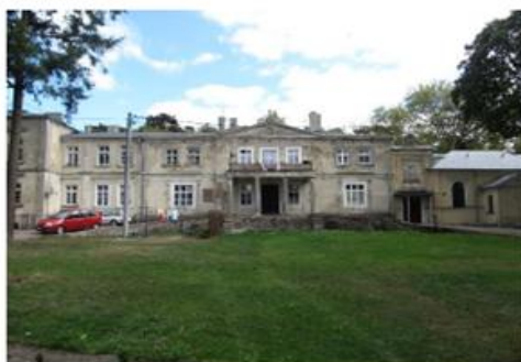
Pałac w Bruczkowie

Zespół pałacowy tworzą pałac, oficyna i park. Piętrowy pałac, w otoczeniu niewielkiego parku, pobudowali Koczorowscy w 2 poł. XIX w. W prawym skrzydle pałacu mieści się duża, bogato zdobiona kaplica z obrazem Ostatnia wieczerza . Główne wejście poprzedzone gankiem o czterech kolumnach dźwigających taras pierwszego piętra, poprzedzającym pseudoryzalit zwieńczony trójkątnym frontonem. Ostatnia przedstawicielka tego rodzaju przeznaczyła w okresie międzywojennym ten obiekt na zakład wychowawczy na sieroty i utrzymywała go aż do śmierci. W testamencie zapisała pałac i folwark Zgromadzeniu Księży Werbistów, który osiedlili się tutaj w 1929 r. i utworzyli Małe Seminarium Misyjne. W okresie II wojny światowej w pałacu mieścił się obóz przejściowy dla duchownych, a także powstał zakład germanizacyjny dla polskich dzieci. Te dramatyczne wydarzenia upamiętnione są na tablicach pamiątkowych przy wejściu do pałacu. W pałacu obecnie mieszczą się mieszkania, a w kaplicy pałacowej odprawiane są cyklicznie msze św. W oficynie pałacowej zorganizowany jest oddział Domu Pomocy Społecznej w Zimnowodzie – mieszkania grupowe.