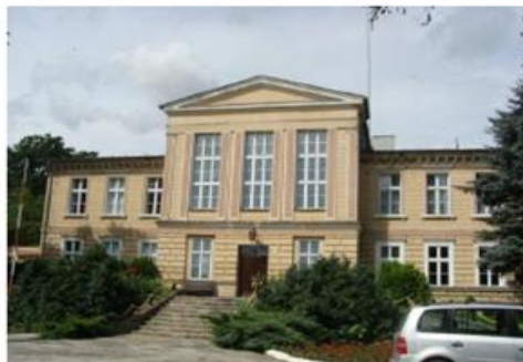
Pałac w Karolewie