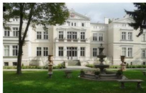
Pałac w Zalesiu