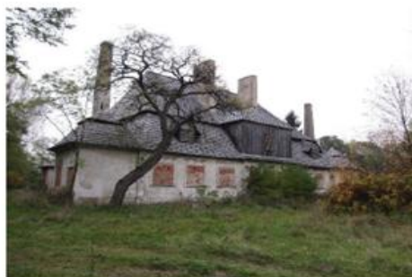
Dwór w Siedmiorogowie

Kapliczka przydrożna została wzniesiona w XVIII w. Murowana, otynkowana, w formie słupa na rzucie trójkąta o wklęsłych bokach i ściętych narożach, zwieńczonego belkowaniem i daszkiem namiotowym. W górnej części prostokątne wnęki, w jednej ikona Matki Boskiej z dzieciątkiem malowana na blasze.