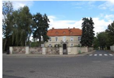
Plebania przy ul. Zdzeskiej