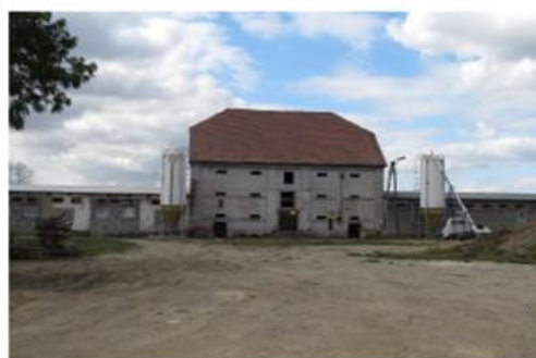
Spichlerz w Bruczkowie