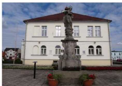
Ratusz, na pierwszym planie figura Matki Bożej