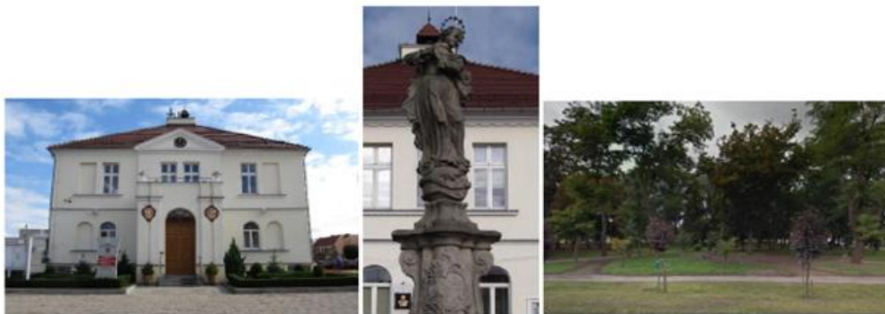
Obiekty wpisane do rejestru zabytków, będące własnością Gminy Borek Wlkp.:

Utrzymanie i konserwacja zieleni na terenie miasta, w tym utrzymanie Parku Miejskiego jest jednocześnie realizacją założeń Programu Ochrony Środowiska Gminy Borek Wlkp.