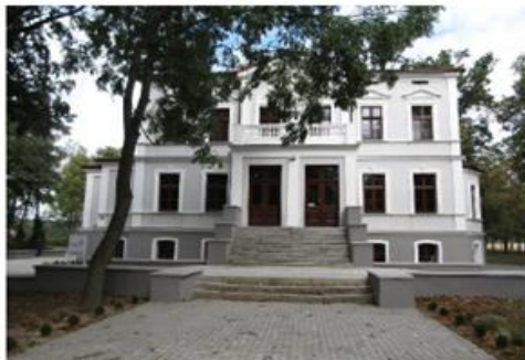
Pałac w Dąbrówce

Plebania wzniesiona w 1818-1825 r. Murowana, otynkowana, parterowa z przybudówką z 1870 r. od wschodu. Wnętrze dwutraktowe. Dach naczółkowy.