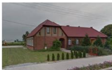
Szkoła, ob. świetlica w Bruczkowie

Budynek dawnej szkoły z końca XIX w. w Bruczkowie nr 37 użytkowany jest obecnie jako świetlica. W 2009 r. obiekt zmodernizowano, wymieniono pokrycie dachowe i stolarkę. Jest on w dobrym stanie technicznym, wymaga tylko bieżących napraw, które w miarę potrzeb będą wykonywane.