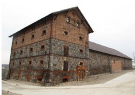
Spichlerz i stodoła w Koszkowie

Zabudowa gospodarcza zwarta, zbudowana z cegły bądź kamienia polnego, nakryta dachami dwuspadowymi. Dominantę zespołu stanowi budynek spichlerza. Spichlerz z 1865 r. Podmurówka oraz dwie kondygnacje z kamienia polnego, III kondygnacja oraz szczyty ceglane, nieotynkowane. Otwory okienne i drzwiowe ujęte w ceglane opaski. Poszczególne kondygnacje oddzielone gzymsem ceglany. Stropy belkowe, podłogi drewniane. Całość nakryta dachem dwuspadowym. Stodoła również z 1865 r. o podmurówce i ścianach z kamienia polnego. Na osi symetrii umieszczona para drewnianych wrót w ceglanych opaskach. Po obu stronach symetrycznie rozmieszczone otwory wentylacyjne. Dach dwuspadowy.