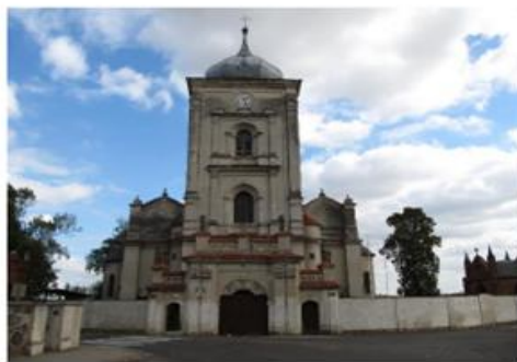
Kościół p.w. Pocieszenia NMP na Zdzieżu