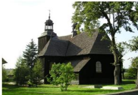
Kościół p.w. Wszystkich Świętych w Jeżewie