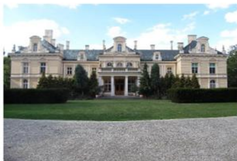
Pałac w Zimnowodzie

Miejscowość wzmiankowana w 1388 r. jako własność Zimnowodzkich. Od 1800 r. do czasów II wojny światowej pozostaje w rękach rodziny Mycielskich. Jest to typowa wieś folwarczna położona przy drodze Koźmin Wlkp. - Borek Wlkp. z klasycystycznym zespołem pałacowym położonym w krajobrazowym parku otoczonym murem i siatką. Obok rozciąga się XIX-wieczne podwórze folwarczne z dwoma dominantami usytuowanymi na osi podwórza: budynkiem spichlerza z 1867 r. oraz gorzelni z II poł. XIX w. Za podwórzem w kierunku wschodnim znajduje się zespół budynków szkolnych z końca XIX w. i pocz. XX w. Kolonia mieszkalna z 2 poł. XIX w. rozciąga się wzdłuż drogi, po przeciwległej stronie zespołu folwarcznego. Tworzą ją jednokondygnacyjne budynki dawnej służby folwarcznej z umieszczonymi na osiach kapliczkami wnękowymi. Dominantę w krajobrazie wsi stanowi bryła kościoła z pocz. XX w. usytuowanego przy wjeździe do wsi od strony zachodniej. Zimnowoda jest rzadkim już dziś przykładem południowowielkopolskiej wsi folwarcznej z zachowanym niezmienionym XIX-wiecznym układem przestrzenno-architektonicznym (zespołem pałacowo-parkowym, folwarcznym, kolonią mieszkaniową oraz zespołem kościelnym i szkolnym). Obok opisywanego układu ochroną objęto ponadto oś widokową z drogi Bolesławów-Rusko na bryłę kościoła w Zimnowodzie.