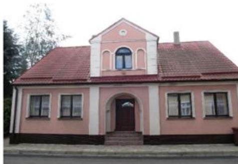
Dom przy ul. Zdzeskiej 36 w Borku Wlkp.

hemisferycznie wnęki. W partii dachu, na osi wystawka zwieńczona trójkątnym szczytem z okulesem pośrodku, przekryta dwuspadowym dachem. Fasada nieco przekształcona w 1880 r. oraz na początku XXI w., jest przykładem typowych rozwiązań dla XIX wiecznej zabudowy małych miast Wielkopolski.