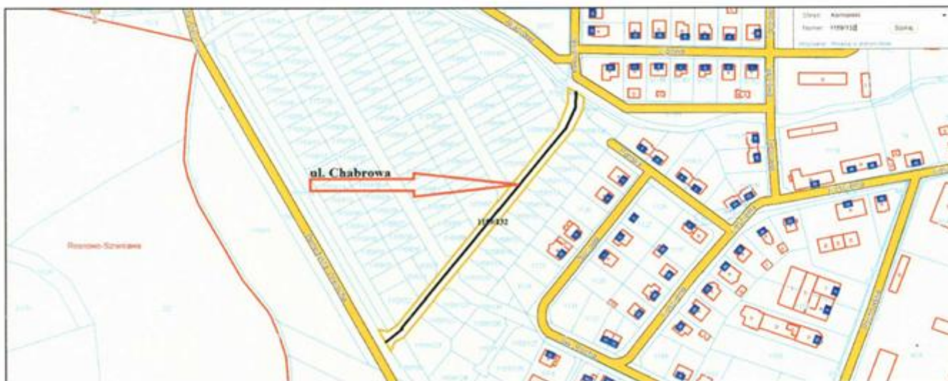
Plan sytuacyjny ul. Chabrowa w Komornikach

ZALĄCZNIK DO UCHWAŁY NR XXVI/267/2016 RADY GMINY KOMORNIKI z dnia 29 września 2016r.