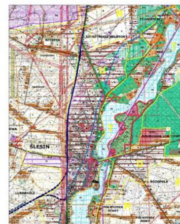
FRAGMENT STUDIUM UWARUNKOWAŃ I KIERUNKÓW ZAGOSPODAROWANIA PRZESTRZENNEGO MIASTA I GMINY ŚLESIN GRANICA TERENU OBJĘTEGO MIEJSCOWYM PLANEM ZAGOSPODAROWANIA PRZESTRZENNEGO