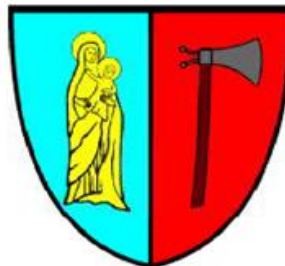
Ryc. 13. Herb Gminy Wągrowiec

Herbem Gminy Wągrowiec są dwa symbole. Znajdują się one na przedzielonej w pół tarczy. Po lewej stronie widnieje wizerunek Matki Bożej z Dzieciątkiem w kolorze żółtym na błękitnym tle. Wizerunek ten zapożyczono z pieczęci cystersów z 1309 r. Po prawej stronie znajduje się topór zwrócony ostrzem w prawo w kolorach: obuch – popielaty, toporzysko – brązowym na czerwonym tle. Jest on nawiązaniem do rodu Pałuków, zwanych Toporzycami, którzy pierwotnie posługiwali się herbem przedstawiającym siekierkę, a później topór. Tarcza otoczona jest czarnym obrysem.