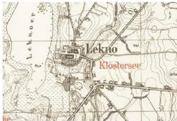
Ryc. 6. Łekno w 1940 r.

Wieś posiadała na początku 2016 r. 674 mieszkańców ogółem. Oddalona jest od Wągrowca w odległości ok. 9 km (odległość drogowa).