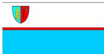
Ryc. 14. Flaga Gminy Wągrowiec

Na fladze Gminy Wągrowiec znajduje się jej herb w lewym górnym rogu. Kolorystykę flagi stanowi błękitny pas znajdujący się na dole o takiej samej szerokości, jak pas biały będący u góry. Przedziela je cienki, czerwony pas w proporcji 1:8. Kolor niebieski to kolor maryjny, zaś kolor czerwony znajdował się w herbie Pałuków.