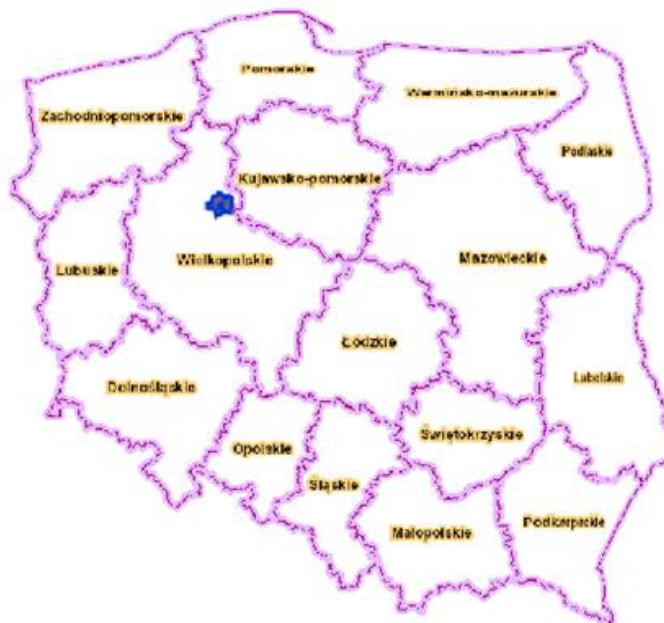
Ryc. 2. Położenie Gminy Wągrowiec na tle Polski