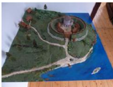
Fot. 8. Rekonstrukcja grodziska w Łeknie