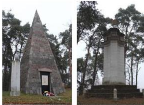
Fot. 11. Grobowiec oraz kolumna w Łaziskach

Z neobarokowym obiektem związany jest szereg opowieści i legend. Jedna z nich mówi, że pod filarem pogrzebany jest koń rotmistrza. Z kolei inni twierdzą, że spoczywają tam bohaterowie polegli w obronie kraju.