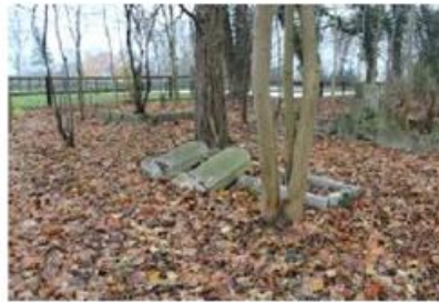
Fot. 5. Cmentarz w Czekanowie