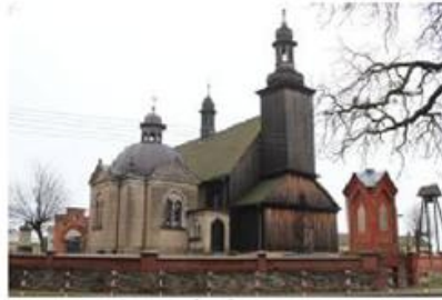
Fot. 13. Kościół w Potulicach