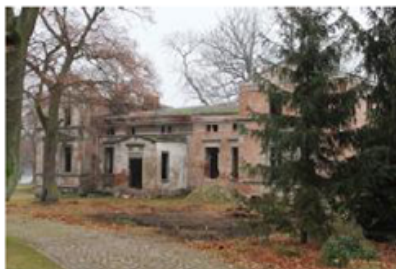
Fot. 6. Pałac w Łęgowie