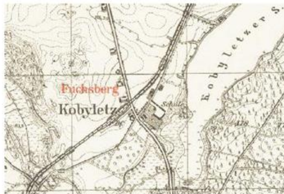
Ryc. 5. Kobylec w 1940 r.

Wieś posiadała na początku 2016 r. 722 mieszkańców ogółem. Oddalona jest od Wągrowca w odległości ok. 6,5 km (odległość drogowa).