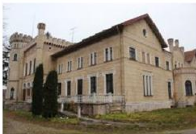
Fot. 15. Pałac w Wiatrowie