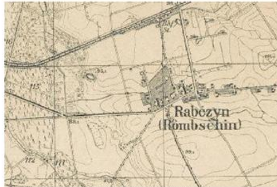
Ryc. 12. Rąbczyn w 1936 r.

Wieś posiadała na początku 2016 r. 456 mieszkańców ogółem. Oddalona jest od Wągrowca w odległości ok. 9 km (odległość drogową).