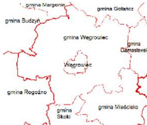
Ryc. 1. Położenie Gminy Wągrowiec w układzie gmin sąsiednich