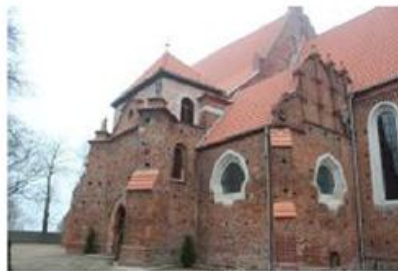
Fot. 12. Kościół w Łeknie

Trójnawowa świątynia posiada wielobocznie zamknięte prezbiterium, które jest niższe i węższe od nawy głównej. Przy prezbiterium znajduje się zakrystia i dawna kaplica św. Józefa ze szczytem wczesnorenesansowym. W skład wyposażenia budowli wchodzi barokowy ołtarz główny z 1 poł. XVIII w. oraz późnorenesansowe sakramentarium z końca XVI w.