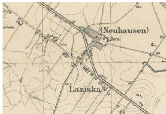
Ryc. 10. Łaziska w 1936 r.

Wieś posiadała na początku 2016 r. 503 mieszkańców ogółem. Oddalona jest od Wągrowca w odległości ok. 5 km (odległość drogowa).