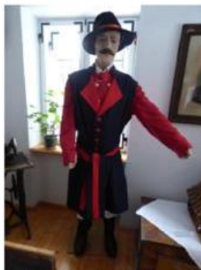
Fot. 2. Pałucki strój ludowy