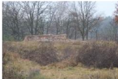
Fot. 10. Ruiny zamku w Danaborzu

Ruiny zamku usytuowane są na niewielkim wzniesieniu przy Jeziorze Grylewskim. Wybudowany został przez rodzinę Danaborskich w pierwszej połowie XIX wieku. Jego fundatorem był nakielski szambelan Włodek z Danaborza. Po zamku pozostało kilka cegieł, które najprawdopodobniej tworzyły prostokątną wieżę o wymiarach 9 x 15 metrów. Fundamenty tworzą kamienie eratyczne, czyli głązy narzutowe. Budowla w źródłach XV-wiecznych określana była jako „fortalicjum”. Gotycki zamek był prywatną własnością pełniącą funkcję obronne.