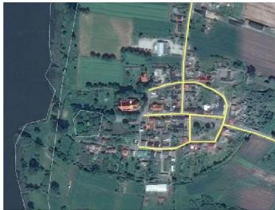
Ryc. 3. Zabytkowy układ ruralistyczny Łekna

Na uwagę zasługuje północno – zachodnia część wsi Łekno, która stanowi zabytkowy układ ruralistyczny wsi. Tzw. Łekneński kompleks osadniczy od wczesnego średniowiecza stanowił jeden z ważniejszych punktów osadniczych. Sama wieś wzmiankowana jest już w 1136 r. W dalszych latach uwidacznia się na tym obszarze ciągłość osadnicza. Natomiast pierwsi osadnicy zajmowali te obszary 12 – 8 tys. lat p.n.e. Obecny fragment wsi zachował kształt przedstawiony na poniższej rycinie.