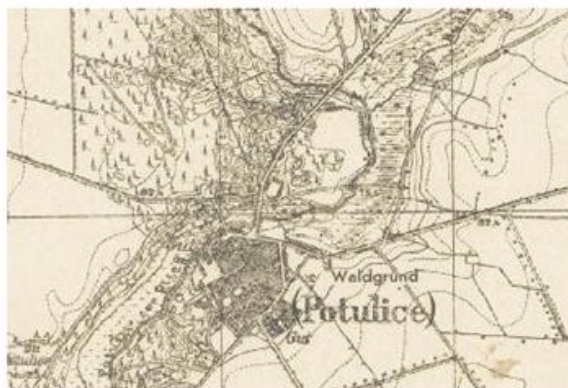
Ryc. 11. Potulice w 1944 r.

Wieś posiadała na początku 2016 r. 467 mieszkańców ogółem. Oddalona jest od Wągrowca w odległości ok. 11,5 km (odległość drogowa).