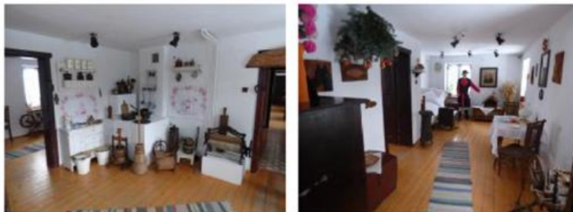
Fot. 1. Pałucka chata

Poprzez rozmaite działania, muzeum popularyzuje postać księdza Jakuba Wujka oraz dzieje Cysterskiego Opactwa Łekneńsko – Wągrowieckiego. Poniżej przedstawiono kilka zdjęć ukazujących zasoby muzeum.