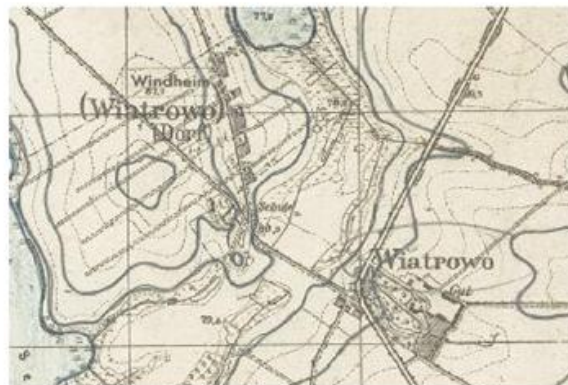
Ryc. 8. Wiatrowo w 1944 r.

Źródło: mapa topograficzna Messtischblatt, godło 3268