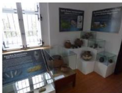
Fot. 3. Wystawa archeologiczna