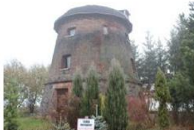
Fot. 9. Wiatrak holender w Bracholinie