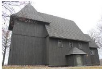
Fot. 14. Kościół w Tarnowie Pałuckim

Jednonawowa budowla posiada od strony zachodniej niewysoką wieżę. W kościele występują przebogata polichromia z ok. XVII wieku – późnorenesansowy ołtarz główny, dwa ołtarze boczne i rokokowa ambona. Na ścianach przedstawione są sceny z życia św. Małgorzaty, św. Mikołaja, scena Sądu Ostatecznego, adoracja Świętej Trójcy oraz nad chórem postacie aniołów.