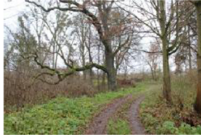
Fot. 7. Park w Żelicach