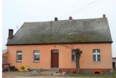
Fot. 4. Dom w Brzeźnie Starym z końca XIX w.

to głównie dawne dwojaki czy czworaki z terenów folwarcznych. Duża część domów została otynkowana w przeciwieństwie do budynków gospodarczych (14), spichlerzy (7), stajni i obór (6) bądź budynków inwentarskich (2), czy mieszkalno - gospodarczych (2).