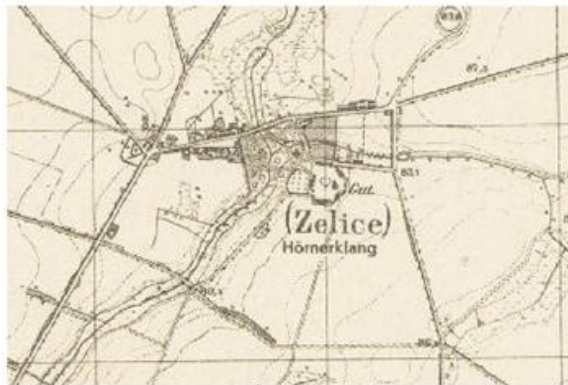
Ryc. 7. Żelice w 1944 r.

Wieś posiadała na początku 2016 r. 548 mieszkańców ogółem. Oddalona jest od Wągrowca w odległości ok. 10,5 km (odległość drogowa).