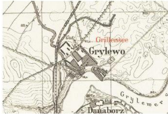
Ryc. 9. Grylewo w 1940 r.

Wieś posiadała na początku 2016 r. 506 mieszkańców ogółem. Oddalona jest od Wągrowca w odległości ok. 13 km (odległość drogowa).