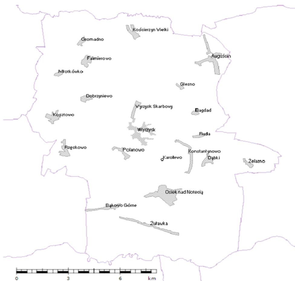
Ryc. 10. Miejscowości w Gminie Wyrzysk