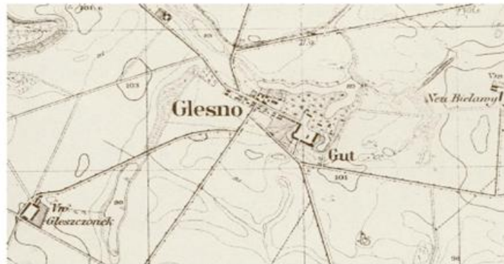
Ryc. 5. Glesno w 1944 r.