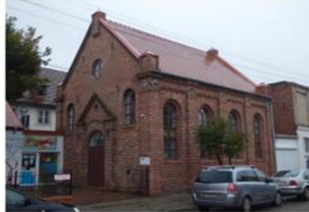
Fot. 17. Synagoga w Wyrzysku

tu magazyn, a od 2008 r. jest we własności prywatnej. Murowaną bożnicę zbudowano na miejscu poprzedniej – drewnianej i obecnie posiada wymiary 9,1 na 11,1 m z powierzchnią 172 m 2 . Podczas prac odrestaurowano ceglane detale elewacji, zabezpieczono też resztki polichromii sklepienia – motywy rozsypanych gwiazdek, symbolizujące niebo.