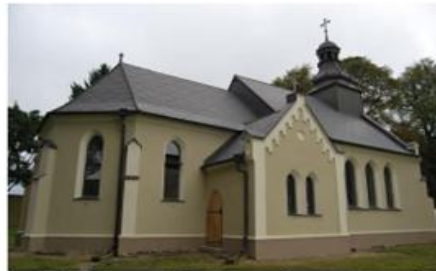
Fot. 14. Kościół parafialny pw. św. Anny w Kosztowie

nieczynny, zachował się jedynie nagrobek z 1914 r.). Z dawnego drzewostanu zachowała się lipa i klon. Jednonawowy kościół na rzucie prostokąta posiada we wschodniej części węższe prezbiterium na planie prostokąta zamknięte trójbocznie. Na północ oraz południe z prezbiterium wystają dwa aneksy. Wejście główne mieści się od strony zachodniej, podobnie jak niewielka wieża kościelna kryta hełmem baniastym z latarnią. W skład wyposażenia kościoła wchodzi neobarokowy ołtarz z XVII w. oraz ambona i chrzcielnica w stylu rokokowym z 2 poł. XVIII w. Kubatura kościoła wynosi 1084 m 3 , zaś jego powierzchnia 181 m 2 .