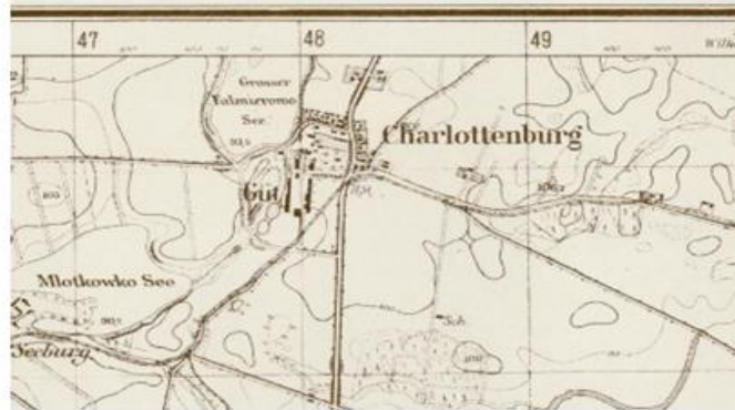
Ryc. 7. Falmierowo w 1944 r.

Miejscowość na dzień 25.10.2016 r. posiadała 406 mieszkańców, w tym 4 mieszkańców czasowych. Oddalona jest od Wyrzyska w odległości ok. 7 km (odległość drogową).