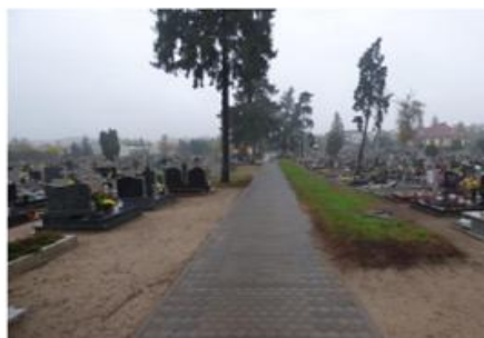
Fot. 8. Cmentarz w Osieku nad Notecią