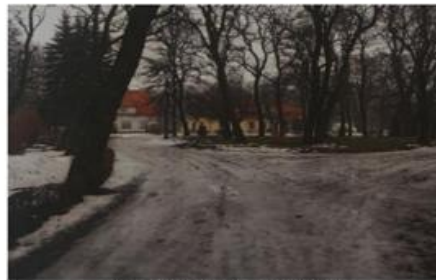
Fot. 10. Park w Gleźnie