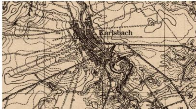
Ryc. 8. Kościerzyn w 1940 r.