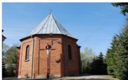
Fot. 13. Kościół parafialny pw. św. Jakuba Większego w Gromadnie

rzymsko – katolicką świątynię wybudowano w roku 1873 w stylu neoromańskim. Przy kościele znajduje się brama – dzwonnica z 1859 r., częściowo drewniana, która również została wpisana do rejestru zabytków. Orientowana budowla znajduje się we wschodniej części miejscowości na niewielkim wzgórzu, w niedalekiej odległości od jeziora. Trójnawowy kościół na rzucie wydłużonego prostokąta posiada krótkie, wyodrębnione prezbiterium zamknięte trójbocznie. W części południowej kościoła znajduje się mała kruchta. Z zachodniej części nawy kościoła występuje trójkondygnacyjna wieża w formie ryzalitu, w której mieści się wejście główne. Ponadto zachodnia część kościoła odznacza się dekoracyjnymi szczykami w formie krenelaży zakończonymi półkolistymi formami. W neobarokowym ołtarzu kościoła umieszczono rzeźby późnobarokowe z XVIII w. Kubatura kościoła wynosi 1300 m 3 , zaś jego powierzchnia 82 m 2 .