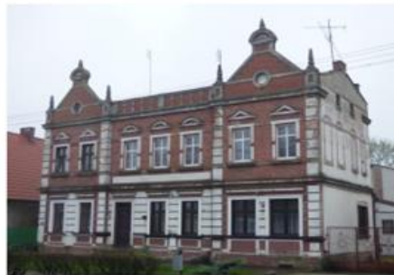
Fot. 7. Budynek mieszkalny w Osieku nad Notecią z 1900 r.

Wśród opracowanych kart adresowych mieszczą się zabytki wpisane do rejestru. W GEZ figurują obiekty o zróżnicowanych funkcjach. Poniżej krótko je scharakteryzowano. Budynki mieszkalne stanowią większość wszystkich obiektów znajdujących się w kartach adresowych. Przykład budownictwa wielorodzinnego na obszarze Gminy Wyrzysk ukazuje fotografia 7.