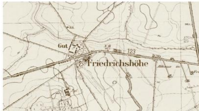
Ryc. 6. Kosztowo w 1944 r.