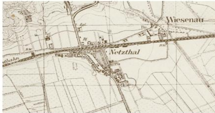
Ryc. 4. Osiek nad Notecią w 1944 r.

Miejscowość na dzień 25.10.2016 r. posiadała 3 812 mieszkańców, w tym 68 mieszkańców czasowych. Warto odnotować, iż nigdy nie posiadała praw miejskich. Oddalona jest od Wyrzyska w odległości ok. 4,5 km (odległość drogowa).