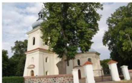
Fot. 12. Kościół parafialny pw. św. Jadwigi w Gleśnie