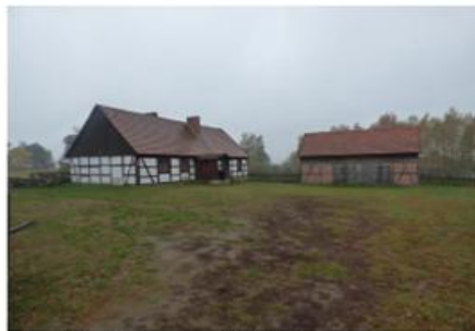
Fot. 3. Chata z Kościerzyna Wielkiego oraz obórka z Bąkowa

Poniżej przedstawiono kilka zdjęć ukazujących zasoby muzeum.