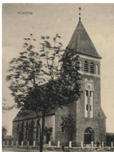
Fot. 2. Nieistniejący kościół ewangelicki w Osieku nad Notecią

Podobnie, jak i w Wyrzysku, tak również w Osieku nad Notecią mieścił się kościół ewangelicki. Rosnąca liczba wiernych z pocz. XX w. zmusiła władze pruskie do wybudowania świątyni. Ukończenie budowy nastąpiło 27.12.1909 r. Świątynia w stylu neogotyckim znajdowała się przy obecnej ulicy Głównej. W 1924 r. nastąpiła próba siłowego odebrania świątyni mniejszości niemieckiej przez Polaków (katolików), ponieważ po I wojnie światowej ewangelicy częściowo wyjechali z Osieka nad Notecią, a katolicy nie posiadali jeszcze własnego kościoła. Spór załagodzone, a katolicy dostali pozwolenie na budowę własnego kościoła. W czasie II wojny światowej kościół ewangelicki w Osieku nad Notecią ponownie zaczął odżywać, wzrastała liczba ewangelików. Ostatnie nabożeństwo odprawione zostało najprawdopodobniej 17.01.1945 r. Ponadto ewangelicy posiadali swoją szkołę (obecnie szkoła im. Jana Pawła II) oraz pastorówkę (obecnie przedszkole). Po zakończeniu działań wojennych dawny kościół ewangelicki chwilo użytkowany był przez katolików, a później funkcjonował jako magazyn GS. Wyburzono go w 1968 roku.