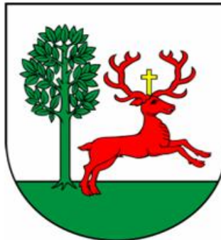
Ryc. 11. Herb Gminy Wyrzysk