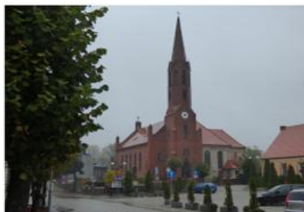
Fot. 16. Kościół parafialny pw. św. Marcina w Wyrzysku