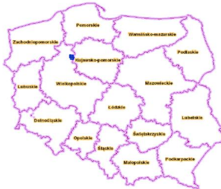
Ryc. 2. Położenie Gminy Wyrzysk na tle Polski