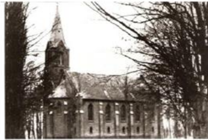
Fot. 1. Nieistniejący kościół ewangelicki w Wyrzysku