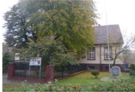
Fot. 9. Dawny dwór w Wyrzysku