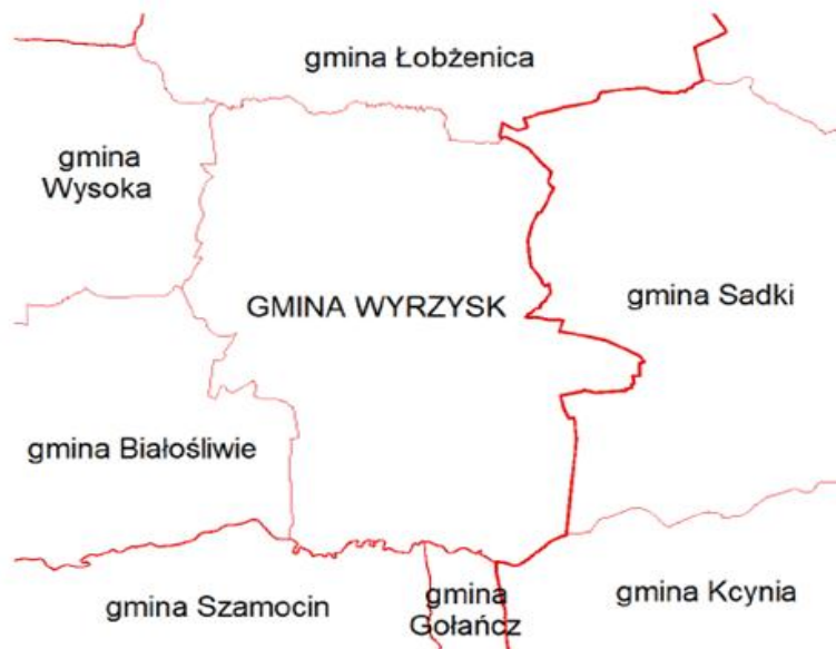
Ryc. 1. Położenie Gminy Wyrzysk w układzie gmin sąsiednich