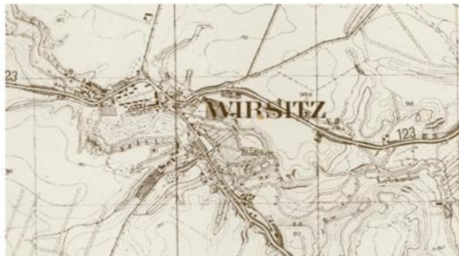
Ryc. 3. Wyrzysk w 1944 r.

Miasto na dzień 25.10.2016 r. posiadało 5 186 mieszkańców, w tym 83 mieszkańców czasowych.