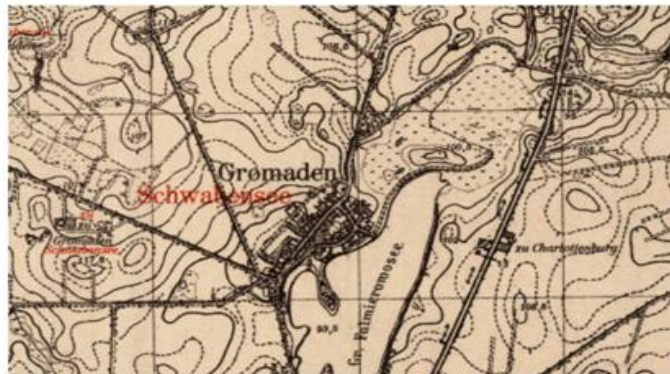
Ryc. 9. Gromadno w 1940 r.