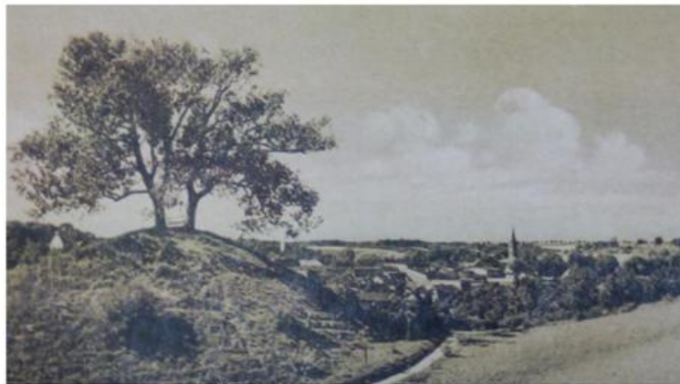
Fot. 6. Góra „Czubatka” w 1942 r.

Innym elementem związanym z dziedzictwem niematerialnym z terenu opisywanego powiatu są bajki i legendy. Na górze Czubatce w Wyrzysku znajdowało się grodzisko. Jego kształt wskazuje na to, iż była to kwadratowa wieża, postawiona na stożku o średnicy 25 m. Gród położony był na stromym, morenowym cyplu, na wzniesieniu zwanym Czubatką, usypanym przez ludzi zamieszkujących miasto w czasach panowania Piastów. Na szczycie Czubatki rosły dwa wysokie dęby, nazwane niegdyś „Adamem i Ewą” na cześć zakochanych. Wzniesienie istnieje do dzisiaj i jest często odwiedzane przez spacerujących tamtędy zakochanych. Na miejscu starych drzew zostały zasadzone nowe. Wspomnienie o tych drzewach jest legendą i jednocześnie symbolem grodu nad Łobżonką.