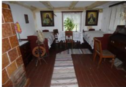
Fot. 5. Wnętrze jednej z zabytkowych chat

Należy zaznaczyć, że prócz Muzeum Kultury Ludowej w Osieku nad Notecią na terenie Gminy Wyrzysk jest również Izba Pamięci w Wyrzysku pod patronatem Towarzystwa Przyjaciół Wyrzyska, w której gromadzone są lokalne przedmioty świadczące o dziedzictwie regionu. Izba znajduje się na pierwszym piętrze przedwojennej willi starosty – ulica Bydgoska 32. Można tu zwiedzać wiele eksponatów przekazanych przez mieszkańców miasta i okolic, w tym ponad 300 fotografii, a wśród nich najstarsza z 1873 r. przedstawiająca dawny browar. Wyodrębniono następujące ekspozycje: