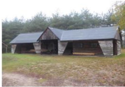
Fot. 4. Tartak z Rudy