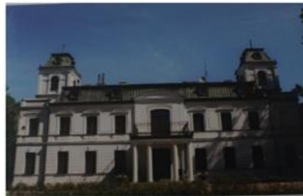
Fot. 11. Pałac w Dąbkach

Pałac w Dąbkach wpisany został do rejestru zabytków pod numerem A-387 z dniem 14.01.1981 r. Budynek powstał w 1872 r. w stylu neobarokowym według projektu poznańskiego architekta Mariana Cybulskiego. Pierwszym właścicielem rezydencji był hrabia Ignacy Bniński. W latach 20. XX w. przejął go zarząd państwowy. Od 1940 r. pałac i zabudowania folwarczne hitlerowcy zamienili na obóz jeńców angielskich. W latach 50. XX w. użytkowany był przez PGR jako budynek biurowy oraz przez Polski Związek Łowiecki jako hotel w latach 70. Obecnie jego właścicielem jest Skarb Państwa. Pałac wybudowano na rzucie wydłużonego prostokąta w kierunku wschodnio – zachodnim. Dwukondygnacyjna budowla posiada frontalny pseudoryzalit, filarowo – kolumnowy portyk, a nad nim balkon. W bocznych częściach pałacu znajdują się dwie trójkondygnacyjne wieże, w których znajdują się klatki schodowe. Kubatura pałacu wynosi 4948 m 3 , zaś jego powierzchnia 819,1 m 2 . W skład zespołu pałacowego wchodzi również park o początkach XVIII – wiecznych, o powierzchni ok. 6 ha. Najstarsze pojedyncze drzewa z lat 1850 – 1870 występują przy pałacu oraz w pobliżu stawu. Reszta zadrzewień datowana jest na lata 1920 – 1930. W parku znajdowała się stajnia z 2 poł. XIX w., najprawdopodobniej została rozebrana.