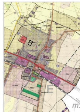
FRAGMENT STUDIUM UWARUNKOWAN I KIERUNKÓW ZAGOSPODAROWANIA PRZESTRZENNEGO GMINY STRZAŁKOWO ----- GRANICA OBSZARU OBJĘTEGO PLANEM