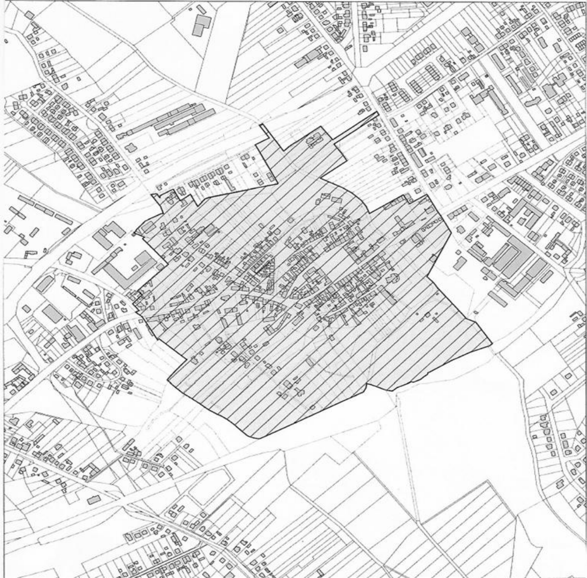
OBSZAR ZDEGRADOWANY I OBSZAR REWITALIZACJI DLA MIASTA I GMINY SĘSZEW

Załącznik nr 3 do Uchwały XXIV/255/2017 Rady Miejskiej Gminy Sęszew Z dnia 24 kwietnia 2017r.