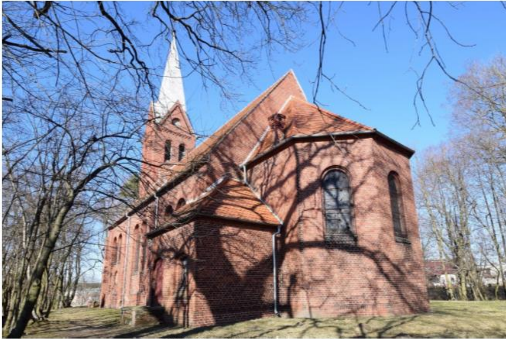
Kobyła Góra, widok od południowego zachodu