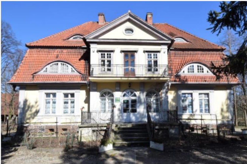
Willa obecnie plebania, widok od południa

Marszałki, zespół folwarczny, sierociniec, ob. dom opieki społecznej