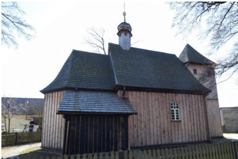
Widok od północnego wschodu

Kościół wzniesiony w 1758 r. na miejscu starszej świątyni. Obiekt w konstrukcji zrębowej, z zewnątrz oszalowany.