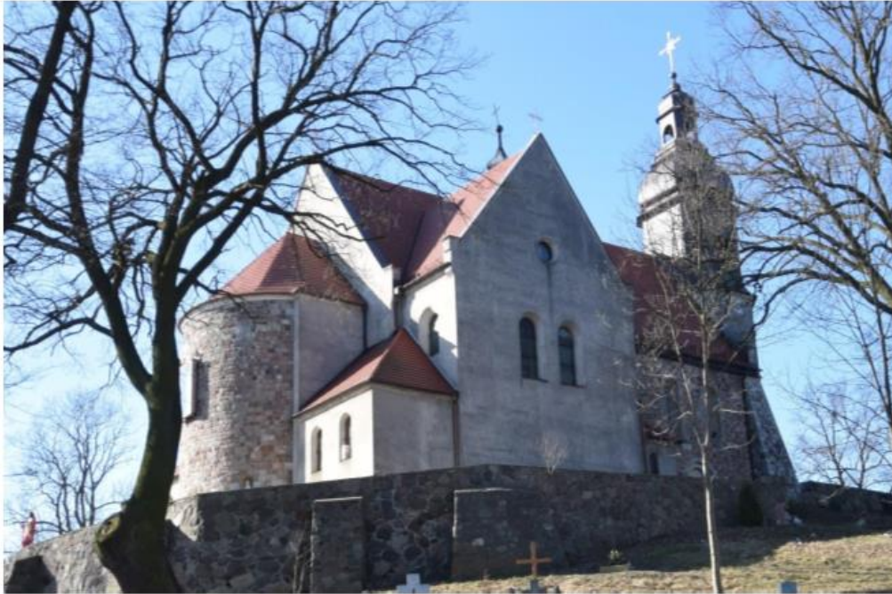
Widok od północnego wschodu

Zachowane obiekty swoim rodowodem sięgają czasów średniowiecznych. Takim przykładem jest kościół pw. Nawiedzenia NMP w Kotłowie.