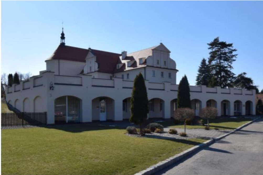
Widok od północnego wschodu

Zespół klasztorny oo. bernardynów, obecnie nazaretanek w Ostrzeszowie, należy do najokazalszych zabytków monastycznych w Wielkopolsce. Nieprzekształcone wnętrze kościoła z jego zachowanym wyposażeniem i wystrojem jest świadectwem bogactwa czasów baroku.