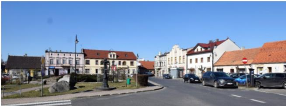
Grabów nad Prosną, rynek, widok od południowego wschodu

Stan zachowania historycznych układów jest dobry. Niekorzystnie wpływającymi elementami jest nieuregulowana kwestia reklam oraz występujący wzmożony ruch samochodowy poprowadzony przez historyczne centra miast.