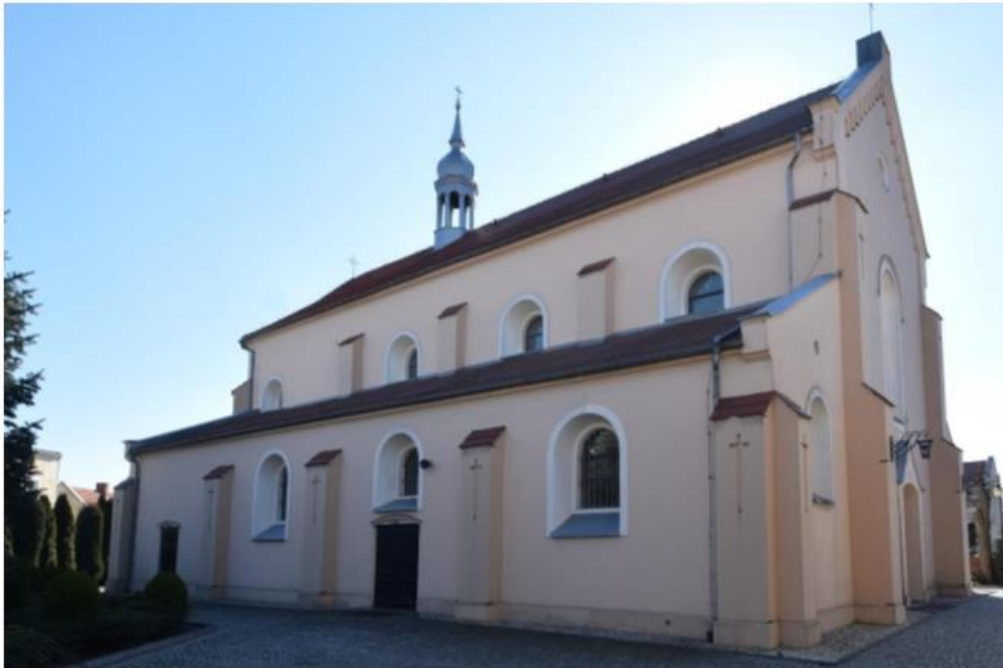
Grabów nad Prosną, kościół par. pw. Serca NMP i św. Mikołaja, widok od północnego zachodu

Na terenie powiatu zachowały się dwa założenia klasztorne, które zostały wpisane do rejestru zabytków: