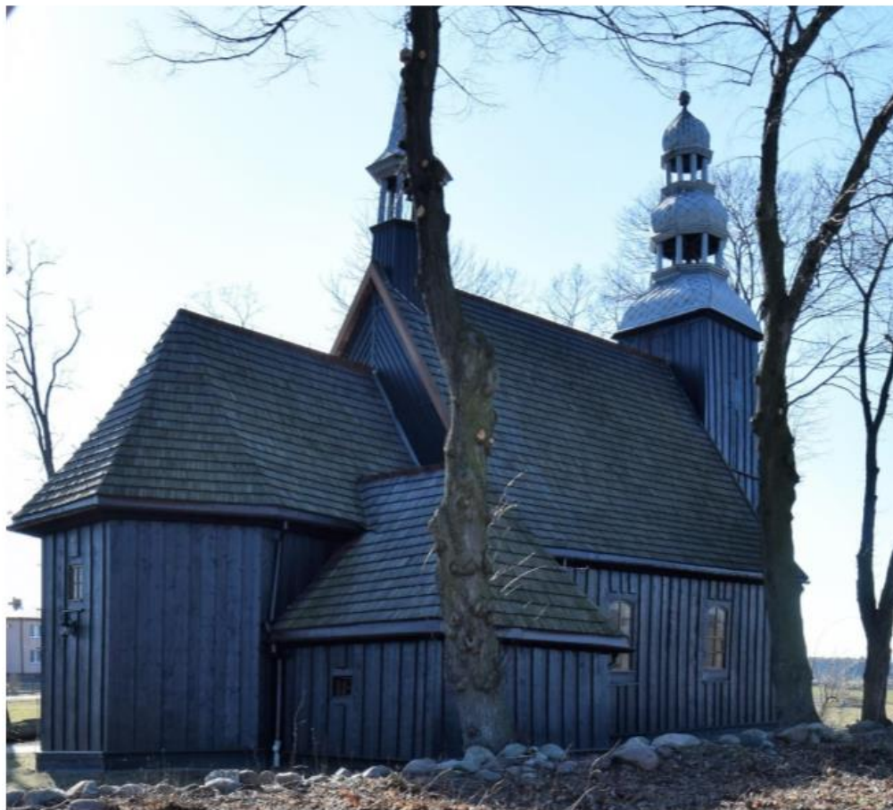
Widok od północnego wschodu

Drewniany kościół filialny w Myślniewie jest przedstawicielem typowego wiejskiego drewnianego budownictwa sakralnego występującego na terenie Wielkopolski. Wzniesiony został w 1746 roku, w konstrukcji zrębowej, z wieżą w konstrukcji słupowej. Kościół jest z zewnątrz oszalowany. W latach 1974-1975 kościół był remontowany. W 2018 roku zostało wymienione pokrycie. Obecnie kościół jest utrzymany w dobrym stanie.