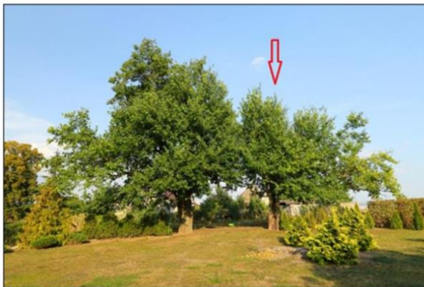
wrzesień 2019 r.

Załącznik Nr 2 do uchwały Nr LV/646/23 Rady Gminy Suchy Las z dnia 30 marca 2023 r.