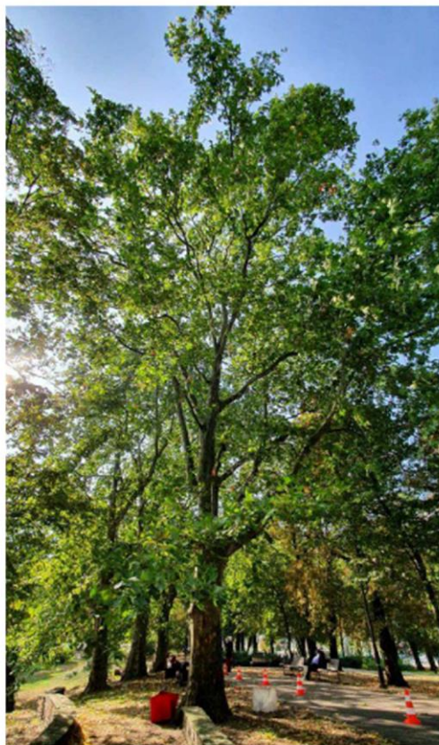
Fot. 1. Platan klonolistny nr 1