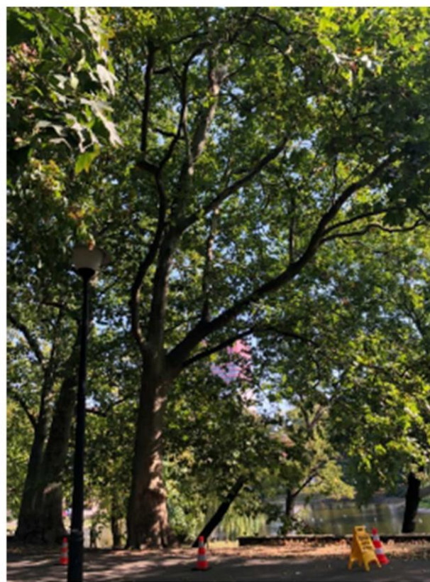
Fot. 4. Platan klonolistny nr 4