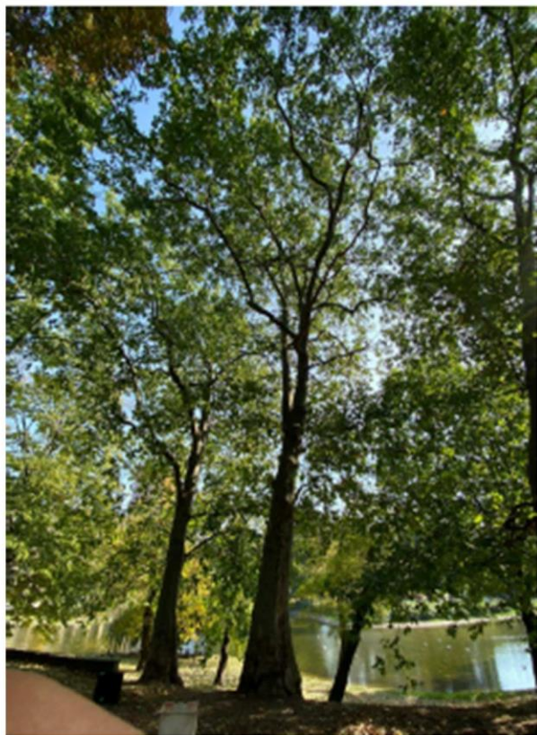
Fot. 3. Platan klonolistny nr 3