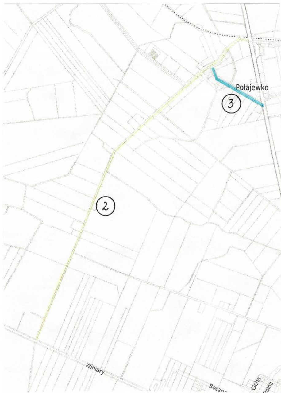
Przebieg drogi gminnej – 184059(nr 2) oraz /dr. nr 184049 – dr. woj. nr 178 (nr 3)