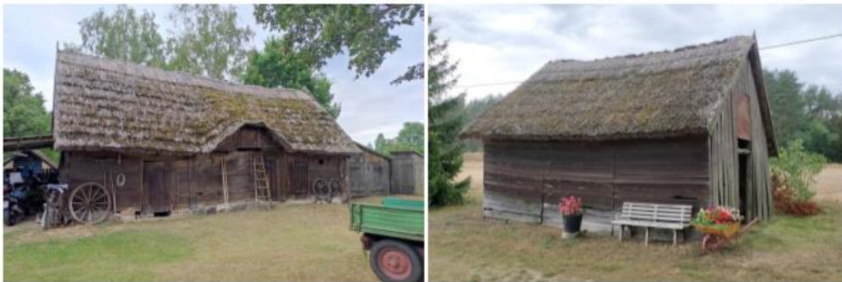
Zdjęcia nr 9, 10. Bolewico nr 18, obora i stodoła

Wnętrza tych domów są równie interesujące. Na ścianach działowych lub ścianie kominowej budowano bardzo charakterystyczną szafę wnątkową. Szafę dobiły dwuskrzydłowe, drewniane drzwi, zazwyczaj z szybkami u góry. Ciekawym elementem znajdującym się w tzw. dużej izbie był piec kaflowy, często ozdobione gzymsem, usytuowane w narożniku przy ścianie oddzielającej izbę od alkierza lub też stawiane w małej izbie na zasadzie wykorzystywania istniejącej ścianki. Belki stropowe ozdabiano podłużnymi żłobieniami oraz rozetą – znakiem mistrza ciesielskiego. W oknach umieszczano drewniane okiennice.