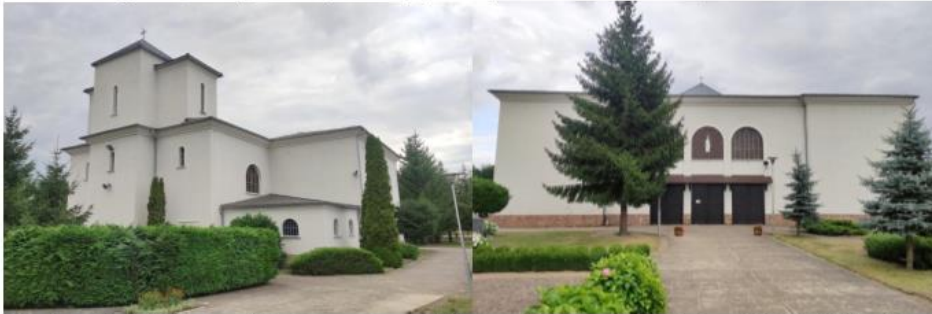
Zdjęcia nr 5, 6. Kościół ewangelicki, ob. rzym.-kat. parafialny pw. Chrystusa Króla, Bolewice, ul. Świebodzińska 35