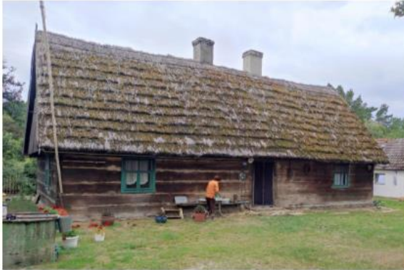
Zdjęcie nr 8. Bolewico nr 18, dom mieszkalny

podstawowym budulcem tych gospodarstw było drewno (zazwyczaj dąb, sosna lub modrzew) i glina, to do dnia dzisiejszego możemy podziwiać wiele takich domów, niektóre do dziś są nadal zamieszkałe.