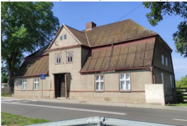
Zdjęcie nr 7. Młynarzówka, ob. budynek mieszkalny, Miedzichowo, ul. Zbąszyńska 2

Budynek wzniesiony prawdopodobnie w poł. XIX w. Po 1945 r. dom wraz z obiektami przemysłowymi i gospodarczymi należał do Rejonowych Młynów Gospodarczych w Nowym Tomysłu, następnie własność gminna. Od 1984 r. własność prywatna. Pierwotnie w skład zagrody młyńskiej wchodziła jeszcze stodoła i kurnik.