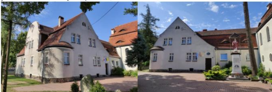
Zdjęcia 3, 4. Pastorówka, ob. plebania w zespole kościoła poewangelickiego ob. rzymsko-katolickiego parafialnego pw. św. Stanisława Biskupa i Męczennika, Miedzichowo ul. Poznańska 37

Budynek usytuowany przy kościele, przylega do niego od wsch. Pastorówka nieprzebudowana, pełni do dziś funkcję plebani.