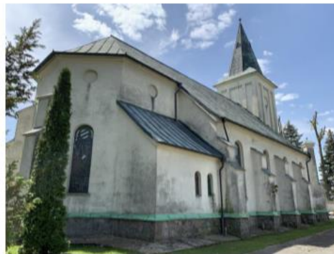
Fot. 96-97. Kościół pw. św. Stanisława w Pruścach, nr rejestru A-593 z 19.12.1988 r.