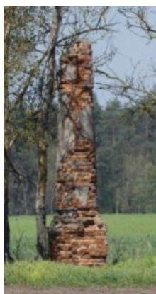
Fot. 112. Kolumna nr 2 (znak graniczny majątku) w Welnie, nr rejestru 1131/Wlkp/A z 30.09.2021 r.