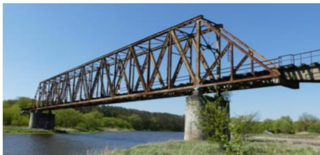
Fot. 59. Most kolejowy na rzece Warcie z przyczółkami, nr rejestru 1129/Wlkp/A z 5.10.2021 r.