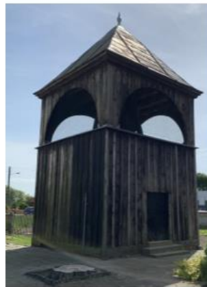
Fot. 95. Dzwonnica w Parkowie, nr rejestru 1587 z 29.07.1974 r.