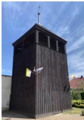
Fot. 69. Dzwonnica, Plac Jana Pawła II w Rogoźnie, nr rejestru 74 z 17.05.1965 r.