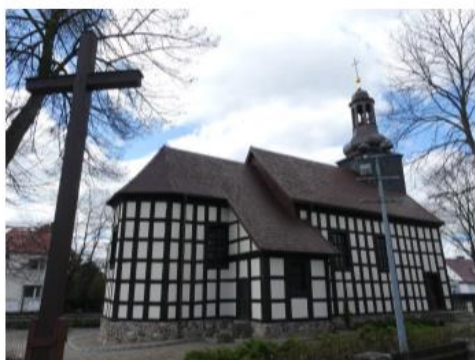
Fot. 3-4. Kościół pw. Świętego Krzyża, ul. Zwycięstwa w Obornikach, nr rejestru 1217/A z 3.09.1970 r.