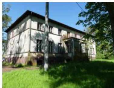
Fot. 60-61. Dwór w Urbaniu, nr rejestru 2109/A z 17.10.1986 r.