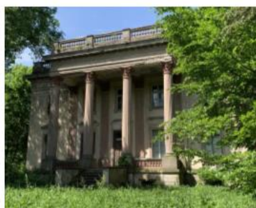
Fot. 101-102. Pałac w Słomowie, nr rejestru A-1336 z 12. 01.1972 r.