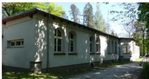
Fot. 17. Pawilon I w Kowanówku, nr rejestru 2297/A z 24.02.1994 r.