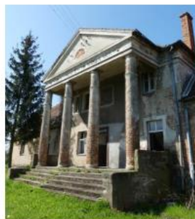
Fot. 12-13. Dwór w Gołębowie, nr rejestru 1081/A z 18.04.1970 r.