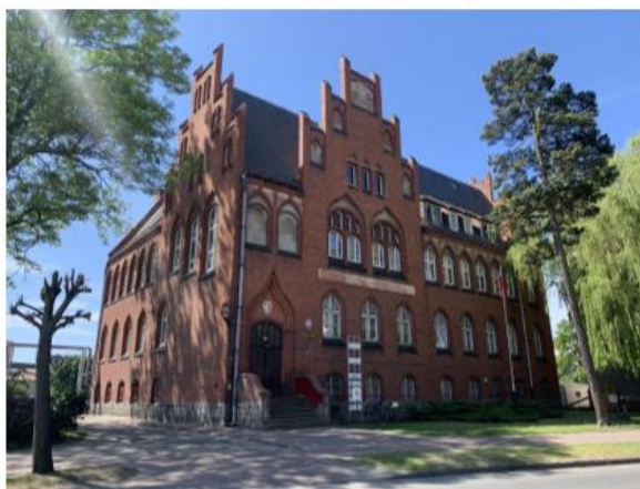
Fot. 72. Sąd, obecnie szkoła, ul. Kościuszki 41 w Rogoźnie, nr rejestru 254/Wlkp/A z 17.10.2005 r.