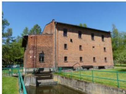
Fot. 86-87. Młyn w Jaracz Młyn, nr rejestru A-752 z 30.12.1993 r.