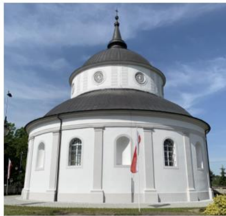
Fot. 93-94. Kościół pw. św. Małgorzaty, nr rejestru AK-11a/103 z 12.12.1932 r.