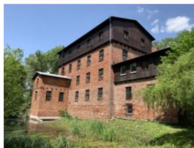
Fot. 99-100. Młyn wodny w Rudzie, nr rejestru 255/Wlkp/A z 14.10.2005 r.