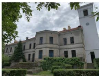
Fot. 113-114. Dwór w Gorzewie, nr rejestru A-1690 z 4.04.1975 r.