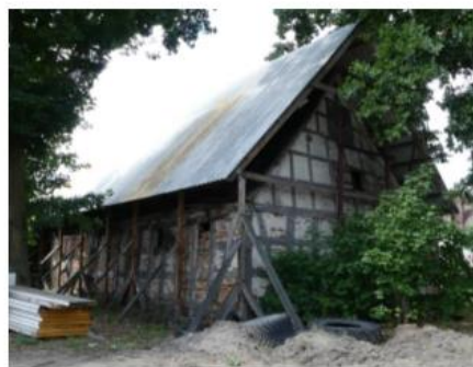
Fot. 10-11. Spichlerz w Golaszynie, nr rejestru 1584/A z 29.07.1974 r.