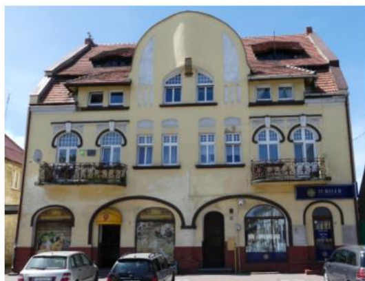
Fot. 80. Dom, ul. Wielkopoznańska 30 w Rogoźnie, nr rejestru A-739 z 28.12.1992 r.