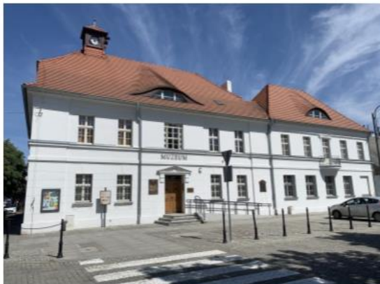
Fot. 73. Ratusz, Plac Karola Marcinkowskiego 1 w Rogoźnicy, nr rejestru A-308 z 21.10.1968 r.