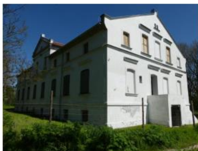
Fot. 14. Dwór w Górcze, nr rejestru 2112/A z 17.10.1986 r.