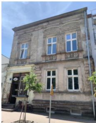
Fot. 76. Dom, Plac Powstańców Wielkopolskich 7 w Rogoźnie, nr rejestru A-543 z 29.12.1986 r.