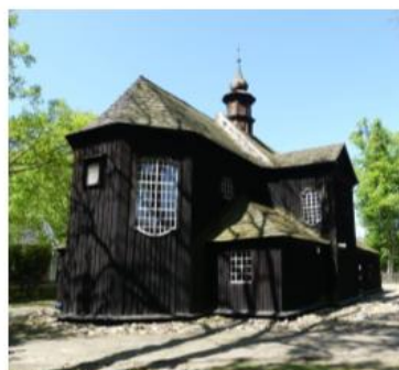
Fot. 107-108. Kościół pw. Podwyższenia Krzyża w Welnie, nr rejestru AK-I-11a/105 z 12.12. 1932 r.