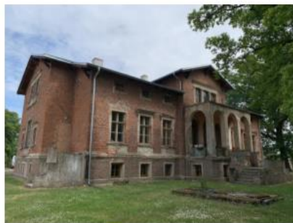
Fot. 121-122. Dwór w Orłowie, nr rejestru A-1692 z 4.04.1975 r.