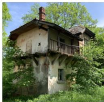
Fot. 103-104. Oficyna w Słomowie, nr rejestru A-596 z 21.03.1989 r.