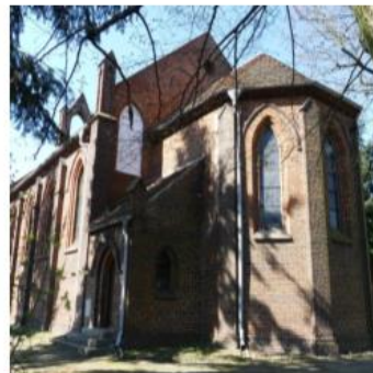
Fot. 35-36. Kościół pw. św. Mikołaja w Maniewie, nr rejestru 2201/A z 11.10.1990 r.