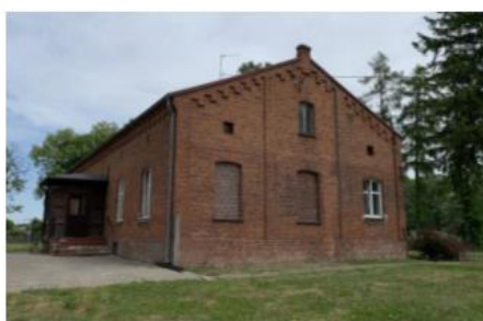
Fot. 117-118. Plebania w Ludomach, nr rejestru 671/Wlkp/A z 17.04.2008 r.