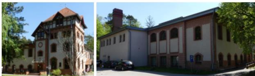
Fot. 21-22. Budynek gospodarczy w Kowanówku, nr rejestru 2297/A z 24.02.1994 r.