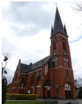
Fot. 5-6. Kościół ewangelicki, obecnie rzymsko-katolicki pw. św. Józefa, ul. Lipowa 10 w Obornikach, nr rejestru 2233/A z 19.05.1992 r.