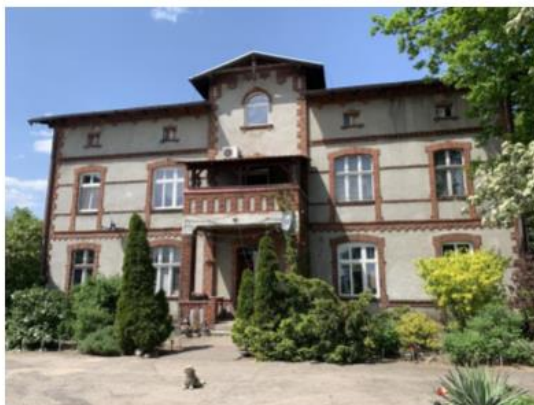
Fot. 85. Dom w Cieślach, nr rejestru A-444 z 25.07.1983 r.