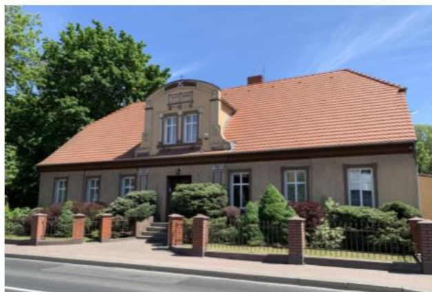
Fot. 66. Plebania, ul. Kościelna 10 w Rogoźnie, nr rejestru A-544 z 29.12.1986 r.