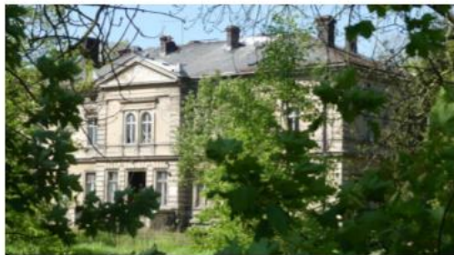
Fot. 33. Pałac w Łukowie, nr rejestru 306/A z 17.10.1968 r.