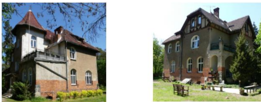
Fot. 23-24. Willa lekarza w Kowanówku, nr rejestru 2297/A z 24.02.1994 r.