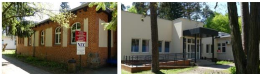
Fot. 19-20. Pawilon III w Kowanówku, nr rejestru 2297/A z 24.02.1994 r.