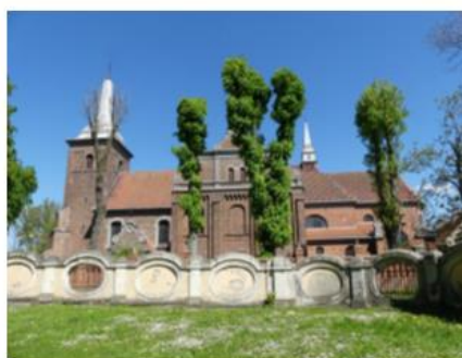
Fot. 41-42. Kościół pw. św. Bartłomieja w Objezierzu, nr rejestru 2394/A z 12.12.1932 r.