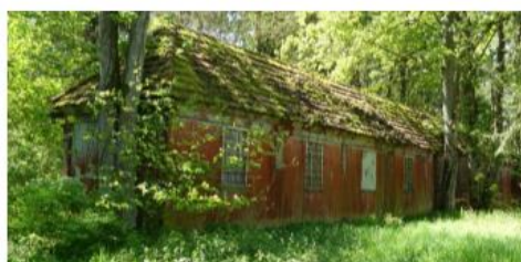
Fot. 29-30. Leżakownie w Kowanówku, nr rejestru 2297/A z 24.02.1994 r.