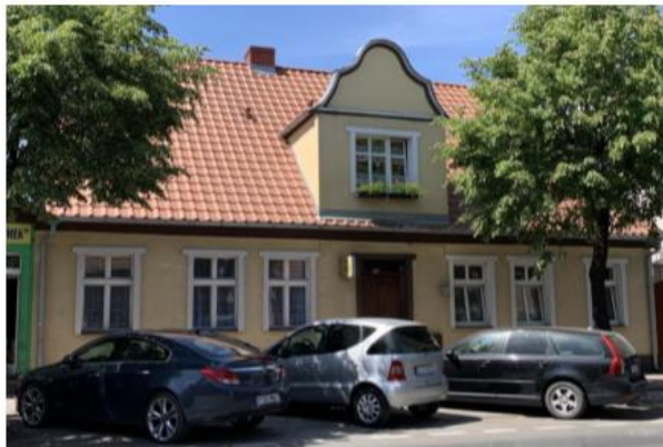
Fot. 78. Dom, ul. Wielkopoznańska 22 w Rogoźnie, nr rejestru A-1592 z 29.07.1970 r.