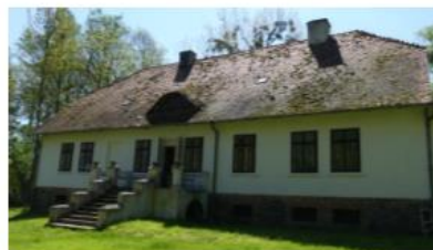
Fot. 39-40. Dwór w Niemieczkowie, nr rejestru 2616/A z 3.02.1997 r.