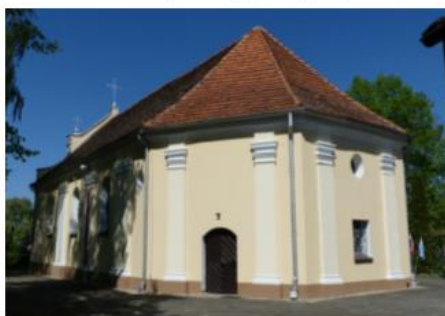
Fot. 55-56. Kościół pw. św. Katarzyny w Rożnowie, nr rejestru 1509/A z 11.04.1974 r.