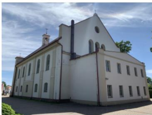
Fot. 67-68. Kościół ewangelicki, obecnie rzymsko-katolicki pw. Świętego Ducha, Plac Jana Pawła II w Rogoźnie, nr rejestru 74 z 17.05.1965 r.