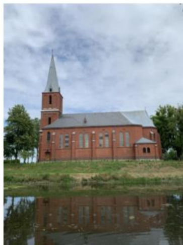
Fot. 115-116. Kościół pw. św. Jana Chrzciciela w Ludomach, nr rejestru 671/Wlkp/A z 17.04.2008 r.