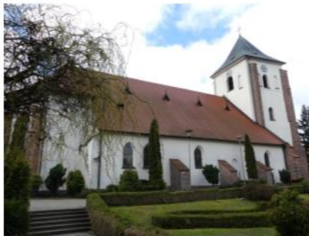
Fot. 1-2. Kościół pw. Wniebowzięcia NMP, ul. Kościelna w Obornikach, nr rejestru 2395/A z 12.12.1932 r.