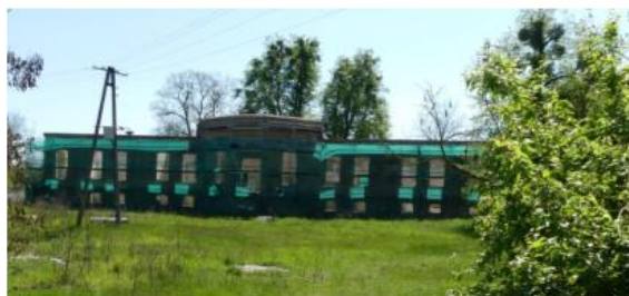
Fot. 109. Pałac w Welnie, nr rejestru A/310 z 21.10.1968 r.