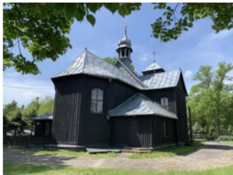
Fot. 83-34. Kościół pw. św. Jakuba w Budziszewku, nr rejestru 1216 z 3.09.1970 r.