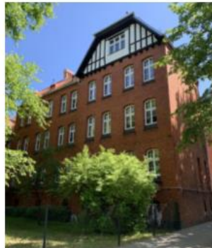
Fot. 70-71. Kompleks budynków Seminarium Nauczycielskiego, ul. Wojska Polskiego 1a w Rogoźnie, nr rejestru 253/Wlkp/A z 11.10.2005 r.