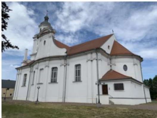
Fot. 123-124. Kościół pw. św. Mikołaja, ul. ks. Stepczyńskiego w Ryczywół, nr rejestru 670/Wlkp/A z 15.04.2008 r.