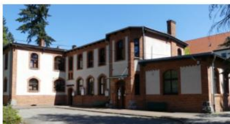
Fot. 15-16. Budynek administracyjno-gospodarczy w Kowanówku, nr rejestru 2297/A z 24.02.1994 r.