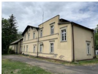
Fot. 119-120. Pałac w Nininie, nr rejestru A-1691 z 4.04.1975 r.