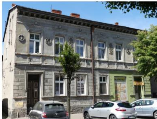
Fot. 82. Dom, ul. Wielkopoznańska 66 w Rogoźnie, nr rejestru A-542 z 29.12.1986 r.