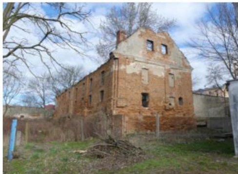
Fot. 7. Skrzydło dawnego klasztoru franciszkanów, obecnie magazyn, ul. Sądowa w Obornikach, nr rejestru 1169/A z 17.07.1970 r.