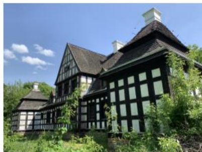
Fot. 105-106. Dwór w Studzieńcu, nr rejestru kl.IV-73/75/53 z 9.12.1953 r.