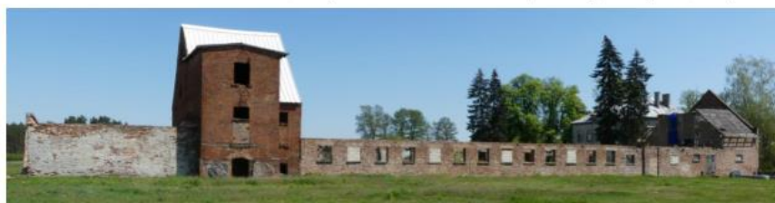
Fot. 50. Podwórze z zabudowaniami gospodarczymi: stajnia z kuźnią, obora, magazyn paszowy w Obornikach-Rudki, nr rejestru 1962/A z 19.11.1984 r.