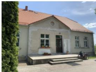
Fot. 98. Plebania w Pruszcach, nr rejestru A-215/1100 z 29.04.1970 r.