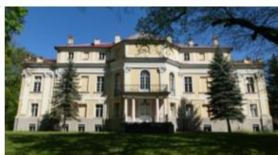
Fot. 44-45. Pałac w Objezierzu, nr rejestru 307/A z 17.10.1968 r.