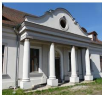
Fot. 53-54. Dwór w Ocieszynie, nr rejestru 1082/A z 18.04.1970 r.