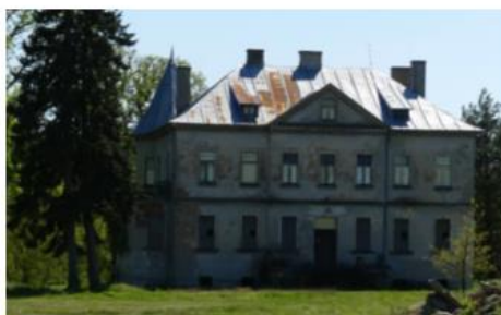
Fot. 49. Dwór w Obornikach-Rudki, nr rejestru 1694/A z 4.04.1975 r.