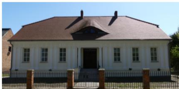
Fot. 43. Plebania w Objezierzu, nr rejestru 1097/A z 29.04.1970 r.