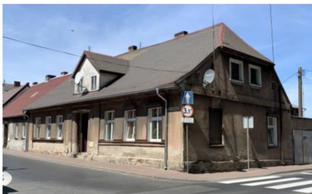
Fot. 75. Dom, ul. Kilińskiego 5 w Rogoźnicy, nr rejestru A-1593 z 29.07.1974 r.