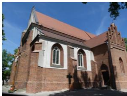
Fot. 64-65. Kościół pw. św. Wita, ul. Kościelna w Rogoźnie, nr rejestru AK-I-11a/104 z 12.12.1932 r.