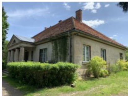
Fot. 91-92. Dwór w Marlewie, nr rejestru A-445 z 15.07.1983 r.