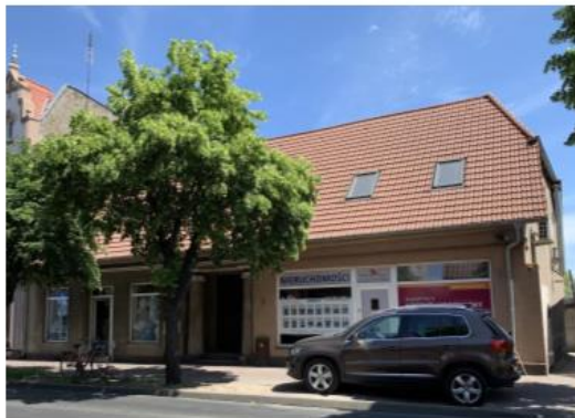
Fot. 79. Dom, ul. Wielkopoznańska 29 w Rogoźnie, nr rejestru A-874 z 7.10.1970 r.