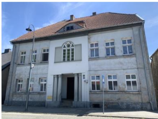
Fot. 74. Sąd, obecnie dom mieszkalny, Plac Karola Marcinkowskiego 9 w Rogoźnicy, nr rejestru A-155/309 z 21.10.1968 r.