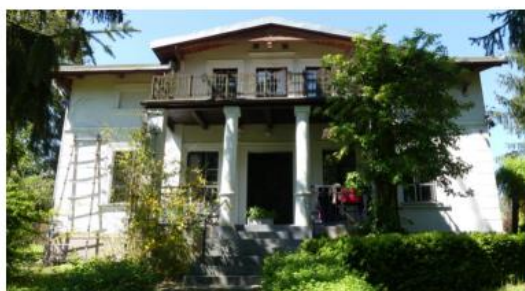
Fot. 57. Młynarzówka w Ruks Młyńskie, nr rejestru 2617/A z 3.02.1997 r.