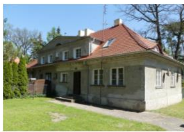
Fot. 27-28. Domy mieszkalne 1 i 2 w Kowanówku, nr rejestru 2297/A z 24.02.1994 r.