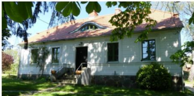
Fot. 58. Dworek w Ruks Młynie, nr rejestru 2617/A z 3.02.1997 r.