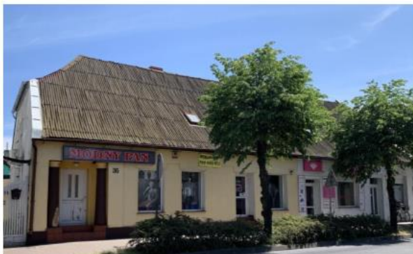
Fot. 81. Dom, ul. Wielkopoznańska 35 w Rogoźnie, nr rejestru A-875 z 7.10.1970 r.