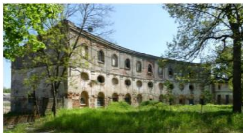
Fot. 110. Welnia oficyna, nr rejestru 1410/A z 1.03.1973 r.