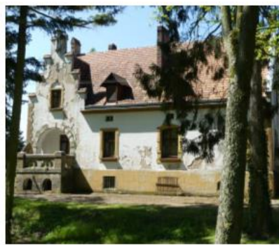
Fot. 8-9. Willa w Bąblinie, nr rejestru 2153/A z 19.04.1988 r.