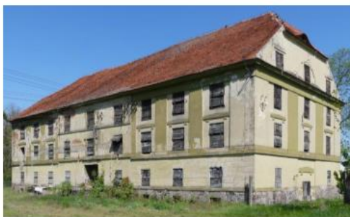
Fot. 34. Spichlerz w Łukowie, nr rejestru 306/A z 17.10.1968 r.