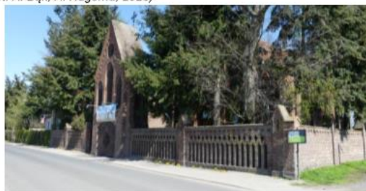
Fot. 37-38. Ogrodzenie oraz brama-dzwonnica w Maniewie, nr rejestru 2201/A z 11.10.1990 r.