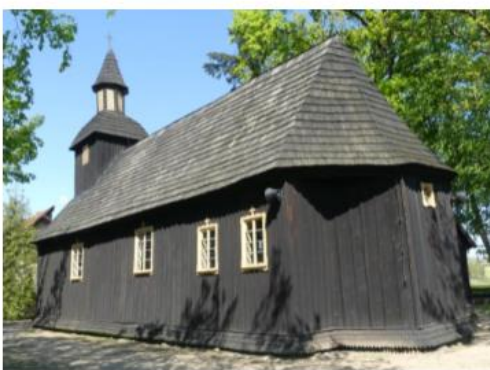
Fot. 31-32. Kościół pw. św. Michała Archanioła w Łukowie, nr rejestru 2392/A z 12.12.1932 r.