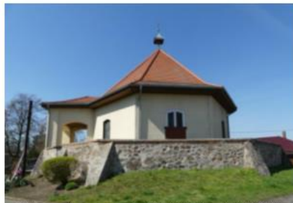
Fot. 51-52. Kaplica pw. św. Wawrzyńca oraz ogrodzenie w Ocieszynie, nr rejestru 875/Wlkp/A z 10.12.2012 r.