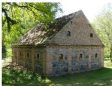
Fot. 90. Stajnia w Jaracz Młyn, nr rejestru A-752 z 30.12.1993 r.