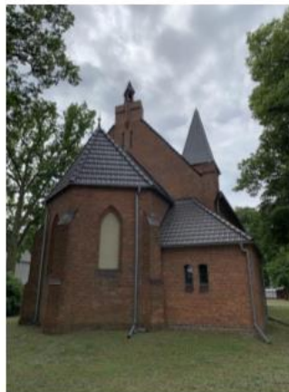
Fot. 125-126. Kościół ewangelicki, ul. Czarnkowska w Ryczywół, nr rejestru 537/Wlkp/A z 28.08.2007 r.