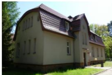
Fot. 25-26. Przytułek w Kowanówku, nr rejestru 2297/A z 24.02.1994 r.