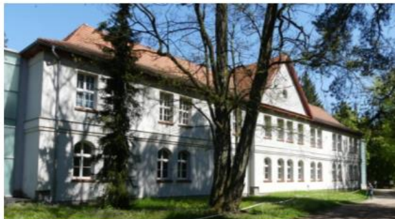
Fot. 18. Pawilon II w Kowanówku, nr rejestru 2297/A z 24.02.1994 r.