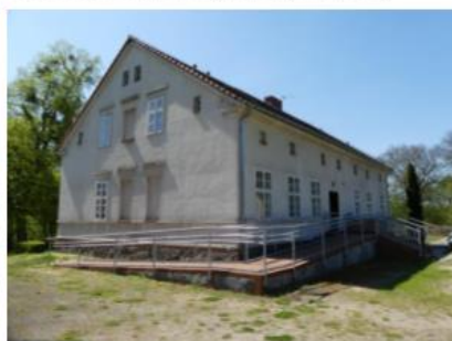
Fot. 88-89. Dom młynarza w Jaracz Młyn, nr rejestru A-752 z 30.12.1993 r.