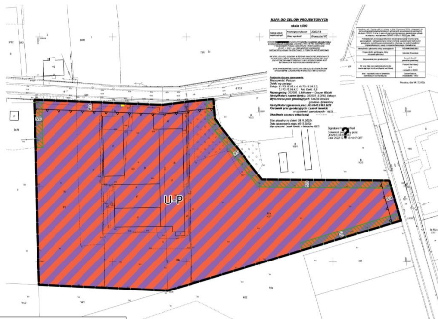
WYRYS ZE STUDIUM UWARUNKOWAŃ I KIERUNKÓW ZAGOSPODAROWANIA PRZESTRZENNEGO GMINY MIŁOŚLAW SKALA 1:10 000