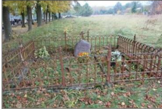
Rysunek 14. Cmentarz ewangelicki, ob. rzym.-kat. w Kuźnicy Żelichowskiej

Stary cmentarz ewangelicki w Kuźnicy Żelichowskiej, obecnie czynny rzymsko-katolicki. Pochodzi on z początku XX wieku. Najstarszy zachowany nagrobek z 1932 roku. Cmentarz ten jest własnością kościelną.