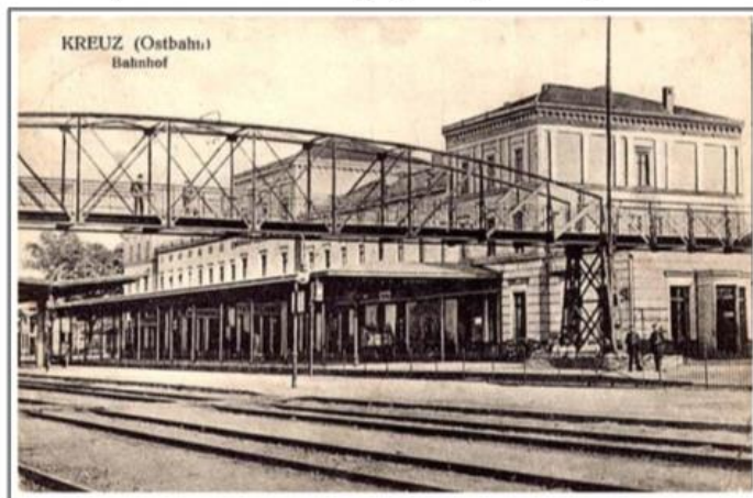
Rysunek 5. Dworzec kolejowy w Krzyżu Wielkopolskim

Gminny Program Opieki nad Zabytkami dla Gminy Krzyż Wielkopolski na lata 2024-2027