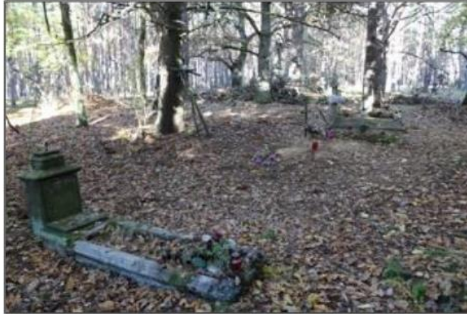
Rysunek 21. Cmentarz ewangelicki w miejscowości Wizany

Gminny Program Opieki nad Zabytkami dla Gminy Krzyż Wielkopolski na lata 2024-2027