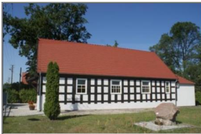
Rysunek 10. Kościół ewangelicki p.w. Matki Boskiej Częstochowskiej w Hucie Szklanej