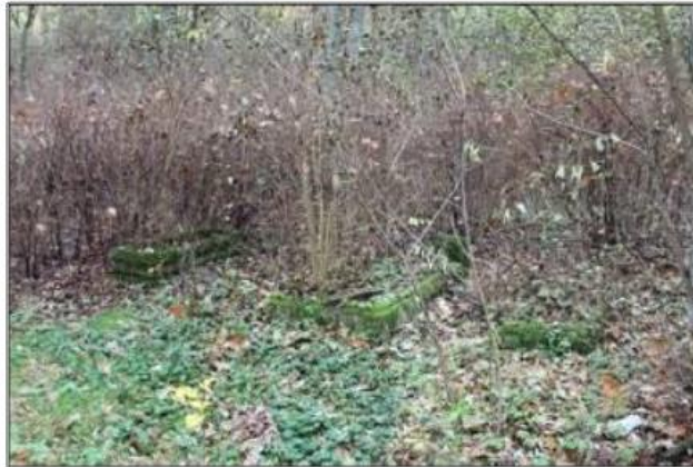
Rysunek 13. Cmentarz ewangelicko-augsburski w Hucie Szklanej

Stary cmentarz ewangelicko-augsburski w Hucie Szklanej, pochodzi z poł. XIX wieku. Jest on obecnie zaniedbany i zarośnięty, w bardzo złym stanie. Najstarszy nagrobek pochodzi z 1871 roku. Na terenie cmentarza pozostały fragmenty kaplicy i centralnie zlokalizowany krzyż. Cmentarz jest własnością gminną.