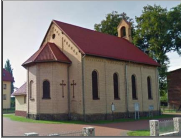
Rysunek 7. Kościół p.w. św. Antoniego Padewskiego w Krzyżu Wielkopolskim

Gminny Program Opieki nad Zabytkami dla Gminy Krzyż Wielkopolski na lata 2024-2027