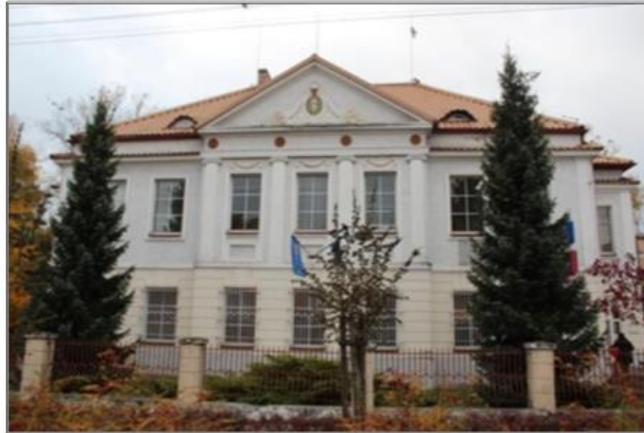
Rysunek 9. Budynek poczty w Krzyżu Wielkopolskim

Jego klasycystyczna fasada przywodzi na myśl pałac. Znajdujący się w niej pozorny ryzalit z jońskimi pilastrami zwieńczony jest tympanonem z kartuszem herbowym.