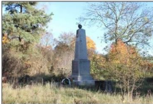
Rysunek 16. Cmentarz ewangelicki w miejscowości Lubcz Mały

Stary cmentarz ewangelicki, położony w miejscowości Lubcz Mały pochodzi z poł. XIX wieku. Występują na nim pojedyncze mogiły. Najstarsza mogiła pochodzi z roku 1890. W centralnej części cmentarza znajduje się granitowy obelisk poświęcony poległym w I wojnie światowej. Cmentarz jest własnością gminną. Obecnie cmentarz jest zaniedbany, zarosnięty i nieczynny. Gmina po uzyskaniu pozwolenia wojewódzkiego konserwatora zabytków prowadzi prace porządkowo-renowacyjne w zakresie: oczyszczania terenu z ekspansyjnej roślinności, montażu tablicy informacyjnej, a także postawienia i montażu powywracanych płyt nagrobnych i ich renowacji na podstawie programu prac konserwatorskich.