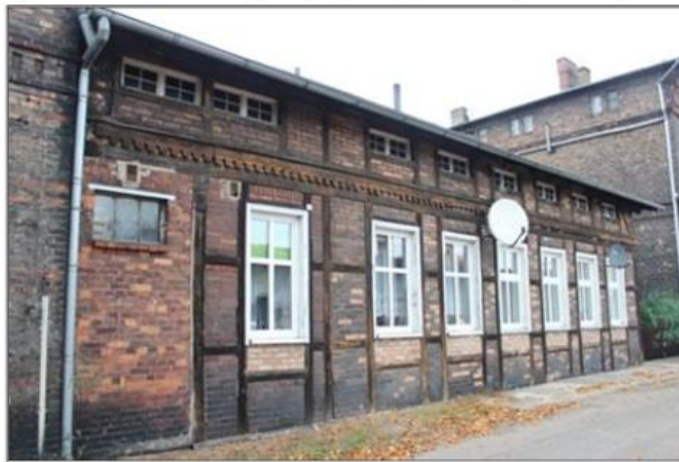
Rysunek 3. Zabudowa kolejowa przy ul. Rejtana w Krzyżu Wielkopolskim

Z dawnej zabudowy Krzyża Wielkopolskiego wyróżniają się wzniesione z czerwonej, nieotynkowanej cegły, częściowo szachulcowe budynki mieszkalne pierwszych pracowników kolejowych. Piętrowe, szachulcowe domy z mieszkalnymi poddaszami są przykładem niepowtarzalnej techniki budowlanej. Ich drewnianą konstrukcję wypełniono ceramiczną cegłą, pozostawiając elewacje nieotynkowane.