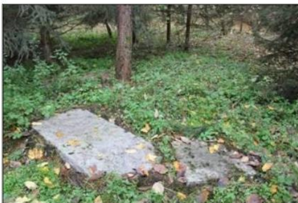
Rysunek 11. Cmentarz ewangelicko-augsburski w Blekotach (Zacisze)

Stary cmentarz ewangelicko-augsburski w Blekotach (Zacisze), pochodzi z 1 poł. XIX wieku. Jest on obecnie zaniedbany, zniszczony i zarośnięty. Najstarsza mogiła pochodzi z roku 1880. Cmentarz jest własnością Nadleśnictwa Krzyż.