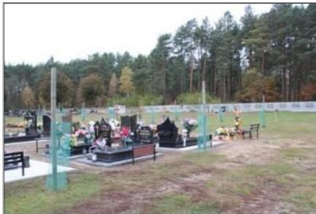
Rysunek 18. Cmentarz ewangelicki w miejscowości Łokacz Wielki

Stary cmentarz ewangelicki, położony w miejscowości Łokacz Wielki, pochodzi z końca XIX wieku. Obecnie wykorzystywany jest jako cmentarz komunalny Miasta Krzyż Wielkopolski. Najstarsza mogiła pochodzi z roku 1899. Cmentarz jest własnością gminną.