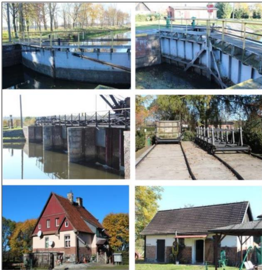
Rysunek 24. Stopień wodny „Krzyż nr 22” wraz z zabudową

Gminny Program Opieki nad Zabytkami dla Gminy Krzyż Wielkopolski na lata 2024-2027