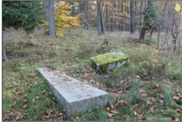
Rysunek 17. Cmentarz ewangelicki w miejscowości Lubcz Wielki

Gminny Program Opieki nad Zabytkami dla Gminy Krzyż Wielkopolski na lata 2024-2027