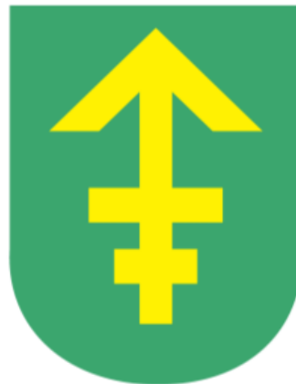
Rysunek 2. Herb Gminy Krzyż Wielkopolski

Zasady używania herbu określa Rada Miejska w Krzyżu Wielkopolskim. Użytkowanie herbu oraz barw Gminy zastrzega się również do wyłącznej dyspozycji Rady, a wykorzystanie ich przez inne podmioty jest możliwe po uzyskaniu zgody Rady Miejskiej.