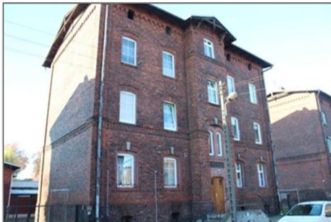
Rysunek 4. Zabudowa kolejowa przy ul. Krótkiej w Krzyżu Wielkopolskim

Gminny Program Opieki nad Zabytkami dla Gminy Krzyż Wielkopolski na lata 2024-2027