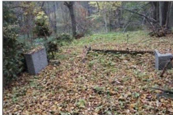
Rysunek 22. Cmentarz ewangelicki w miejscowości Żelichowo

Stary cmentarz ewangelicki, położony w miejscowości Żelichowo pochodzi z połowy XIX wieku. Obecnie jest zaniedbany i zarośnięty, zachowany w stanie szczątkowym. Najstarszy nagrobek pochodzi z 1888 r. Własność Nadleśnictwa Krzyż.