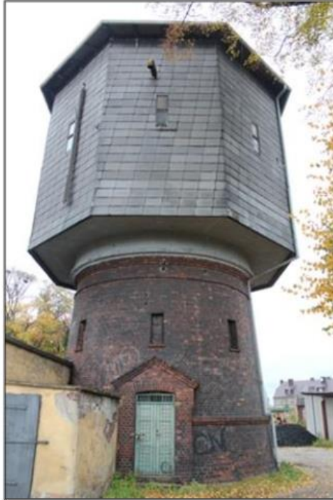
Rysunek 6. Wieża ciśnieni przy ul. Rejtana w Krzyżu Wielkopolskim

Gminny Program Opieki nad Zabytkami dla Gminy Krzyż Wielkopolski na lata 2024-2027