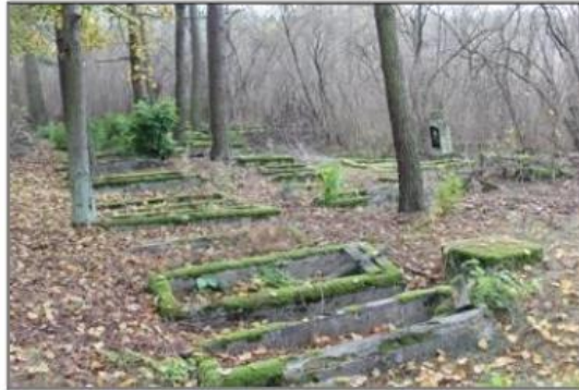
Rysunek 12. Cmentarz ewangelicko-augsburski w Brzegach

Stary cmentarz ewangelicko-augsburski w Brzegach pochodzi z poł. XIX wieku. Obecnie nieczynny. Najstarszy nagrobek pochodzi z roku 1872. Nieopodal znajduje się głaz pamiątkowy poświęcony poległym w I Wojnie Światowej. Cmentarz jest własnością gminną.