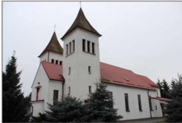
Rysunek 8. Kościół parafialny p.w. Najświętszego Serca Pana Jezusa w Krzyżu Wielkopolskim

Parafia p.w. Najświętszego Serca Pana Jezusa została utworzona na początku lat 20. XX w. i mieściła się w tymczasowych kaplicach na terenie miasta. Ostatecznie pozyskano teren pod budowę kościoła przy dzisiejszej ulicy Poznańskiej. Inwestycja trwała w latach 1935-1936, a świątynię poświęcono w 1937 r. Kościół jest jednonawowym obiektem o dwóch identycznych wieżach nakrytych namiotowymi hełmami usytuowanymi po bokach kruchty.