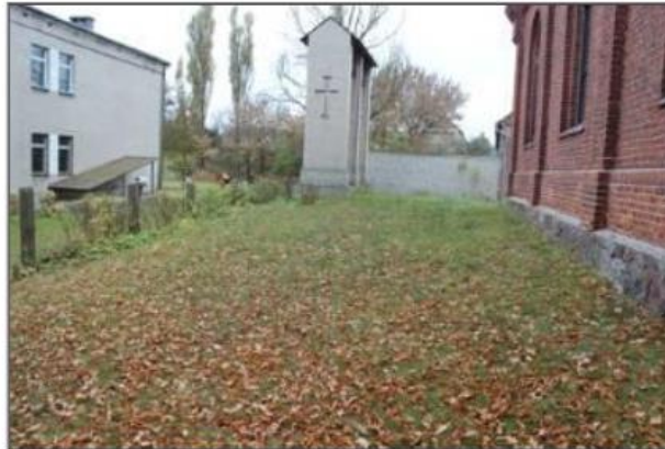
Rysunek 15. Cmentarz ewangelicki, ob. rzym.-kat. w Kuźnicy Żelichowskiej

Stary przykościelny cmentarz ewangelicki w Kuźnicy Żelichowskiej. Obecnie rzymsko-katolicki. Położony jest w zespole kościoła p.w. Serca Jezusowego. Pochodzi z 2 poł. XIX wieku. Na cmentarzu nie zachowała się żadna mogiła ani nagrobek. Zlokalizowany jest jedynie cokół pomnika ku czci poległych w czasie I wojny światowej. Cmentarz jest własnością kościelną.