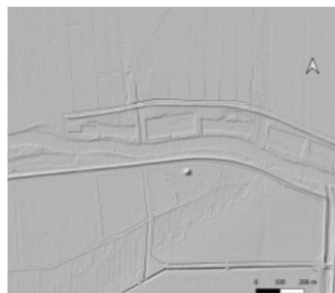
Fot. 2. Numeryczny model terenu gródka w Raczynie, gm. Szamocin