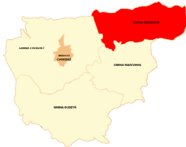
gmina Szamocin na mapie powiatu chodzieskiego

Pod względem geograficznym gmina Szamocin położona jest na skraju Doliny Środkowej Noteci i Pojezierza Chodzieskiego, stanowiącego północną część Pojezierza Wielkopolskiego. Rzeźba terenu została ukształtowana głównie przez formy polodowcowe. Północną granicę gminy wytycza rzeka Noteć, z szeroką, kilkukilometrową, płaską doliną pokrytą rozległymi łąkami, przechodzącą w kierunku południowym w pagórkowate, faliste tereny morenowe urozmaicone jeziorami, wśród których wyróżnia się największe Jezioro Laskowskie oraz grupa trzech niedużych jezior malowniczo usytuowanych wśród lasów, zwanych „Cygańskimi Dołami”.