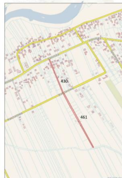
Mapa przedstawiająca przebieg drogi gminnej o nr ewid. 430 i 461 obręb Sławsk