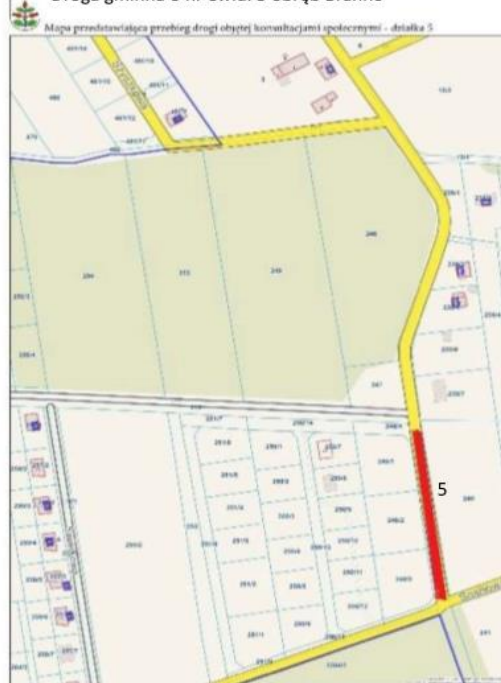
Droga gminna o nr ewid. 5 obręb Branno