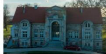
Fotografia 31. Widok na Dwór w Miedzianowie

Pałac to oryginalna budowla na rzucie krzyża greckiego, będąca połączeniem centralnej, oktogonowej sali z czterema prostopadłymi do niej skrzydłami bocznymi. W partii piwnic jest murowany z cegły i rudy darniowej. Ściany kondygnacji nadziemnych wzniesiono w konstrukcji szkieletowo-ryglowej z wypełnieniem ceglanym, którą oszalowano deskami w układzie sumikowo-łatkowym. Czterokondygnacyjną część centralną