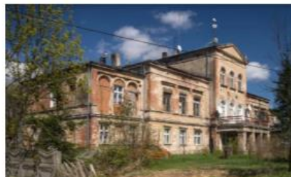
Fotografia 37. Widok na Pałac w Rossoszycy

Budynek neorenesansowego pałacu murowany, o konstrukcji wielobryłowej składającej się z dwukondygnacyjnego korpusu na planie prostokąta z trzykondygnacyjnym, centralnym ryzalitem zaopatrzonym w trójkątny fronton. Zawierał on kartusz z herbem Skórzewskich. Ryzalit ów posiadał wejście pod tarasem ze schodami prowadzącymi na drugą kondygnację. W elewacji ogrodowej ryzalit posiadał wyjście dodatkowe z tarasem.