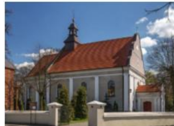
Fotografia 21. Widok na Kościół św. Marka Ewangelisty w Rososzycy