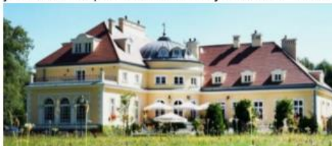
Fotografia 34. Widok na pałac w Bugaju

Obiekt wybudowano w latach 1750 – 1801. Pałac w Bugaju usytuowany w krajobrazowym parku stanowi przykład wysokiej klasy rezydencji ziemiańskiej na terenie Wielkopolski. Pałac posiada bardzo wyważone proporcje oraz harmonijnie ukształtowaną mimo rozbudowy bryłę. Pałac to murowany z cegły obiekt, na rzucie litery „L” z ówierćkolistym ryzalitem u zbiegu nowego skrzydła i starego dworu. Piwnice sklepione krzyżowo i odcinkowo. Północne skrzydło parterowe z mezzaninem nakryte czterospadowym dachem. Tzw. stary dwór nieco niższy, parterowy z mieszkalnym poddaszem pod wysokim trójspadowym dachem. Elewacje otynkowane wsparte na kamiennym cokole. Fasada symetryczna, pięcioosiowa, z dekoracjami sztukatorskimi. Jej część środkowa zwieńczona attyką i wazonem przeparta półkolistie zamkniętą arkadą ujętą kolumnami, z niższą wejściową mieszczącą drzwi. Wszelkie zabiegi remontowe i konserwacyjne przeprowadzono w pałacu z należytym pietyzmem i starannością.