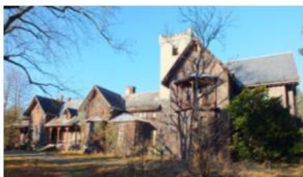
Fotografia 38. Widok pałac w Mojej Woli