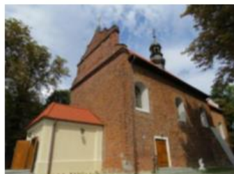
Fotografia 10. Kościół parafialny pw. Podwyższenia Krzyża Świętego.

Konstrukcji zrębowej, górna kondygnacja wieży konstrukcji słupowej, oszalowany. Orientowany. Wzniesiony na planie krzyża łacińskiego, z węższym prezbiterium zamkniętym trójbocznie. Od północy do prezbiterium przylega zakryta, do nawy od południa kruchtą z podcieniami wspartymi na słupach, a od zachodu wieża mieszcząca