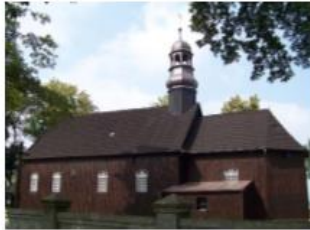
Fotografia 15. Widok na Kościół parafialny p.w. Najświętszej Marii Panny w Ociążu

Obecny drewniany kościół wzniesiony został po pożarze w 1785 r.