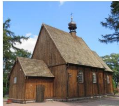
Fotografia 9. Kościół parafialny pw. św. Michała Archanioła.

Kościół jest orientowany, jednonawowy wzniesiony na planie kwadratu z węższym zamkniętym trójbocznie, prezbiterium. Do prezbiterium od pn. przylega zakrystia, do nawy od zach. i od pn. kruchty. Budowla drewniana, konstrukcji zrębowej posadowiona jest na kamienno-ceglanym podmurowaniu. Ściany zostały wzmocnione obustronnie liściami i oszalowane pionowo deskami. Nad nawą znajduje się więźba dachowa płatwiowo - kleszczowa, nad prezbiterium konstrukcji jętkowo - stolcowej. Wnętrze nawy kościoła pokrywają stropy drewniane płaskie z podsufitką z desek, w zakrystii i w kruchcie stropy belkowe. Wszystkie otwory okienne, portale drzwi zachowały się w oryginalnych profilowanych obramieniach.