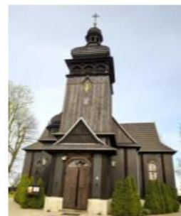
Fotografia 12. Widok na Kościół parafialny pw. św. Bartłomieja w Biskupicach Obłocznych