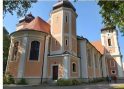
Fotografia 4. Widok na kościół parafialny pw. Św. Marcina w Odolanowie