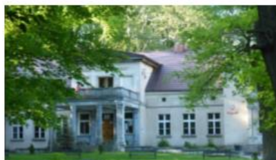
Fotografia 35. Widok na dwór w Parczewie

Zwrócony jest fasadą na południe, murowany, podpiwniczony, parterowy z piętrowym ryzalitem frontowym, nakryty niskim dachem dwuspadowym. Od wschodu skrzydło, od zachodu nowsza przybudówka. Od frontu podjazd. Ganek podjazdowy wsparty na dwóch kolumnach toskańskich filarach o kanelowych trzonach, nakryty tarasem. Część główna dwutraktowa, z holem i salonem na osi, skrzydło dawniej