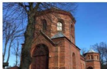
Fotografia 17. Widok na Kaplicę grobową Radziwiłłów, ob. kościół filialny pw. Matki Boskiej Ostrobramskiej w Antoninie