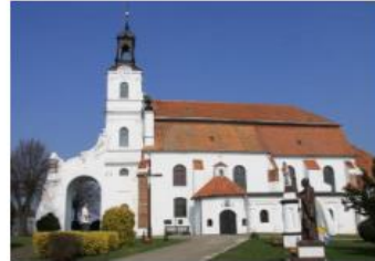
Fotografia 20. Widok na Kościół św. Jana Ewangelisty w Ołoboku

Kościół jednonawowy, z węższym, wschodnim prezbiterium zamkniętym od strony wschodniej trójbocznie i otwartym wysoką, półkoliście sklepioną arkadą na nawę. Od strony zachodniej prostokątnego korpusu nawowego przylega kwadratowa wieża mieszcząca w przyziemiu kruchtę z wejściowym otworem drzwiowym od strony północnej. Wieża ta wzniesiona na rzucie prostokąta