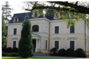
Fotografia 24. Widok na Pałac myśliwski w Bagateli

W 1879 roku wieki przebudowany został według projektów znanego polskiego architekta Zygmunta Gorgolewskiego na pałac myśliwski księcia Ferdynanda Radziwiła. Powstał piętrowy budynek, z drugim piętrem skrytym w mansardowym dachu dekorowanym lukarnami, z wąskim ryzalitem na osi mieszczącym wejście. Przez nakrycie oddzielnym czterospadowym dachem mansardowym ryzalit sprawia wrażenie wieżyczki. Elewacje pałacu są boniowane, podzielone prostym gzymsem kordonowym na dwie kondygnacje, zwieńczone profilowanym gzymsem koronującym. Prostokątne otwory okienne są ujęte wykonanymi w tynku opaskami, zamkniętymi zwornikami.