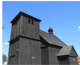
Fotografia 7. kościół parafialny pw. św. Mateusza Apostoła.

Zabytek znajduje się w zasobach kościoła rzymskokatolickiego.