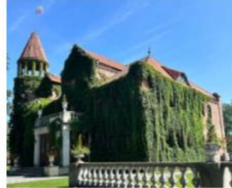
Fotografia 26. Widok na pałac w Gutowie

Cechą charakterystyczną jest wieża na planie elipsy. Elewacja pierwotnie była otynkowana, urozmaicona poziomym żłobkowaniem. Pałac w Gutowie wyróżnia się swoim L-kształtnym układem oraz charakterystyczną wieżą, co nadaje mu niepowtarzalny wygląd. Jego fasada jest bogato zdobiona, co podkreśla historyczny charakter budynku. Pałac otoczony jest pięknym parkiem, który dopełnia całość i tworzy malowniczą scenę.