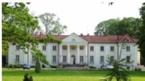
Fotografia 25. Widok na pałac w Górznie

Istniejący pałac wzniesiony w 1912 r. przez architekta Kazimierza Rucińskiego stanowi przykład neoklasycystycznej rezydencji wzniesionej w tzw. stylu narodowym, usytuowanej w krajobrazowym parku z 2 poł. XIX w.