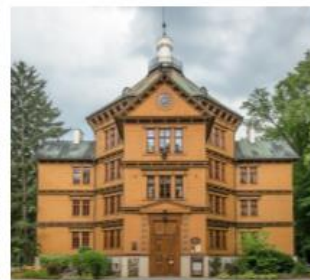
Fotografia 33. Widok na Pałac myśliwski w Antoninie

Pałac Niemojowskich jest budowlą typowo neogotycką, z cechami normandzkimi, wysoce geometryczny. Budowla jest murowana, posiada kilka brył dwu- i trzykondygnacyjnych, każda z nich okryta jest osobnym dachem