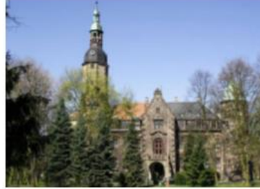
Fotografia 28. Widok na pałac w Sobótce

Pałac stoi na planie prostokąta, ma dwie wieże różnej wysokości. Korpus główny nakryty jest stromym dachem czterospadowym. Elewacje charakteryzują bogate detale z piaskowca. Pokoje rozmieszczone są w układzie amfiladowym tzn. drzwi są w jednej linii, bez korytarza, mają różną stylowo dekorację.