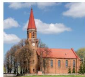
Fotografia 22. Widok na dawny kościół ewangelicki, ob. filialny polskokatolicki pw. Matki Bożej Królowej Polski i Podwyższenia Krzyża Świętego w Strzyżewie