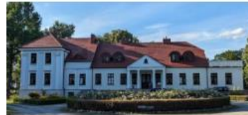
Fotografia 29. Widok na Dwór w Chotowie

Jest to niewielki, parterowy budynek klasycystyczny. Południowa, frontowa ściana budynku ozdobiona jest portykiem wspartym na czterech toskańskich kolumnach.