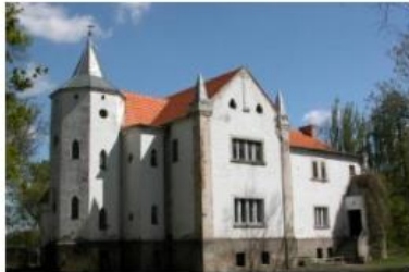
Fotografia 30. Widok na Dwór w Kotowiecku

rozbudowane oprawy okien), jednak w późniejszych latach detale zniknęły, a elewacje zostały otynkowane.