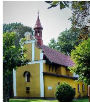
Fotografia 14. Widok na Kościół św. Mikołaja Biskupa w Gostycynie

Budowla jest orientowana, murowana, otynkowana. Posiada jedną nawę, prezbiterium jest prostokątne, węższe w stosunku do nawy. Przy nim od strony północnej jest umieszczona zakrystia. Przy nawie od strony północnej znajduje się wspomniana wyżej kaplica, od strony południowej jest umieszczona kruchta, nad którą mieści się kaplica otwierająca się do nawy. Na kalenicy znajduje się barokowa wieżyczka na sygnaturkę, nakryta dachem namiotowym. Na belce tęczowej jest umieszczony krucyfiks w stylu barokowym.