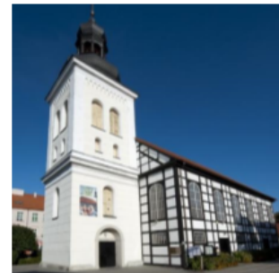
Fotografia 3. Widok na Kościół ewangelicki, ob. rzymskokatolicki pw. Matki Boskiej Królowej Polski w Ostrowie Wielkopolskim

Kościół wpisany do Rejestru Zabytków pod nr 581/A.