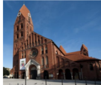
Fotografia 2. Widok na konkatedrę w Ostrowie Wielkopolskim

Konkatedra z całym zespołem budynków przykościelnych (plebania, Dom Katolicki, Konwikt, wikariat, ogród, grotta) jest wpisana do Rejestru Zabytków nr 440/Wk/A.