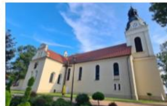
Fotografia 16. Widok na Kościół św. Katarzyny Aleksandryjskiej w Skalmierzycach

Zabytek znajduje się w zasobach kościoła rzymskokatolickiego.