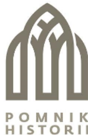
Rysunek 2. Logo pomnika historii

Terminem tym określa się zabytek nieruchomy o szczególnych wartościach materialnych i niematerialnych oraz znaczeniu dla dziedzictwa kulturowego naszego kraju. Rangę pomnika historii podkreśla fakt, że jest on ustanawiany przez Prezydenta Rzeczypospolitej Polskiej specjalnym rozporządzeniem na wniosek Ministra Kultury i Dziedzictwa Narodowego. W treści prezydenckiego rozporządzenia wyszczególnia się cechy danego zabytku świadczące o jego najwyższej wartości, określa się precyzyjnie jego granice i zamieszcza schematyczną mapkę obiektu. Na elitarną listę Pomników Historii mogą zostać wpisane obiekty architektoniczne, krajobrazy kulturowe, układy urbanistyczne lub ruralistyczne, zabytki techniki, obiekty budownictwa obronnego, parki i ogrody, cmentarze, miejsca pamięci najważniejszych wydarzeń lub postaci historycznych oraz stanowiska archeologiczne.