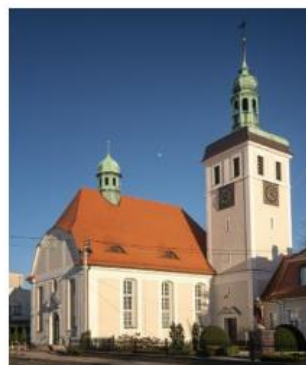
Fotografia 11. Widok na Kościół Matki Bożej Nieustającej Pomocy w Nowych Skalmierzycach