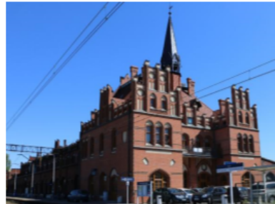
Fotografia 39. Widok na dworzec (daw. celny) w Nowych Skalmierzycach

W latach 1905–1906 wzniesiono nowy, reprezentacyjny dworzec w neogotyckim stylu, który miał podkreślać pruską potęgę na granicy ((wpisany do rejestru zabytków nr 1017/Wlkp/A, wpis 04. 01. 2017 r.). Obiekt zaprojektował rządowy architekt Blunck, a budowa prowadzona była przez firmę Daum & Kuhnt. Budynek o grubości murów około 70 cm, wykonany z czerwonej i zielonej cegły, był monumentalny — miał około 100 m długości i 21 m szerokości, z charakterystyczną wieżyczką-tamburem dzielącą perony dla pruskich i rosyjskich składów. Konwencja architektoniczna w odniesieniu do budownictwa kolejowego nie znajduje analogii na terenie Polski, co czyni dworzec na stacji Nowe Skalmierzycy unikatowym.