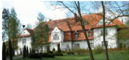
Fotografia 36. Widok na pałac Brodowskich w Psarach

Budynek jest rozbudowany o podpiwniczony taras ustawiony przy skarpie doliny. Murowany podpiwniczony, złożony z kilku brył parterowych z mieszkalnym poddaszem i piętrowych ryzalitów, nakryty osobnymi, osobnymi dachami mansardowymi trzy – i czterospadowymi, pokrytymi dachówką karpówką. Plan rozczłonowany z dwutraktowym skrzydłem wschodnim i wąskim łącznikiem, a także aneksem zachodnim posiadającym osobne wejście.