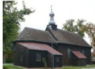
Fotografia 13. Widok na Kościół parafialny pw. Wszystkich Świętych w Droszewie

Kościół orientowany, wzniesiony na planie prostokąta z prezbiterium zamkniętym trójbocznie. Budowla jest drewniana, konstrukcji zrębowej, z zewnątrz oszalowana deskami. Od pn. przy nawie znajduje się kruchta i dostawiona do prezbiterium na początku XIX w. murowana zakrystia. Korpus główny kościoła nakryty dachem dwuspadowym, nad prezbiterium wielopołaciowym, nad zakrystią i kruchtą dachami jednospadowymi. Wszystkie połacie dachu pokryte są gontem. Nad całością dominuje wieżyczka na sygnaturkę zwieńczona ażurową latarnią z cebulastym hełmem, pokrytym blachą.