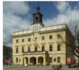
Fotografia 1. Widok na Ratusz w Ostrovie Wielkopolskim

Największym ośrodkiem jest Ostrowiec Wielkopolski (układ urbanistyczny wpisany do rejestru zabytków nr 683/A, wpis z 07.07.1993 r.), którego zabudowa miejska kształtowała się od średniowiecza, a dynamiczny rozwój nastąpił w XIX wieku wraz z rozwojem przemysłu i kolei. Historyczne centrum miasta, z zachowanym układem rynku i promienistym układem ulic, otoczone jest kamienicami z XIX i początku XX wieku, reprezentującymi zarówno eklektyzm, jak i wczesny modernizm. Dopelnieniem krajobrazu miejskiego są liczne budynki użyteczności publicznej, jak gmachy szkół, sądu czy dawne obiekty przemysłowe, które w wielu przypadkach zachowały pierwotny charakter architektoniczny.