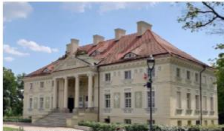
Fotografia 27. Widok na Pałac w Lewkowie

Pałac wybudowany w latach 1788-1791. Historycznie pałac był własnością rodu Lipskich herbu Grabie, którzy posiadali Lewków od XVIII wieku aż do 1939 r.