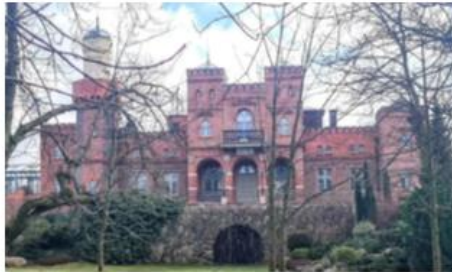
Fotografia 32. Widok na Pałac w Śliwnikach

pogrążonym, bądź też dwuspadowym. Niegdyś dachy te były pokryte wyłącznie blachą. Budynek zbudowany na planie prostokąta, dwutraktowy, z wieżami narożnymi posiadającymi schody, ryzalitem środkowym od północy i portykiem od południa. Od strony wschodniej w okresie międzywojennym dobudowano blok, który posiadał osobne wejście z zewnątrz.