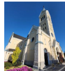
Fotografia 18. Widok na Kościół świętego Wojciecha w Jankowie Zaleśnym

Jest to dawna świątynia klasztorna Cysterek. Obecna, orientowana budowla, wzniesiona na przełomie XV i XVI wieku W latach 1780–1788 została przebudowana fasada zachodnia świątyni a także została dobudowana wieża dzwonnicza.