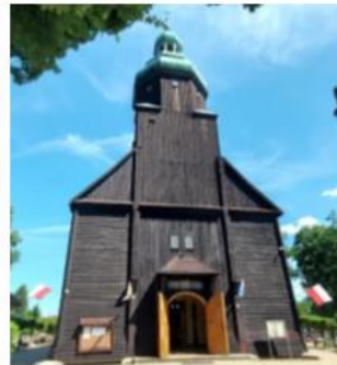
Fotografia 5. Widok na Kościół parafialny pw. Św. Barbary w Odolanowie

Zbór ewangelicki w Odolanowie wzniesiony został w latach 1777–1780. Ze względu na stan techniczny zbór był gruntownie restaurowany w latach 1875–1876 i 1892–1893 (zapewne wówczas konstrukcję szkieletową zastąpiono murami i otynkowano).