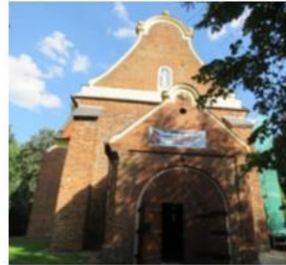
Fotografia 8. Kościół parafialny pw. Narodzenia NMP i św. Józefa.

Orientowany, murowany z cegły o układzie wendyjskim w dolnej partii ścian, w górnej w układzie gotyckim, jednonawowy z transeptem, z prezbiterium nieco niższym i węższym od nawy zamkniętym ścianą prostą. Kościół bezwieżowy o zwartej bryle. Do prezbiterium od północy przylega zakrystia, nad którą znajduje się skarbczyk. Przy ścianach szczytowych transeptu, prezbiterium i nawy szkarpy, zapewne późnogotyckie. Dachy kościoła dwuspadowe, kryte dachówką karpiówką. Okna zamknięte półkoliście, po przebudowie w końcu XVIII w. W ścianie zachodniej nawy i ścianie szczytowej prezbiterium znajdują się zamurowane ostrołukowe okienka. Od północy portal ostrołukowy, wczesnogotycki, trójskokowy, z profilowanej cegły. Zwieńczenia szczytu zachodniego oraz szczytów transeptu pochodzą z k. XVIII w. Świadczy o tym umieszczona na ich szczytach data - 1790 r. W fasadzie i szczycie zachodnim we wnęce umieszczono rzeźbę Matki Boskiej Niepokalanej.