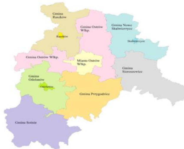
Rysunek 3. Podział administracyjny powiatu ostrowskiego

Powiat ostrowski leży w południowo-zachodniej części województwa wielkopolskiego w pradolinie rzek Proсны i Baryczy w dorzeczu rzeki Odry. Graniczy z województwem dolnośląskim oraz powiatami: krotoszyńskim, pleszewskim, kaliskim i ostrzeszowskim. Powiat ostrowski tworzy 8 jednostek administracyjnych: miasto Ostrów Wielkopolski (gmina miejska), Nowe Skalmierzyce, Odolanów, Raszków (gminy miejsko-wiejskie), Ostrów Wielkopolski, Przygodzice, Sieroszewice i Sośnie (gminy wiejskie).