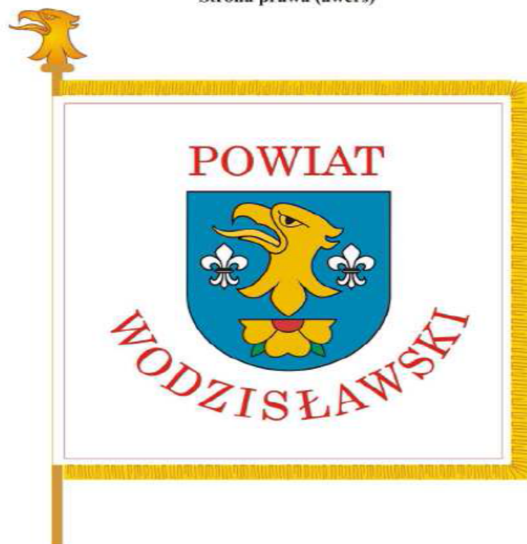
Strona prawa (awers)