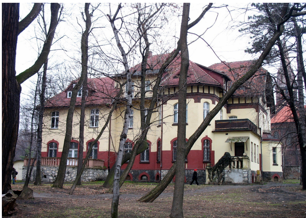
Willa przy ul. Oświęcimskiej 2

34. Wille przy ul. 1 maja 3, 5 – nr 3 własność prywatna; właściciel od lat nie użytkuje budynku, który niszczeje; nr 5 wpisana jest do rejestru zabytków i wykonano remont wnętrza.