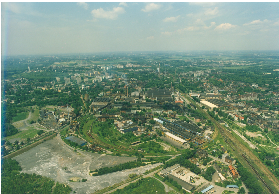
Fabryka Elementów Złącznych (rejon ulic Głowackiego, Matejki, Fabrycznej)