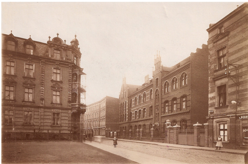
Ulica św. Barbary w I ćw. XX w.