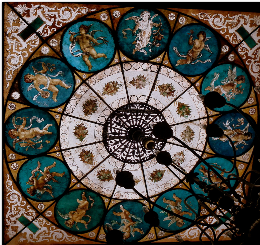
Świetlik w sali reprezentacyjnej willi Fitznera