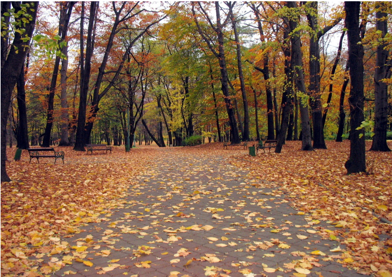
Aleja w Parku Miejskim