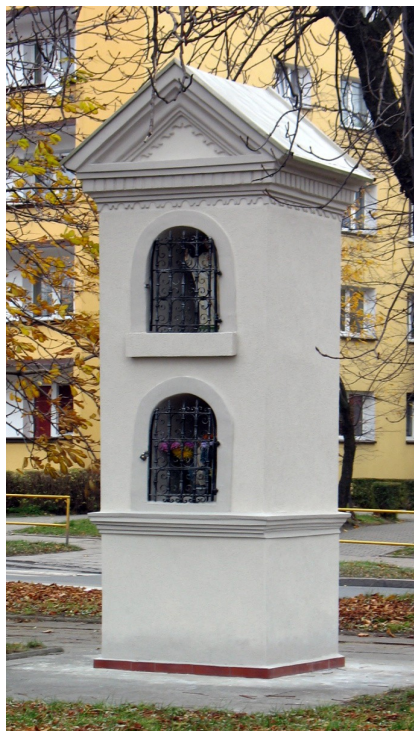
Kapliczka słupowa z ok. 1880 r. przy ul. Elizy Orzeszkowej

kilkanaście metrów z powodu realizacji nowych inwestycji. Część odnowili mieszkańcy (np. kaplicę św. Izydora w Przelajce). Staraniem władz miasta w latach 1998-2011 została odnowiona większość kapliczek i krzyży zlokalizowanych się na gruntach należących do gminy.