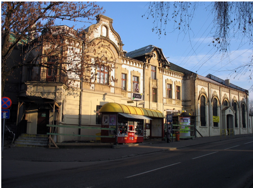
Siemianowickie Centrum Kultury przy ul. Niepodległości 45

Ufundowana przez Spółkę Akcyjną Zjednoczonych Hut Królewskiej i Laury w 1908 r. dla pracowników huty "Laura". Projekt wykonał budowniczy Emil Twrdy z Pszczelnika. Budynek z czerwonego klinkieru z białymi elementami zdobniczymi. Rozbudowany (przedłużony) w latach 70. XX w. przy czym usunięto wówczas szatnie znajdujące się na emporze. Usytuowany na obrzeżach zabytkowego parku „Hutnik”. Wyremontowany wewnątrz pod koniec XX w. i przywrócony do użytkowania.