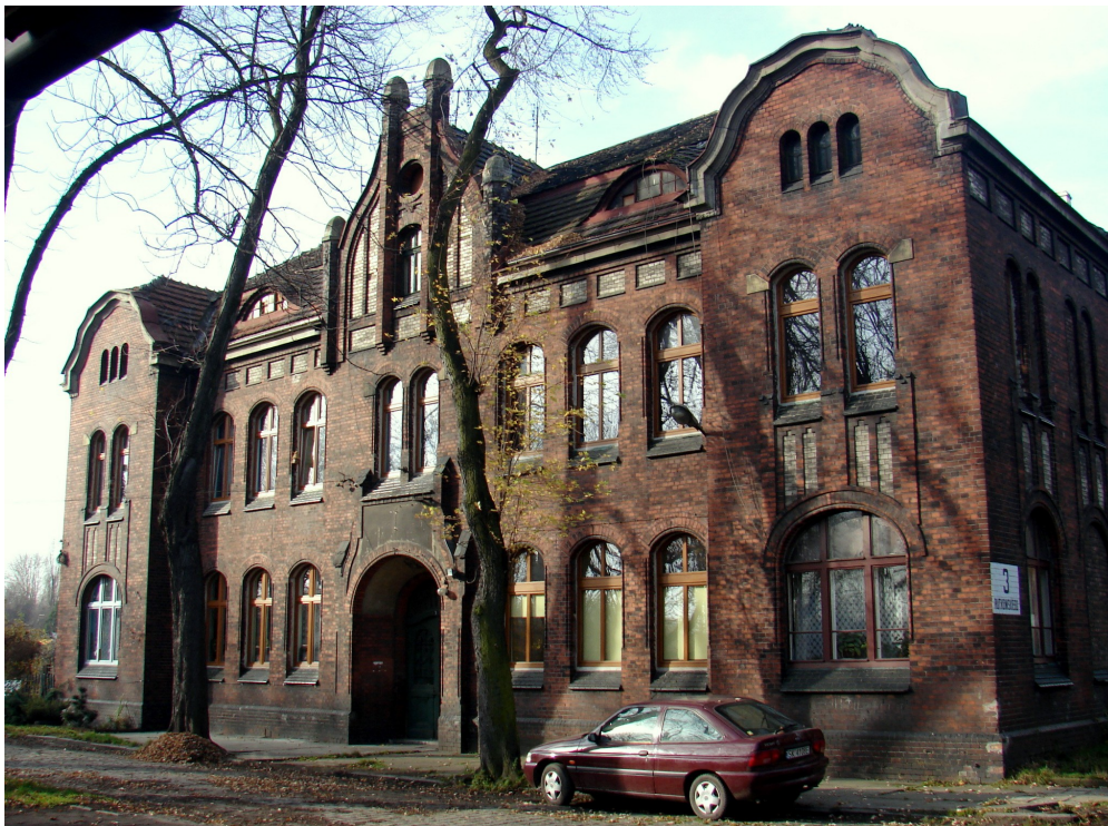
Dawny budynek administracji kopalni "Laurahuta" (rejon Ficusus)

7. Browar: objęty w zapisach aktualnie obowiązującego planu zagospodarowania przestrzennego ścisłą ochroną konserwatorską. Zakupiony przez prywatnego właściciela. Bez zgody Wojewódzkiego Konserwatora Zabytków zlikwidowana została linia produkcyjna browaru. Budynek restauracji został wyremontowany i przywrócono jego funkcję mieszkalną. Obecny właściciel zamierza pozostałe budynki browaru (produkcyjne) zaadaptować na lofty.