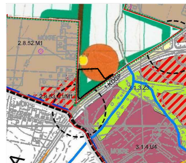
LEGENDA ZE STUDIUM UWARUNKOWAŃ I KIERUNKÓW ZAGOSPODAROWANIA PRZESTRZENNEGO PRZYJĘTEGO UCHWAŁĄ RADY MIEJSKIEJ MIKOŁOWA NR XXXIII/766/2013 Z DNIA 27 SIERPNI 2013R.